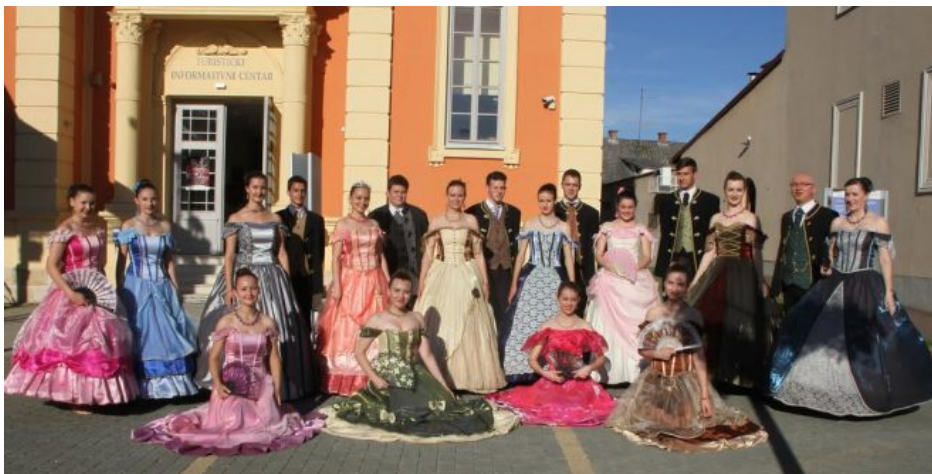
Slika 5. Potkalnički plemenitaši