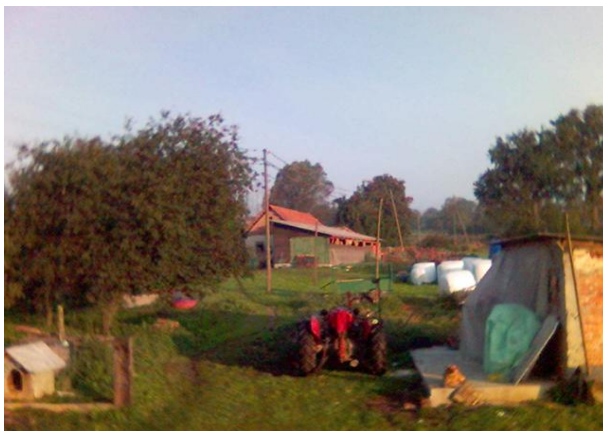
Slika 5.: OPG Žeger