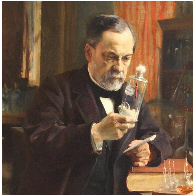
Slika 1. Louis Pasteur

Povijest upotrebe mlijeka kao prehrambene namirnice potječe od mlađeg kamenog doba, a tu tvrdnju pobija znanstvenik i povjesničar Paul Kindstedt. Tvrdeći da su nomadi koji su živjeli u to vrijeme bili netolerantni na laktozu u mlijeku. U 19. stoljeću širenjem željezničkog prometa, mlijekom se počelo opskrbljivati stanovništvo urbanih područja. Louis Pasteur, francuski biolog i kemičar, je 1863. godine otkrio proces pasterizacije. Mlijeko je namirnica koja se prerađuje u mnoge mliječne proizvode, a najpoznatija prerađevina je sir. Mlijeko i proizvodi od mlijeka gospodarska su djelatnost u poljoprivredi i u prehrambenoj mljekarskoj industriji koja koristi sirovo mlijeko kao sirovinu.