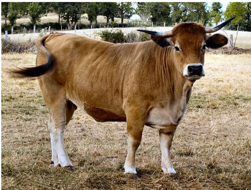
Slika 6. Krava aubrac pasmine

Izvor: https://upload.wikimedia.org/wikipedia/commons/9/90/Vache_Aubrac.jpg , (22.siječnja.2018.)