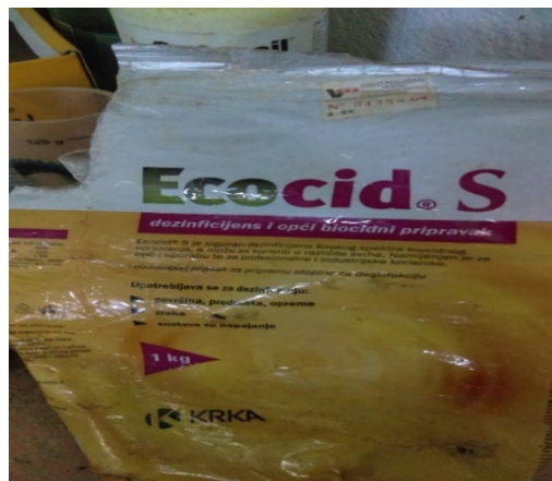
Slika 14. Ecocid®S (vodo-topivi prašak za pripremu otopine za dezinfekciju