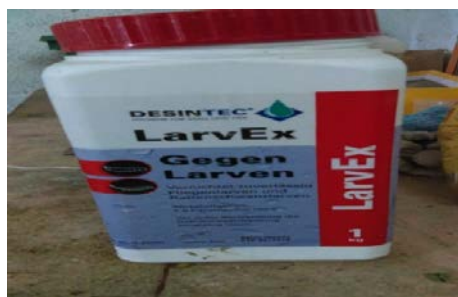
Slika 16. LarvEx Gegen Larven (Sredstvo za suzbijanje pojave ličinki)