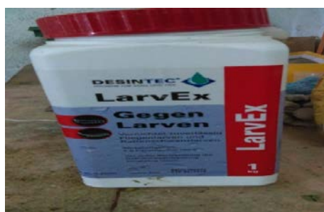
Slika 16. LarvEx Gegen Larven (Sredstvo za suzbijanje pojave ličinki)