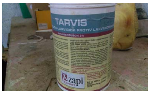
Slika 15. Tarvis (sredstvo za suzbijanje komaraca)