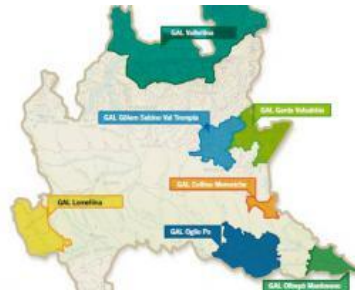
Slika 6. Pokrajine u Lombardiji