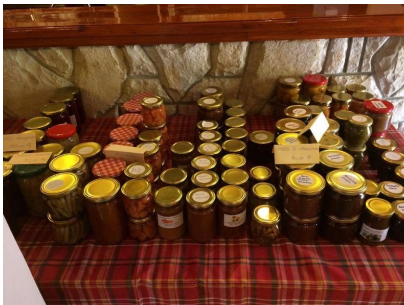
Slika 12: Domaća proizvodnja