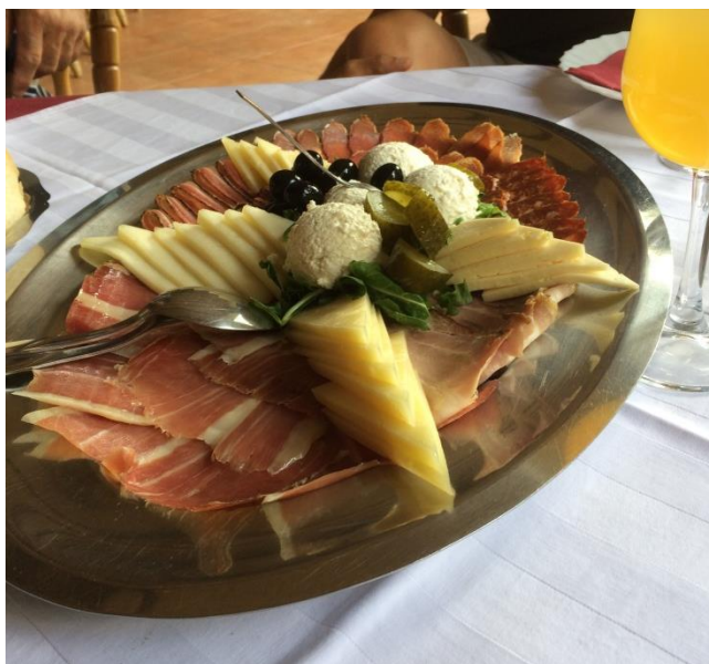
Slika 11: Domaći proizvodi agroturizma