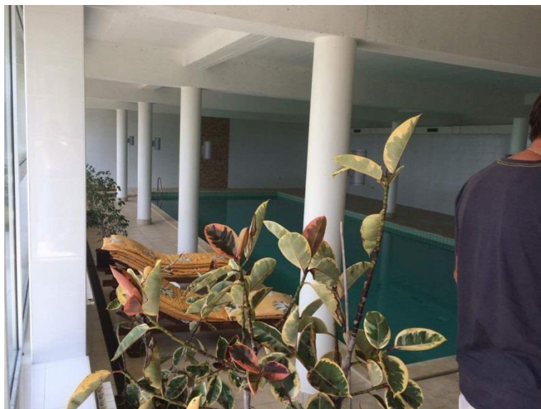
Slika 10: Bazen u unutarnjem dijelu imanja