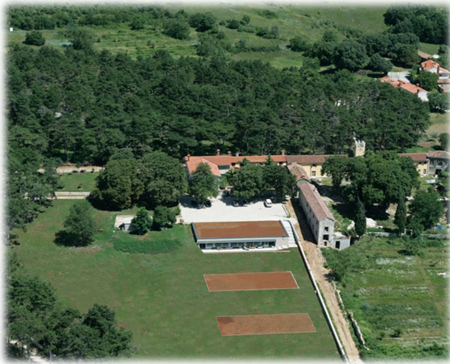
Slika 2. Imanje Agroturizma Pineta

Osim podataka iz intervjua, istraživanje se provodilo koristeći se Internet stranicom analiziranog gospodarstva, te dodatnim pitanjima koja su dodatno komunicirana putem e-maila.