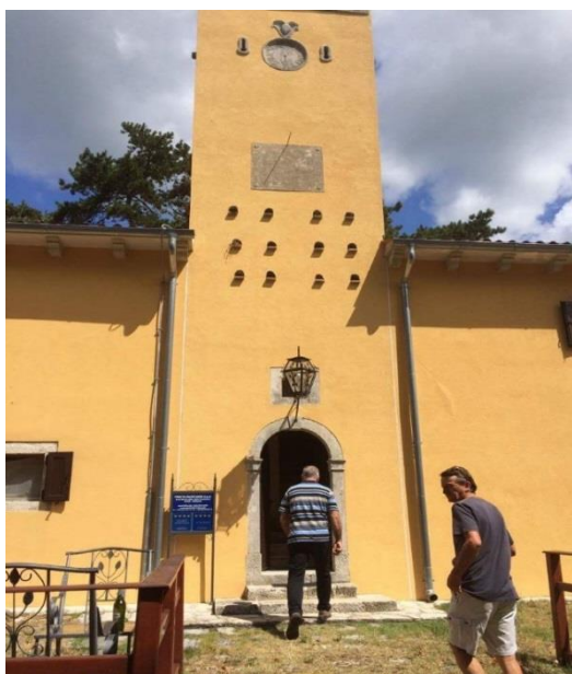
Slika 4. Ulaz u apartmane Agroturizma Pineta

Cijene noćenja ovise o veličini apartmana i o sezoni. U srcu sezone, točnije od 18. srpnja do 05. rujna, noćenje je najskuplje, čak do 136 €/dan. U zimskom razdoblju je najjeftinije, jednosoban apartman s bračnim krevetom može se dobiti za čak 48 €/dan. Za boravak kraći od tri dana, cijene se povećavaju za 20%.