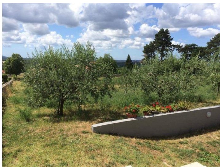
Slika 6: Maslinik