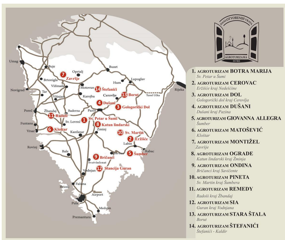
Slika 1. Agroturistički objekti Istre koji sudjeluju na manifestaciji „Dani otvorenih vrata agroturizama Istre“

promocije i animacije potencijalnih korisnika agrodomaćinstava (Rajko, 2013.). Osim što se zalaže se za identifikaciju i utvrđivanje tipičnih istarskih proizvoda, njihovu zaštitu i promociju, Agencija provodi i nekoliko uspješnih projekata vezano uz razvoj agroturizama na području Središnje Istre. Jedan od najuspješnijih i najpoznatijih projekata je projekt „Dani otvorenih vrata Agroturizama“, gdje se tijekom mjeseca studenog može doživjeti autentična istarska gastro priča kušajući domaće proizvode spremljene s ljubavlju na 14 obiteljskih poljoprivrednih gospodarstava (slika 1). O spomenutoj manifestaciji će biti više riječi u rezultatima istraživanja, s obzirom da i analizirano gospodarstvo Pineta također sudjeluje u tome.