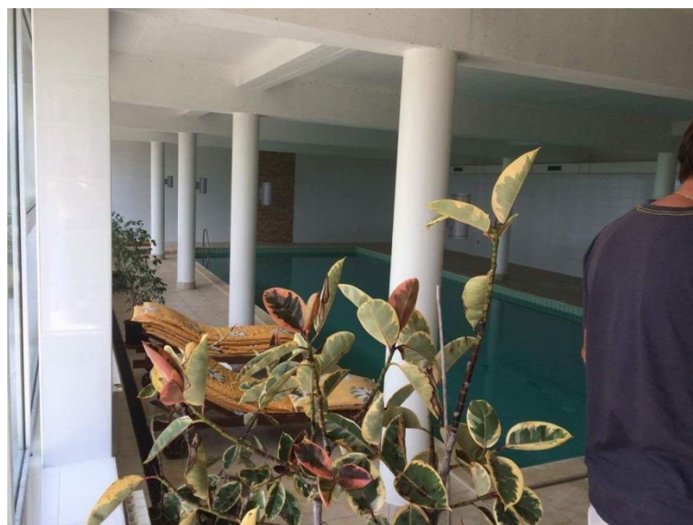
Slika 10: Bazen u unutarnjem dijelu imanja