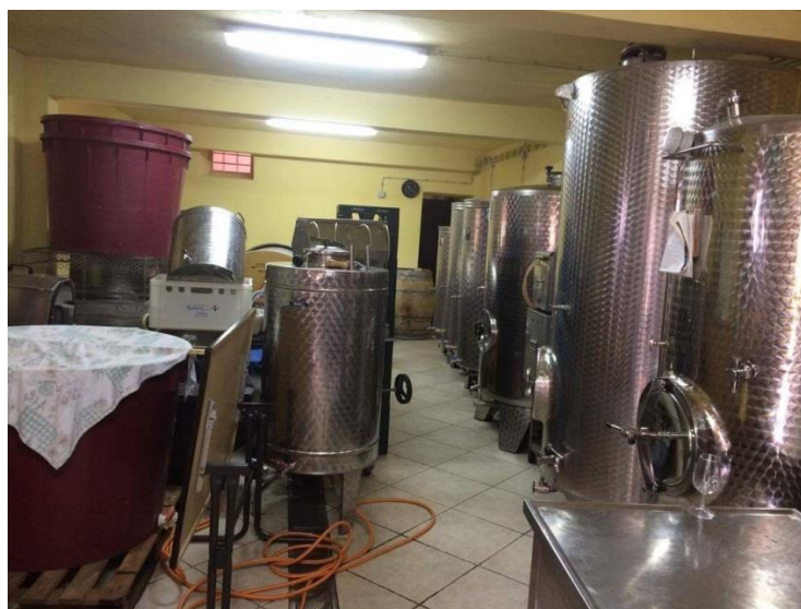
Slika 8: Vinski podrum