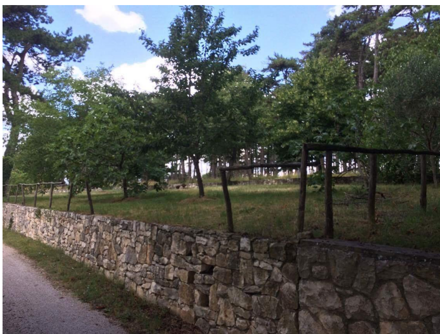
Slika 7: Eksterijer Agroturizma Pineta