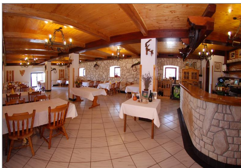
Slika 9: Interijer restorana