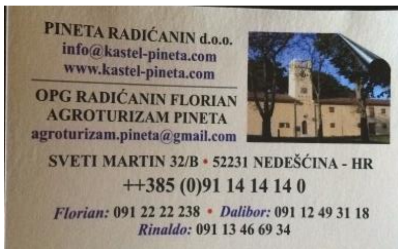
Slika 13. Posjetnica Agroturizma Pineta