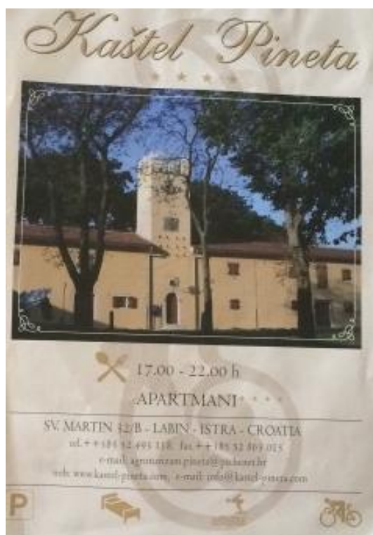
Slika 14. Letak Agroturizma Pineta