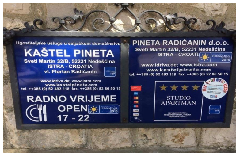
Slika 5. Agroturizam Pineta