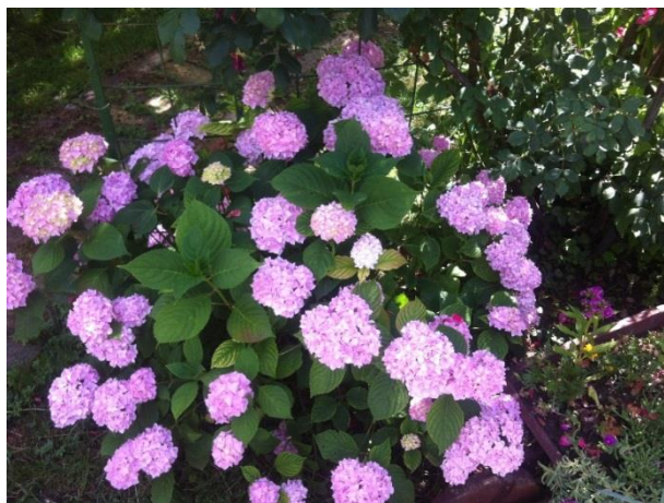
Slika 9. Boja cvjeta hortenzije na uzorku tla 1.