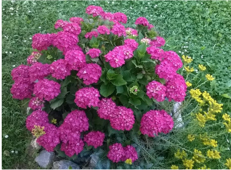
Slika 12. Hortenzija tamnoroze bolje cvijeta na uzorku tla 8.