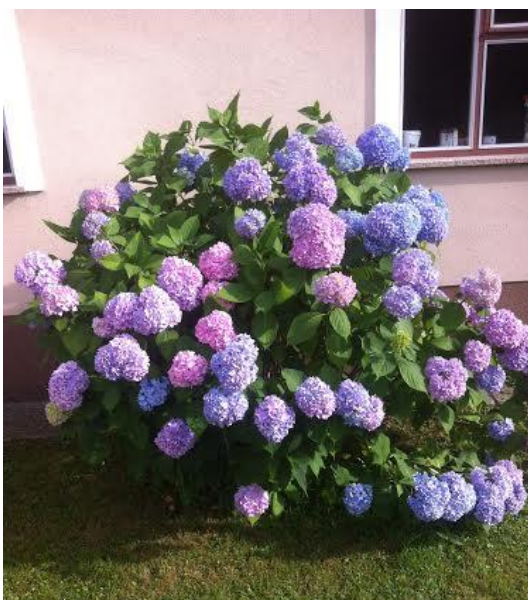
Slika 11. Višebojna hortenzija na uzorku tla 6.