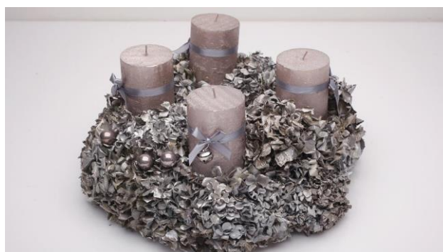
Slika 2. Adventski vjenčić od hortenzija

Cvjetovi se slažu u buketiće, vješaju na suho, tamno i prozirno mjesto. Osušena vrlo je efektivna za različite aranžmane od suhog cvijeća, adventske i uskrсне vjenčice (slika 2.).