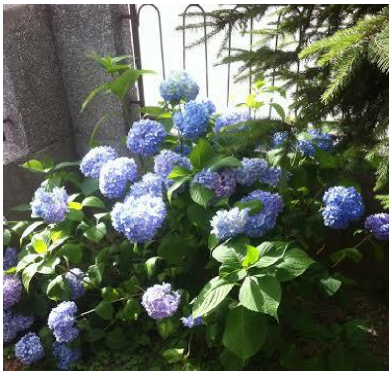
Slika 10. Boja cvijeta hortenzije na uzorku tla 9.