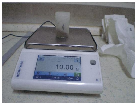
Slika 7. Vaganje uzoraka na preciznoj vagi

Prije samog analiziranja uzoraka pH-metrom, osušeni se uzorak tla usitnjava u porculanskom tarioniku. Nakon toga, uzorci su prosijavani kroz sito da bi se odvojile krupnije čestice zemlje od sitnijih. Dio uzoraka koji prođe kroz sito nazivamo sitnica ili sitna frakcija, a dio koji se zadrži na situ nazivamo krupna frakcija. Nakon toga, vagani su na preciznoj vagi po 10 g (slika 7.) za otopinu kalijevog klorida (KCl) i 10 g za suspenziju tla u vodi (H 2 O) za svih jedanaest uzoraka. Uzorci su podijeljeni u dvije grupe. U grupi za pH-H 2 O dodano je 25 ml vode, a u grupi za pH- KCl dodano je 25 ml KCl-a. Nakon dodavanja otopina, uzorci se mućkaju, a zatim je nakon 24 sata izmjerena pH-vrijednost suspenzija. Nakon toga, uzorci su analizirani pomoću pH metra. Prije uranjanja elektrode u uzorak, pH metar je kalibriran u puferskoj otopini poznate pH-vrijednosti. Neposredno prije mjerenja, uzorak sa suspenzijom je promućkan, te je zatim uronjena elektroda. pH-metar je pokazao rezultate sa tri decimale (slika 8.).