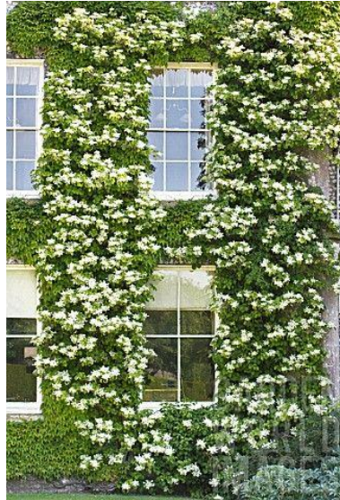
Slika 5. Hydrangea anomala var. petiolaris