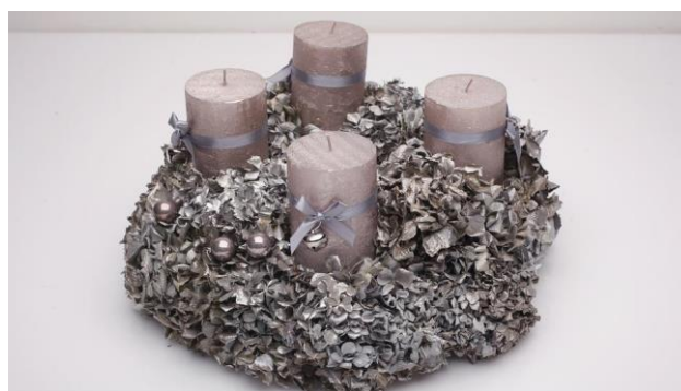
Slika 2. Adventski vjenčić od hortenzija

Cvjetovi se slažu u buketiće, vješaju na suho, tamno i prozirno mjesto. Osušena vrlo je efektivna za različite aranžmane od suhog cvijeća, adventske i uskrсне vjenčice (slika 2.).