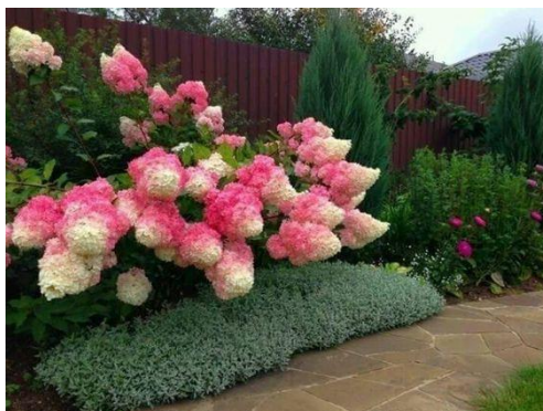
Slika 4. Hydrangea paniculata Vanille fraise pruning

ljetu i ranu jesen. Uzgojni oblik grandiflora ima cvjetne glave duge do 45 centimetara. Zahtjeva plodnu zemlju koja zadržava vlagu i položaj na suncu ili u blagoj sjeni kao i ostale vrste hortenzija.