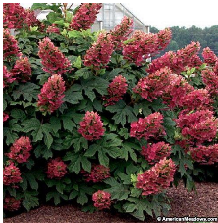
Slika 6. Hydrangea quercifolia

Vrsta Hydrangea quercifolia ili hrastovolisna hortenzija jedna je od najljepših hortenzija. Listovi su vrlo slični listovima američkog hrasta, tijekom proljeća i ljeta su tamnozeleni, a u jesen postaju narančasto crveni. Cvjetovi su na duguljastom bogatom grozdastom cvatu bijele boje, zatim poprimaju ružičastu boju, a u jesen su smeđi. Ova hortenzija uzgaja se u SAD-u a kod nas je vrlo rijetka. Podnosi temperature do -10\text{ }^{\circ}\text{C} , te u našem klimatu za uzgoj ove hortenzije treba birati mjesta zaštićena od vjetrova i mraza.