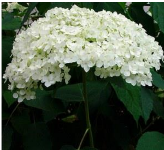
Slika 3. Hortenzija Hydrangea arborescens Annabelle

Vrsta Hydrangea arborescens ili glatka hortenzija je otporan bjelogorični grm s velikim cvjetnim glavama oblika pahalice, gusto načičkanim mutno bijelim cvjetovima od sredine do kasnog ljeta, a ponekada i rane jeseni. Uzgojni oblik grandiflora ima veće, čisto bijele cvjetne glave (slika 3.). Uspijeva na plodnim tlima koja zadržavaju vlagu i položaj na suncu ili u blagoj sjeni. Nužno je orezivanje. U kasnu zimu ili rano proljeće jako se podrežu izdanci koji su cvjetali tijekom prethodne godine.