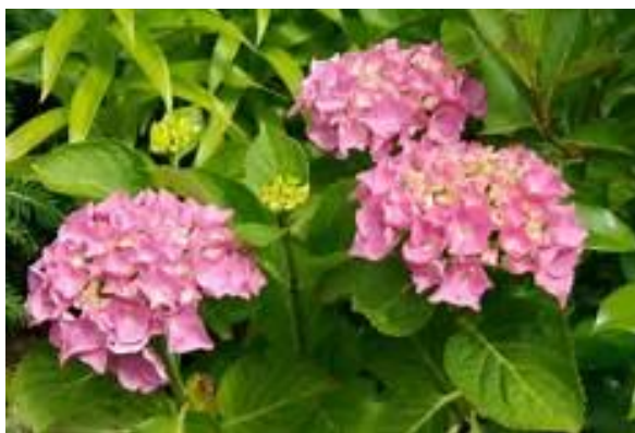
Slika 1. Hydrangea macrophylla