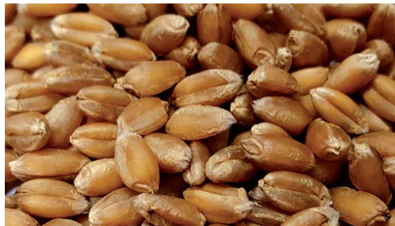
Slika 2. Pšenica Bc Anica

Za ozimu pšenicu Bc Anicu kažu da je najbolja u regiji. Ona je rana golica, visine do 80 cm s odličnom otpornošću na polijeganje i odličnom otpornošću na bolesti. Ima vrhunski i stabilni urod, sadržaj proteina 12,59 – 15, 96 %, te vrlo visoku hektolitarsku masu, u pravilu uvijek iznad 80 kg/hL. Rekordan urod iznosi 9 542 kg / ha , a prema podacima makropokusa u 2016. godini provedenim na tri lokacije, prosječni prinos bio je 8 611 kg/ha.