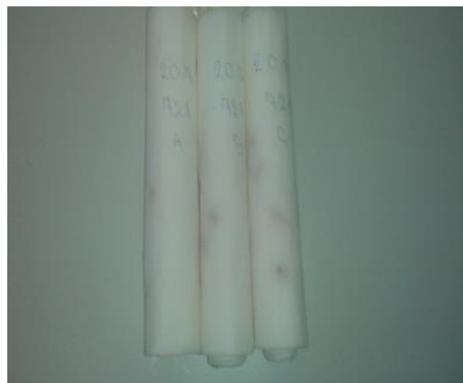
Slika 13. Uzorci na podlozi