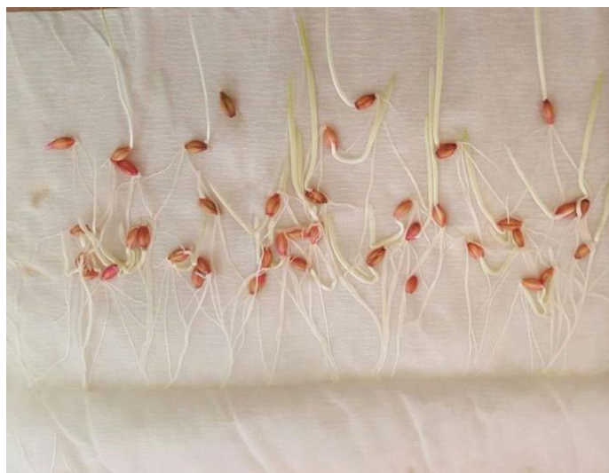
Slika 27. Ječam Bc Vedran – bez pred tretmana –drugo istraživanje