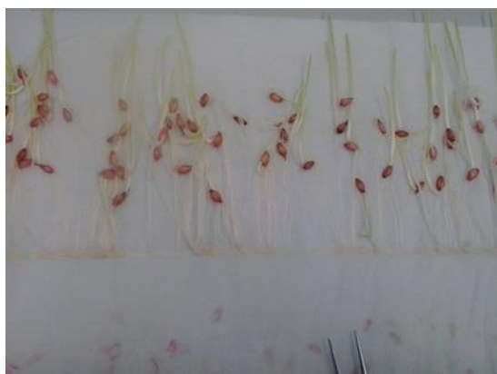
Slika 15. Uzorci nakon naklijavanja