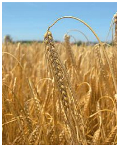
Slika 5. Ječam Bc Bosut

Za Bc Bosut kažu da je najraniji visoko rodni ječam, dvoredni ječam rane vegetacije. Visine do 90 cm s vrlo dobrom otpornošću na polijeganje, te odlične otpornosti na pepelnicu ( Blumeriella graminis ). Bc Bosut je standard za urod i kvalitetu. Prema podacima makropokusa u 2016. godini provedenim na tri lokacije, prosječni prinos bio je 8 008 kg/ha.