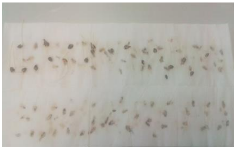
Slika 28. Pravi pir / Bc Vigor – bez pred tretmana –prvo istraživanje