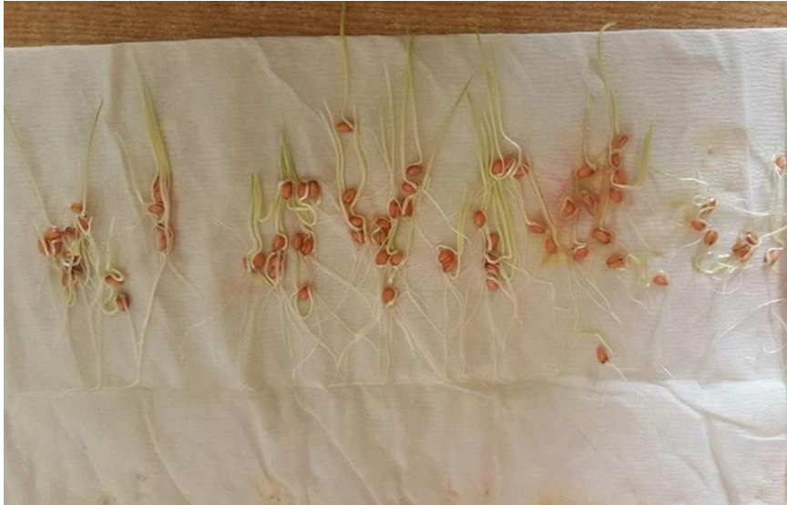
Slika 23. Pšenica Bc Darija – bez pred tretmana –drugo istraživanje