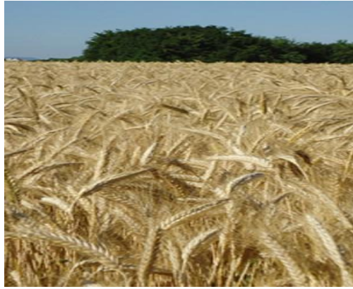
Slika 7. Triticale Bc 6315