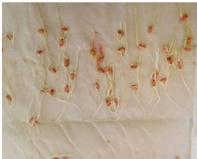
Slika 19. Tritikale / Bc 6315 - bez pred tretmana – drugo istraživanje