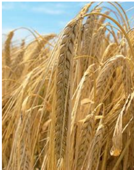
Slika 6. Ječam Bc Vedran

Za Bc Vedran kažu da je najrodniji i najzdraviji ječam, dvoredni ječam srednje kasne vegetacije, s dobrom otpornošću na polijeganje, visine do 88 cm. Otporan je na bolesti, te odličnog uroda i visoke kvalitete zrna. Prema podacima makropokusa u 2016. godini provedenim na tri lokacije, prosječni prinos bio je 8 905 kg/ha.