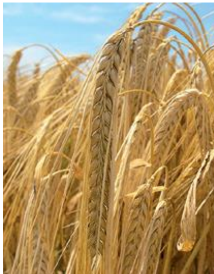
Slika 6. Ječam Bc Vedran

Za Bc Vedran kažu da je najrodniji i najzdraviji ječam, dvoredni ječam srednje kasne vegetacije, s dobrom otpornošću na polijeganje, visine do 88 cm. Otporan je na bolesti, te odličnog uroda i visoke kvalitete zrna. Prema podacima makropokusa u 2016. godini provedenim na tri lokacije, prosječni prinos bio je 8 905 kg/ha.