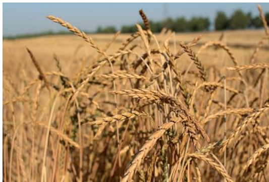
Slika 4. Pravi pir Bc Vigor

Bc Vigor je jedina hrvatska sorta pira. Ona je drevna krušarica kasne vegetacije i visoke nutritivne vrijednosti pljevičastog zrna. Ima odličnu otpornost na bolesti, te je pogodan za ekološku proizvodnju. Prema podacima makropokusa u 2016. godini provedenim na tri lokacije, prosječni prinos bio je 6 823 kg/ha.