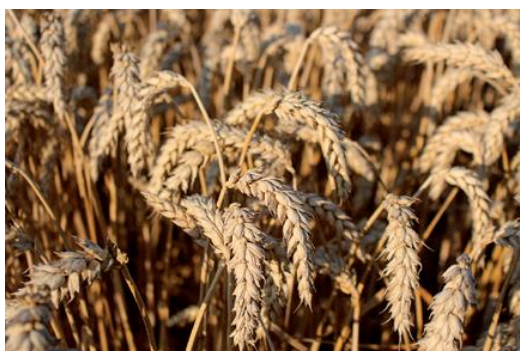
Slika 3. Pšenica Bc Darija

Za ozimu pšenicu Bc Dariju kažu da ima odličan urod i kvalitetu. Ona je rana je golica, visine do 85 cm s odličnom otpornošću na polijeganje i na bolesti, te je prilagodljiva na sve tipove tla. Sadržaj proteina je 12,70 – 14, 43 % , hektolitarska masa je u pravilu uvijek iznad 80 kg/hL. Njen rekordni urod je 9 618 kg / ha, a prema podacima makropokusa u 2016. godini provedenim na tri lokacije, prosječni prinos bio je 8 467 kg/ha.