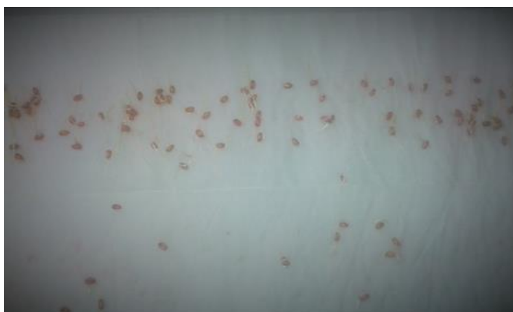
Slika 22. Pšenica Bc Darija – bez pred tretmana –prvo istraživanje