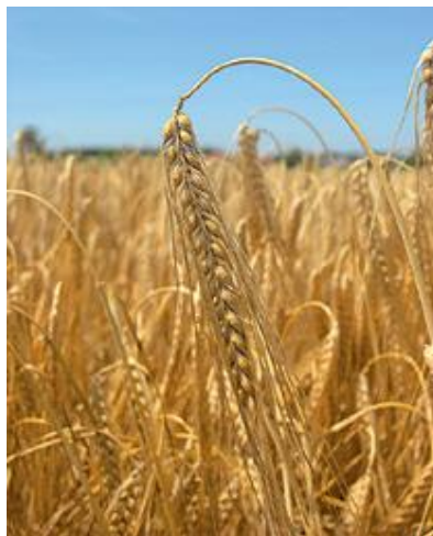
Slika 5. Ječam Bc Bosut

Za Bc Bosut kažu da je najraniji visoko rodni ječam, dvoredni ječam rane vegetacije. Visine do 90 cm s vrlo dobrom otpornošću na polijeganje, te odlične otpornosti na pepelnicu ( Blumeriella graminis ). Bc Bosut je standard za urod i kvalitetu. Prema podacima makropokusa u 2016. godini provedenim na tri lokacije, prosječni prinos bio je 8 008 kg/ha.