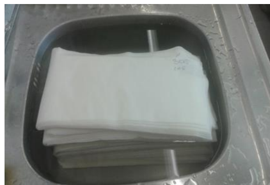
Slika 11. Namakanje filter papira