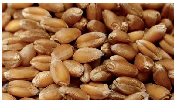
Slika 2. Pšenica Bc Anica

Za ozimu pšenicu Bc Anicu kažu da je najbolja u regiji. Ona je rana golica, visine do 80 cm s odličnom otpornošću na polijeganje i odličnom otpornošću na bolesti. Ima vrhunski i stabilni urod, sadržaj proteina 12,59 – 15, 96 %, te vrlo visoku hektolitarsku masa, u pravilu uvijek iznad 80 kg/hL. Rekordan urod iznosi 9 542 kg / ha , a prema podacima makropokusa u 2016. godini provedenim na tri lokacije, prosječni prinos bio je 8 611 kg/ha.