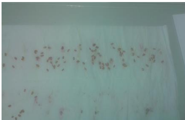
Slika 20. Pšenica Bc Anica – bez pred tretmana –prvo istraživanje