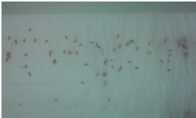
Slika 18. Tritikale / Bc 6315 - bez pred tretmana – prvo istraživanje