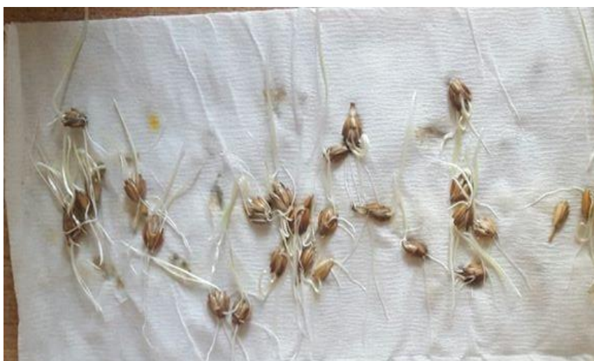
Slika 29. Pravi pir / Bc Vigor – bez pred tretmana –drugo istraživanje