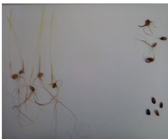
Slika 16. Prikaz normalnih klijanaca, abnormalnih i mrtvih