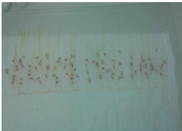
Slika 24. Ječam Bc Bosut – bez pred tretmana –prvo istraživanje