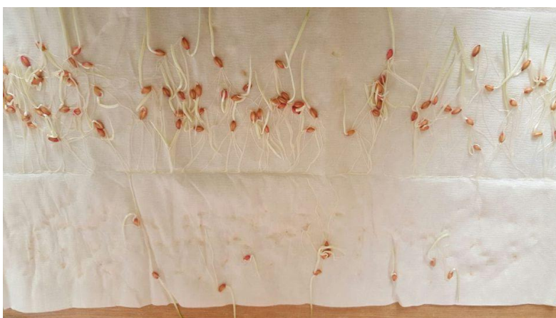
Slika 21. Pšenica Bc Anica – bez pred tretmana –drugo istraživanje