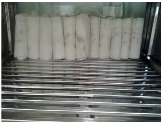
Slika 14. Uzorci u kljalištu