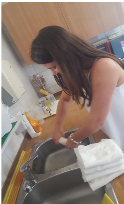
Slika 12. Odstranjivanje viška vode