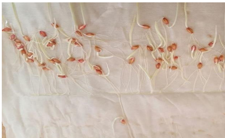
Slika 25. Ječam Bc Bosut – bez pred tretmana –drugo istraživanje