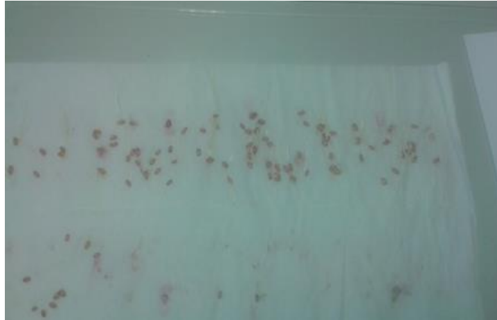
Slika 20. Pšenica Bc Anica – bez pred tretmana –prvo istraživanje