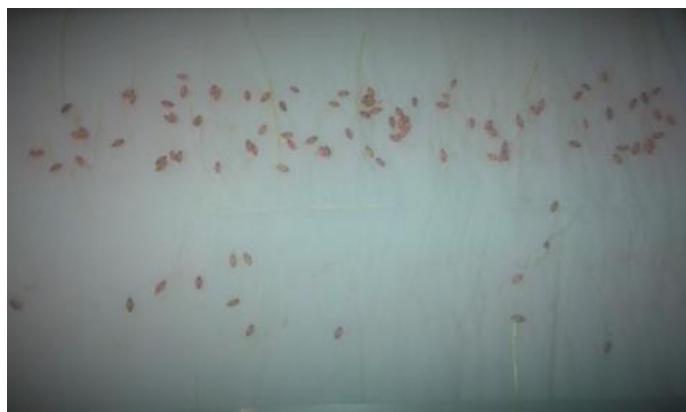
Slika 26. Ječam Bc Vedran – bez pred tretmana –prvo istraživanje