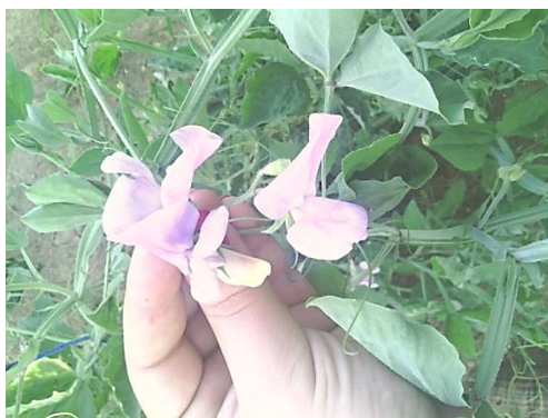
Slika 17. Svjetlo ružičasti cvjetovi