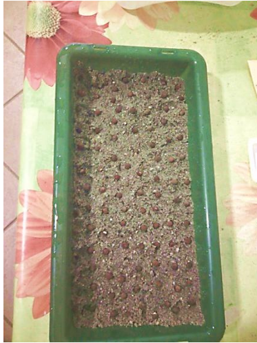
Slika 10.Sjeme u posudi za naklijavanje