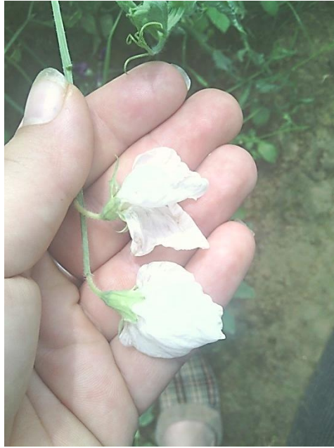
Slika 19. Bijeli cvjetovi