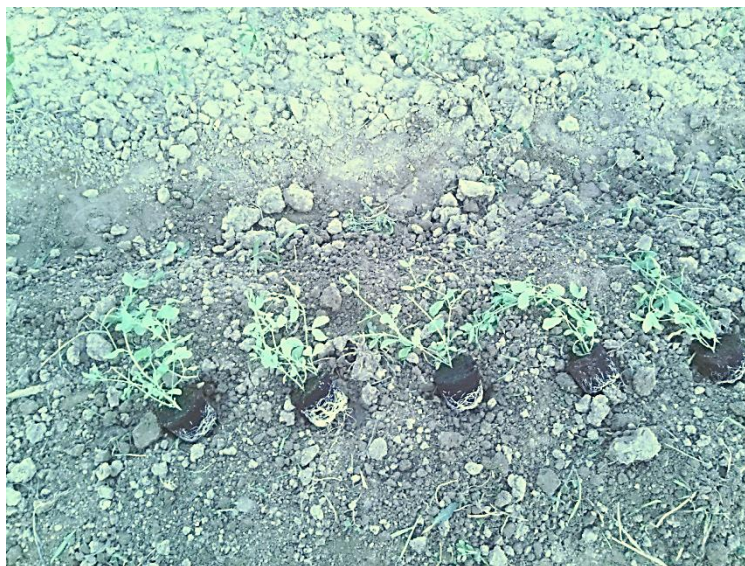
Slika 7. Sadnja presadnica ukrasne grahorice

Presadnice su u cvjetnim lončićima polovicom svibnja premještene iz plastenika na otvoreno, kako bi se privikle na vanjske uvjete. Na tlo pripremljeno za sadnju štihanjem i prekapanjem motičicom, 29. svibnja 2016. presađene su presadnice na uzdignute gredice. Ukupno je posađeno 20 biljaka, 10 biljaka na sunčano stanište i 10 biljaka na sjenovito stanište razmak sadnje između redova od 20 cm.