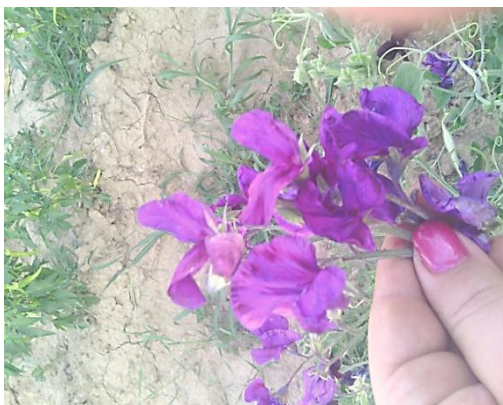
Slika 18. Svjetlo ljubičasti cvjetovi