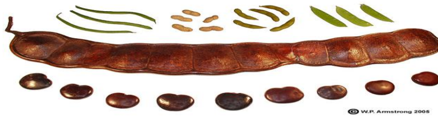
Slika 4. Mahuna