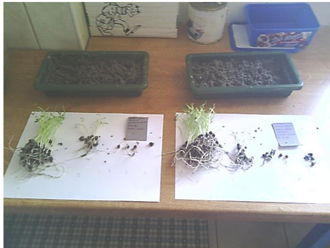
Slika 11.Brojenje klijanaca