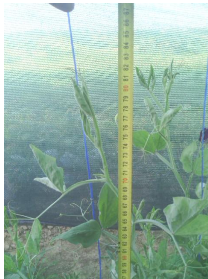
Slika 9. Mjerenje visine biljaka u cvatnji u sjenovitom staništu

Tijekom vegetacije mjerena je visina biljke, broj cvjetnih grana i broj cvjetova. Visina biljaka mjerena je 16. srpnja 2016., u punoj cvatnji, mjerene su sve biljke, a rezultat je izražen kao aritmetička sredina.