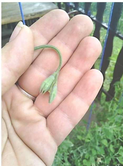
Slika 12. Pupanje