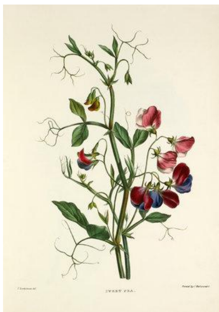
Slika 5. Ukrasna grahorica