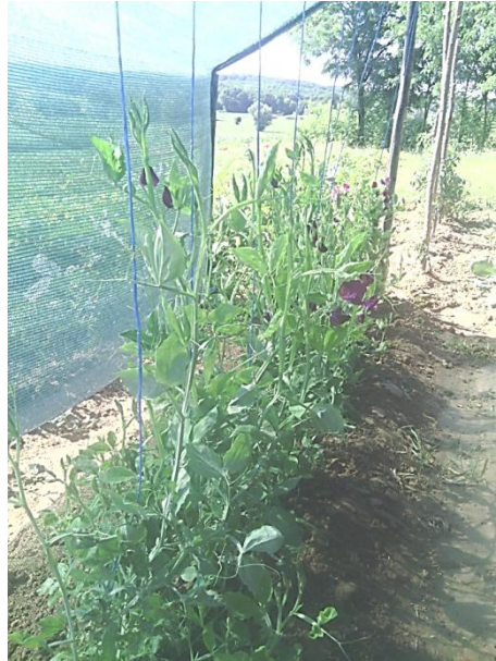
Slika8. Postavljena armature i mreže