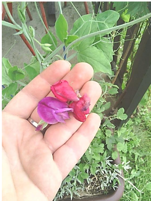
Slika 20. Crveni i ljubičasti cvjetovi