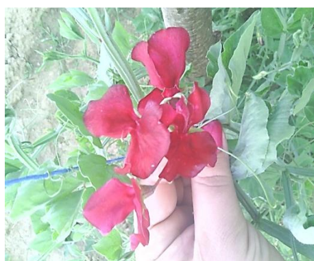
Slika 16. Crveni cvjetovi