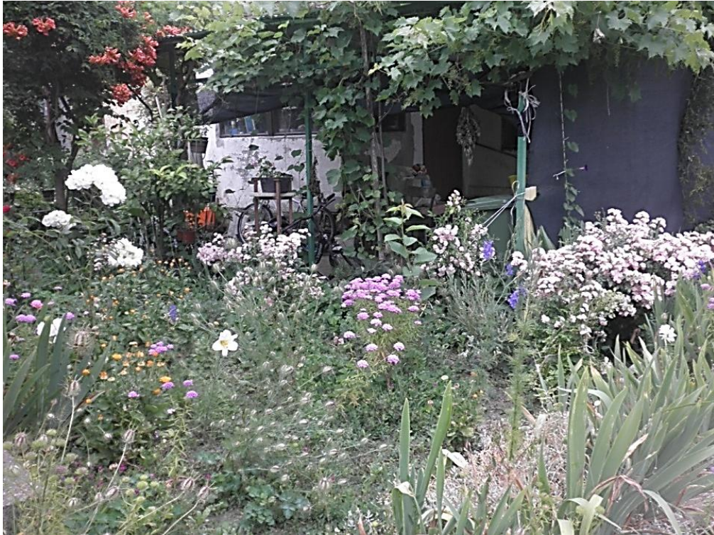
Slika 1. Tradicijski seoski vrt u Osijeku - Brijest