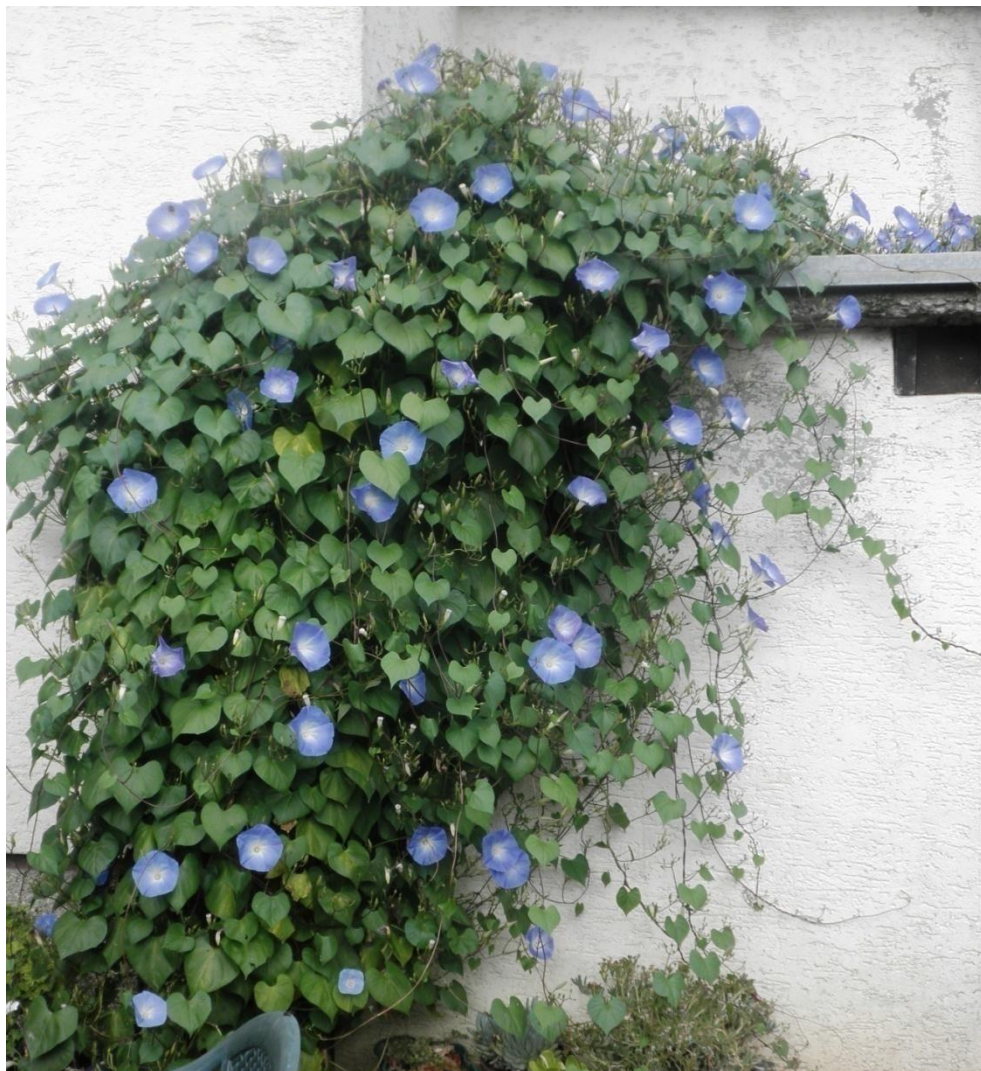
Slika 2. Ukrasni slak

Biljke penjačice mogu skriti mnoge nesavršenosti vrta, ublažiti stroge oblike i povećati osjećaj udobnosti, a uzgajaju se tamo gdje se želi zatvoriti neki otvor ili spriječiti nepoželjni pogledi. Jednogodišnje penjačice su prijeko potrebne za mladi vrt, koji bi bez njih često izgledao golo i pusto, jer trajnice trebaju puno više vremena da bi postigle puni rast. Jednogodišnje penjačice imaju duge izbojke i ne mogu samostalno rasti, već trebaju oslonac ili potporanj. Siju se u lončice ili izravno na otvorenome. U jednogodišnje penjačice ubrajaju se: mirisna grahorica ( Lathyrus odoratus ), dragoljub ( Tropaeolum majus ), ukrasni slak ( Ipomoea purpurea ), trobojni slak ( Convolvulus tricolor ), tunbergija ( Thunbergia alata ) ikobea ( Cobaeas candens ) (Auguštin,2003.).