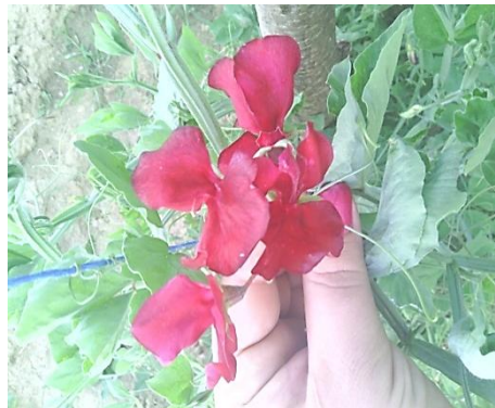
Slika 16. Crveni cvjetovi