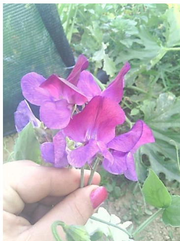
Slika 14. Svjetlo ljubičasti cvjetovi

Tijekom pokusa također je praćeno koje sve boje cvjetova će se javiti tijekom vegetacije na oba staništa. Praćenjem boja cvjetova tijekom vegetacije utvrđeno je sedam različitih boja, a najviše cvjetova bilo je tamno ljubičaste boje (vidi sljedeće slike).