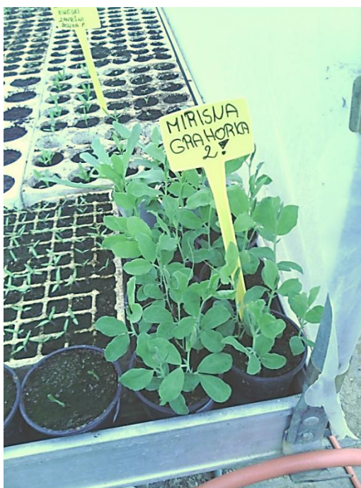
Slika 6. Ukrasna grahorica 14 dana nakon nicanja

Već četrnaest dana nakon nicanja, dakle 27 travnja, grahorica je već razvila četvrti list, a presadnice su ostale u plasteniku sve dok nije prošla opasnost od kasnih proljetnih mrazeva.