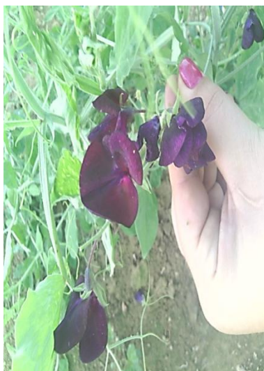
Slika 15. Tamno ljubičasti cvjetovi