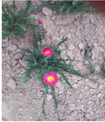
Slika 15. Ružičasti slamnati cvijet ( Helipterum roseum ) u vrijeme berbe