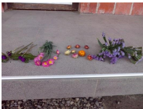
Slika 19. Ubrano cvijeće