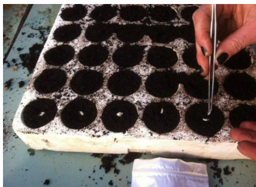
Slika 9. Sjetva sjemena