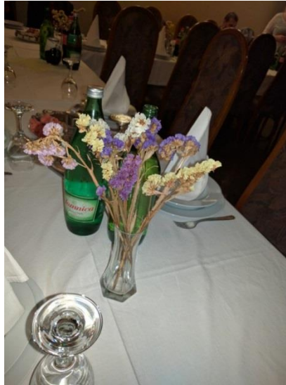
Slika 7. Statice ( Limonium sinuatum ) u vazi u restoranu Galerija na Vrbovcu