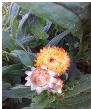
Slika 14. Slamnati cvijet ( Helichrysum bracteatum ) u pupu u vrijeme berbe

Helichrysum bracteatum - pravo vrijeme za berbu je kada su cvjetovi još u pupu. Kod te cvjetne vrste, pupovi se otvaraju tijekom sušenja i po završetku sušenja su vrlo dekorativni. Pupovi su brani bez stabljike iz razloga što se stabljika pri samom vrhu grana, a pupovi se ne razvijaju svi jednako. Ako se uberu nadomak otvaranju cvijeta ili u punom cvatu sredina cvijeta poprima smeđu boju.