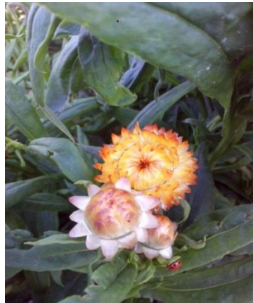
Slika 14. Slamnati cvijet ( Helichrysum bracteatum ) u pupu u vrijeme berbe

Helichrysum bracteatum - pravo vrijeme za berbu je kada su cvjetovi još u pupu. Kod te cvjetne vrste, pupovi se otvaraju tijekom sušenja i po završetku sušenja su vrlo dekorativni. Pupovi su brani bez stabljike iz razloga što se stabljika pri samom vrhu grana, a pupovi se ne razvijaju svi jednako. Ako se uberu nadomak otvaranju cvijeta ili u punom cvatu sredina cvijeta poprima smeđu boju.