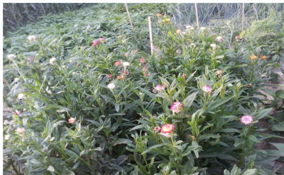
Slika 1. Slamnati cvijet ( Helichrysum bracteatum ) u cvatnji

Helichrysum bracteatum (slamnati cvijet) ubraja se u porodicu Asteraceae (porodica glavočika) (McDonald, 1995.) Potječe iz Australije. To je trajnica koja se uzgaja kao jednogodišnja cvjetna vrsta. Najčešće se uzgaja radi slamnatog cvata koji se može sušiti i koristiti za suhe cvjetne aranžmane (Auguštin, 2003.). Naraste od 30 do 100 centimetara u visinu (Karlović, 2005.), ovisno o uvjetima uzgoja. Biljke su visoke, razgranate i tvore grmiće. Listovi su duguljasti i ovalni. Cvjetovi su okrugli, pod opipom suhi već u cvatnji. Cvjetovi su raznih boja, crvene, narančaste, žute, ružičaste, kremaste, rozne, bijele. Cvatnja je dugotrajna i traje od lipnja do studenog. Osim za izradu suhih aranžmana, koristi se kao cvjetne vrsta za sadnju na gredice i kao rezano cvijeće (McDonald, 1995.).