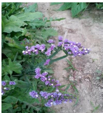
Slika 17. Statice ( Limonium sinuatum ) u vrijeme berbe