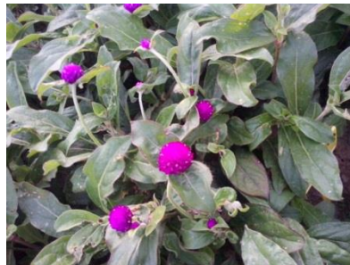
Slika 18. Netresak ( Gomphrena globosa ) u vrijeme berbe

Gomphrena globosa (netresak) podbirana je u dvije faze, kada je na stabljici formiran cvat u obliku loptice promjera 3 cm i u fazi kada se oblik loptice izduži i počinje poprimati smeđu boju. Brana je sa stabljikama, a najpovoljnije vrijeme berbe je kad je cvat manji i nema smeđih latica.