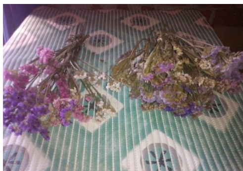
Slika 23. Primjer osušenih statica ( Limonium sinuatum ) u fazi rascvalog cvijeta (na slici lijevo) i u fazi rascvalog cvijeta koji su duže ostali na gredici (desno na slici)