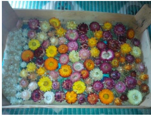
Slika 13. Sušenje u drvenoj kašeti