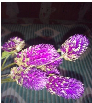
Slika 25. Osušeni cvat netreska ( Gomphrena globosa )