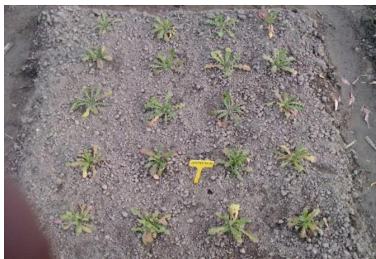
Slika 11. Presađene presadnice statica ( Limonium sinuatum )