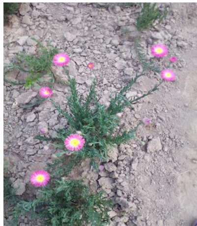
Slika 2. Ružičasti slamnati cvijet ( Helipterum roseum ) u cvatnji

Helipterum roseum (ružičasti slamnati cvijet) ubraja u porodicu Asteraceae (porodica glavočika) (McDonald, 1995.), porijeklom je iz Australije. Uzgaja se kao jednogodišnja cvjetna vrsta (Auguštin, 2003.). Raste uspravno i može narasti od 30 do 60 centimetara visine. Listovi su linearno-kopljasti plavkastozelene boje. Cvjetovi nalikuju tratinčici, pod opipom papirnato suhi, boje od bijele, nježno roze i jarko ljubičaste, mogu biti jednostavni ili dupli. Cvatnja traje od lipnja do rujna. Vrlo je dekorativna, a za lijepu cvatnju presudno je suho i toplo vrijeme, vlaga i kiša mu šteti. Može se koristiti i za gredice, te kao rezano cvijeće za vaze i bukete (McDonald, 1995.).