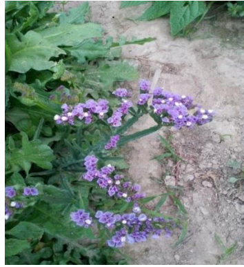
Slika 17. Statice ( Limonium sinuatum ) u vrijeme berbe