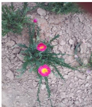
Slika 15. Ružičasti slamnati cvijet ( Helipterum roseum ) u vrijeme berbe