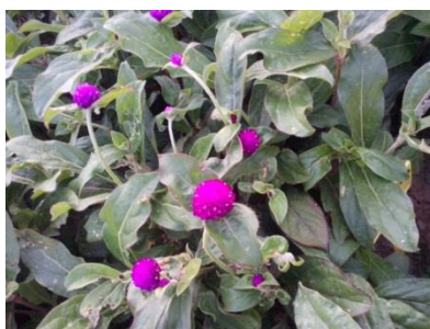
Slika 18. Netresak ( Gomphrena globosa ) u vrijeme berbe

Gomphrena globosa (netresak) podbirana je u dvije faze, kada je na stabljici formiran cvat u obliku loptice promjera 3 cm i u fazi kada se oblik loptice izduži i počinje poprimati smeđu boju. Brana je sa stabljikama, a najpovoljnije vrijeme berbe je kad je cvat manji i nema smeđih latica.