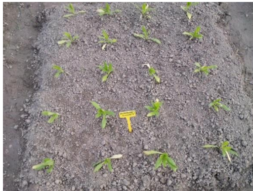
Slika 10. Presađene presadnice slamnatog cvijeta ( Helichrysum Bracteatum )

Presadivano je sa grudom supstrata u kojem je presadnica izrasla. Alatom za sadnju napravljene su rupice veličine grude supstrata u koje su stavljane presadnice i blago utisnute u tlo. Nakon sadnje gredice su ručno poravnate.