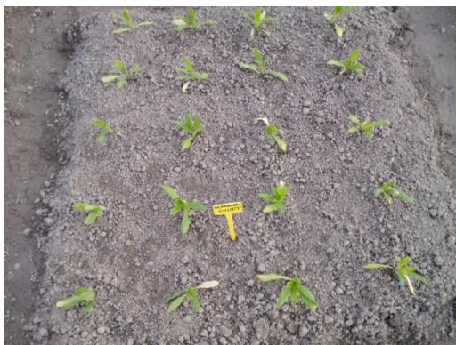
Slika 10. Presađene presadnice slamnatog cvijeta ( Helichrysum Bracteatum )

Presadivano je sa grudom supstrata u kojem je presadnica izrasla. Alatom za sadnju napravljene su rupice veličine grude supstrata u koje su stavljane presadnice i blago utisnute u tlo. Nakon sadnje gredice su ručno poravnate.