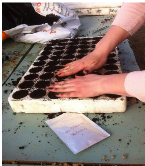
Slika 8. Punjenje kontejnera supstratom