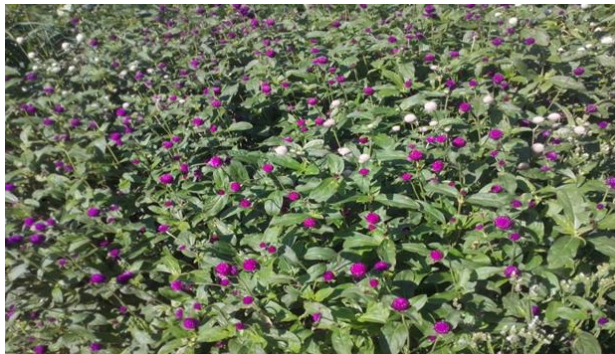
Slika 5. Netresak ( Gomphrena globosa ) u cvatnji

ljubičaste, žute, narančaste boje. Cvate od lipnja do jesenskog mraza (McDonald, 1995.). Koristi se za cvjetne aranžmane, bukete, vaze, vrlo je popularna kao vrsta za sadnju na gredice.