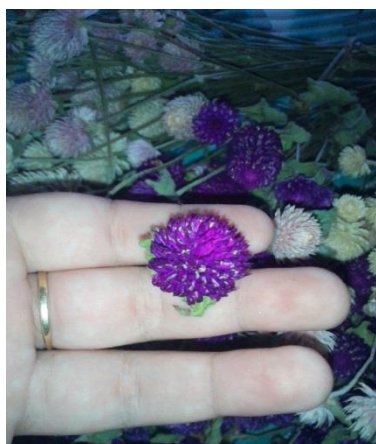
Slika 24. Osušeni cvat netreska ( Gomphrena globosa )

Najbolje vrijeme za branje u svrhu sušenja kod vrste Gomphrena globosa (netresak) je kada se formira cvat u obliku loptice (slika 24.). Ako se cvat izduži i poprimi duguljasti oblik i smeđu boju nakon sušenja gotovo cijeli posmeđi i nema tako jarku boju (slika 25.).