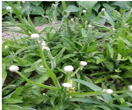
Slika 3. Suha bijela ruža ( Ammobium alatum )

Ammobium alatum (suha bijela ruža) je jednogodišnja biljka iz porodice Asteraceae (porodica glavočika), potječe iz Australije. Stabljike su uspravne, mesnate, krupne, plosnatog oblika i razgranate. Listovi su uski i dugački. Cvjetovi su bijeli i stini sa žutom sredinom. Koristi se u aranžmanima, buketama, vazama. (Auguštin, 2003.).