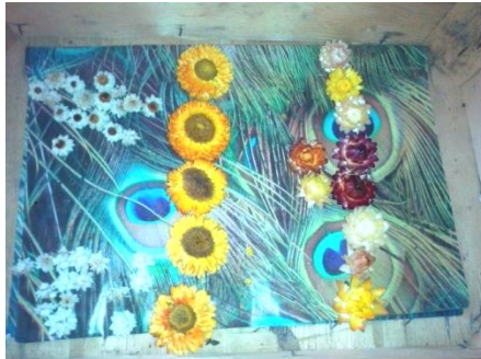
Slika 20. Primjer osušenog slamnatog cvijeta ( Helichrysum bracteatum ) i suhe bijele ruže ( Ammobium alatum )

Najbolje vrijeme berbe za sušenje većine ovih cvjetnih vrsta je kada su cvatovi u pupovima. Cvatovi Helichrysum bracteatum (slamnati cvijet) i Ammobium alatum (suha bijela ruža) u vrijeme berbe kada su otvoreni jezičasti i cjevasti cvjetovi poprimaju smeđu boju što znači da je najbolji rezultat postignut nakon sušenja ako su cvjetovi brani u pupu (slika 20.).