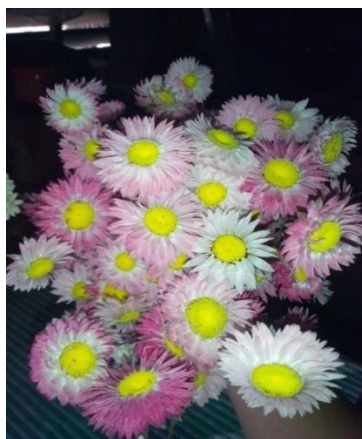
Slika 21. Primjer osušenog ružičastog slamnatog cvijeta ( Helipterum roseum )