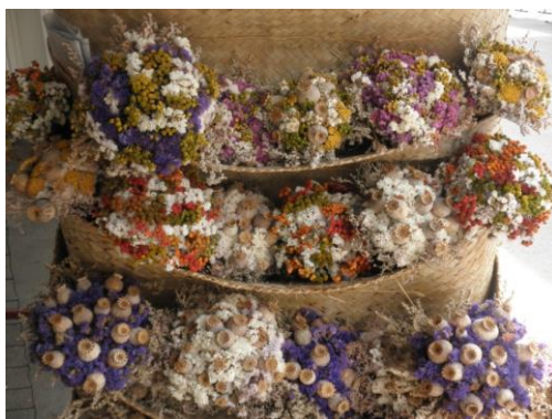
Slika 6. Buketići od suhog cvijeća

Najbolji oslonac za aranžiranje suhих aranžmana je suha cvjećarska spužva i glina, zbog svoje čvrstoće nema pomicanja cvjetova u aranžmanu (Kutanjec 1990.). Tehnika aranžiranja suhog cvijeća gotovo je ista kao i kod živog cvijeća, no bitna razlika je u tome da kod aranžmana od živog cvijeća cvjetove stavljamo posebno, a kod suhog uvijek u grupama, nikada po jedan cvijet. Osim aranžmana od suhog cvijeća popularni su i buketići.