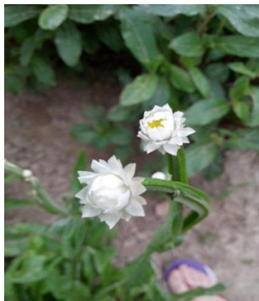
Slika 16. Suha bijela ruža ( Ammobium alatum ) u pupu u vrijeme berbe

Berba Ammobium alatum (suha bijela ruža) odvijala se isto u dvije faze. Otvaranjem jezičastih i cjevastih cvjetova i u fazi pupa. Pravo vrijeme berbe je bila kada su cvjetovi u fazi pupanja jer se pupovi tijekom sušenja otvaraju. Pupovi su brani bez stabljike iz razloga što se stabljike pri samom vrhu granaju, a pupovi se ne razvijaju ujednačeno. Ako se uberu u trenutku otvaranja cvijeta ili u punom cvatu sredina cvijeta poprima smeđu boju.