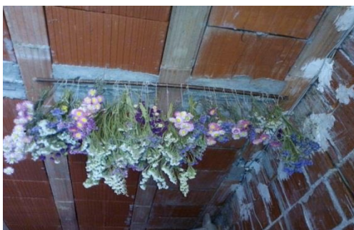
Slika 12. Sušenje na stropnoj gredi

Kod ostalih istraživanih vrsta; Helipterum roseum (ružičasti slamnati cvijet), Limonium sinuatum (statica) i Gomphrena globosa (netresak) sušenje je trajalo puno duže. Kod ružičastog slamnatog cvijeta i netresaka sušenje je trajalo tri tjedna, dok je kod statica sušenje je trajalo još duže čak do četiri tjedna iz razloga jer imaju deblje i mesnatije stabljike. Cvjetovi su brani sa stabljikom koja je prethodno očišćena od lišća radi lakšeg sušenja. Cvjetne vrste su sušene u svežnjevima u kojima je bilo desetak cvjetova. Svežnjevi su vezani sa čvršćim koncem i obješeni naglavce na posebno postavljenu stropnu gredu izbjegavajući kontakt sa svjetlošću koje može izbljediti cvjetove. Pritom je trebalo paziti da se svežnjevi ne objese preblizu jedan drugome jer je strujanje zraka otežano. Jedanput tjedno su se provjeravali svežnjevi, jer se tijekom sušenja vez sa stabljikama morao čvršće zavezati zbog smanjivanja volumena stabljike, kako ne bi došlo do ispadanja cvijeta iz svežnja te oštećivanja i loma.