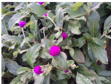
Slika 18. Netresak ( Gomphrena globosa ) u vrijeme berbe

Gomphrena globosa (netresak) podbirana je u dvije faze, kada je na stabljici formiran cvat u obliku loptice promjera 3 cm i u fazi kada se oblik loptice izduži i počinje poprimati smeđu boju. Brana je sa stabljikama, a najpovoljnije vrijeme berbe je kad je cvat manji i nema smeđih latica.