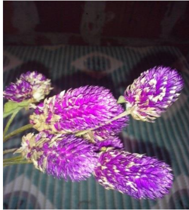
Slika 25. Osušeni cvat netreska ( Gomphrena globosa )