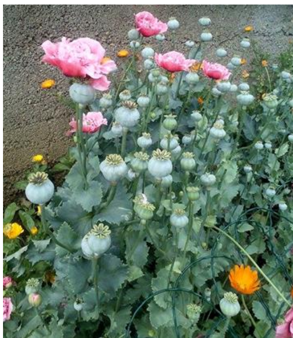
Slika 39. Vrtni mak ( Papaver somniferum )