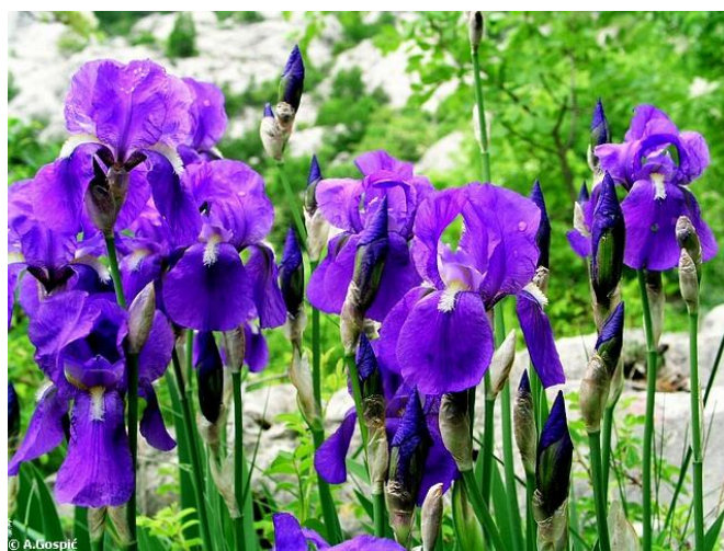
Slika 13. Perunika ( Iris sp. )

Perunika je jedna od omiljenijih trajnica iz porodice perunika ( Iridaceae ). Cvjetovi su bjele, plave, ružičaste pa do ljubičaste boje. Cvate u svibnju i lipnju. Porijeklom je iz Sredozemlja i jugozapadnih dijelova Azije. Nekada davno cijenila se zbog svojih ljekovitih svojstava. Razmnožava se u kolovozu iskopavanjem debelog podanka. Vrlo se često koristi u aranžiranju cvjetnih aranžmana (Komes, 1996.).