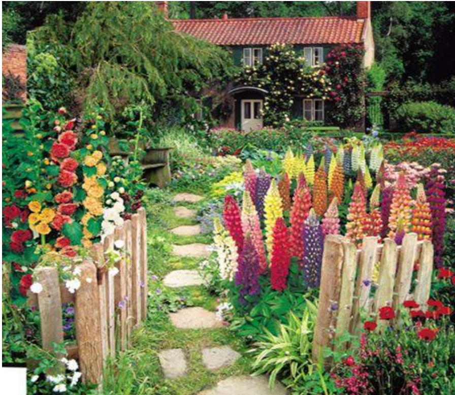
Slika 2. Tradicijski cvjetni vrt