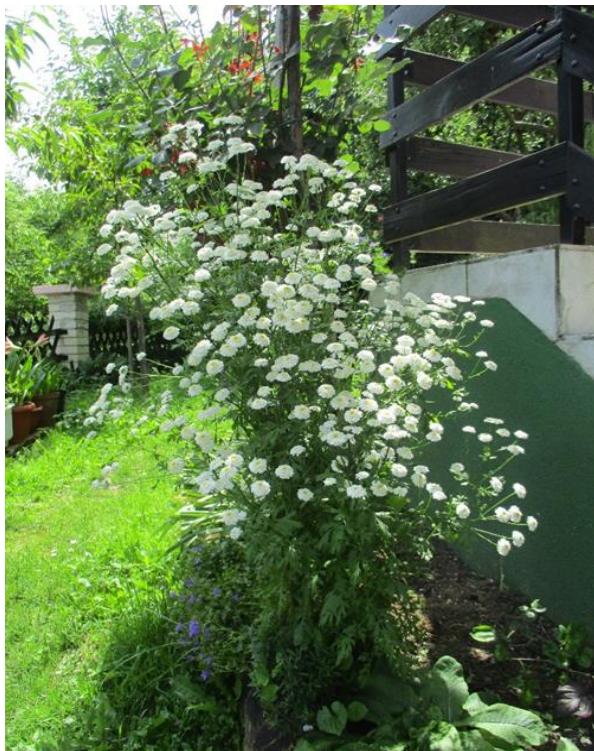
Slika 27. Bjeli vratić ( Tanacetum parthenium )

NAZIV BILJKE: marijin zvončić ( Campanula sp. ) VISINA: 110 cm BOJA CVIJETA: ljubičasta PODRIJETLO: Božica Šumiga, Lepoglava NARODNI NAZIV: zvonček