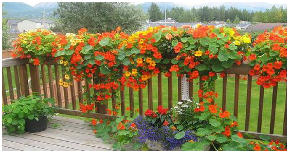
Slika 6. Dragoljub ( Tropaeolum majus )

travnja sve do svibnja. Zeleni cvjetni pupoljci prije cvatnje mogu se ukiseliti i jesti, dok se sitno nasjeckani listovi i cvjetovi koriste kao pikantan začin. (Komes, 1996.).