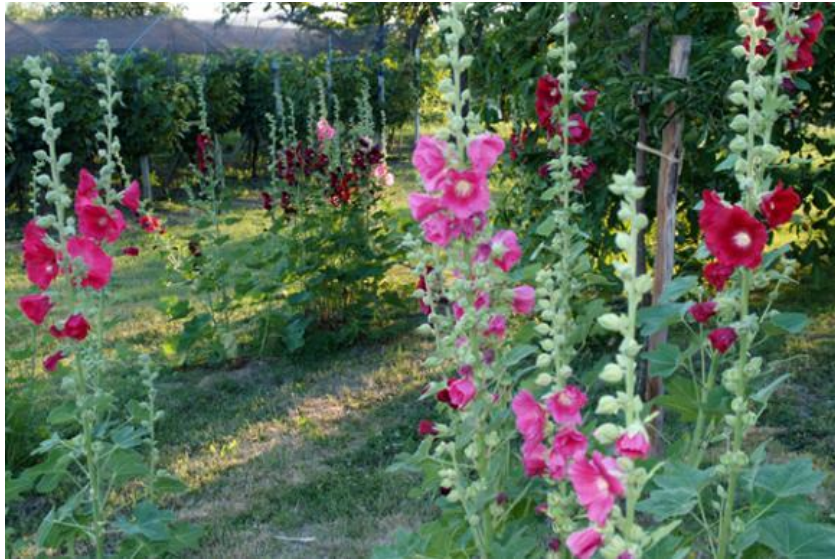
Slika 11. Pitomi sljez ( Alcea rosea )