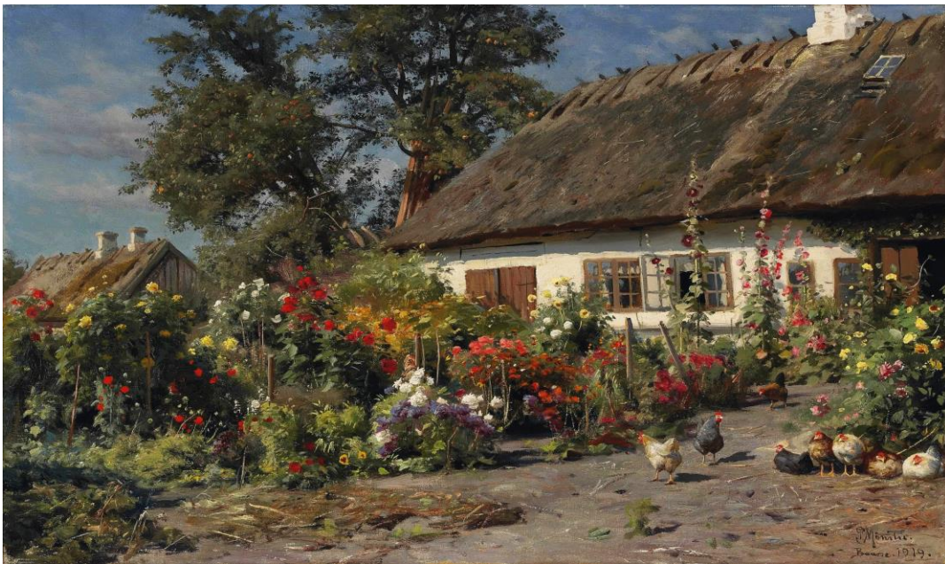
Slika 1. Ilustracija tradicionalnog starinskog vrta

( http://www.gardena.com/hr/garden-life/garden-magazine/nova-zudnja-za-zivotom-na-selu/ ). U prošlosti je u tradicionalnim vrtovima bilo raznog cvijeća, no bavljenje ukrasnim vrstama zbog njih samih, bila je povlastica bogatih obitelji. Siromašnijim ljudima vrt je uglavnom služio da prehrane obitelj. Kroz stoljeća seoski vrt postaje sve manje praktičniji, a sve se više pažnje obraća na samu dekorativnost vrta. Promjene životnog stila i depopulacija značajno utječu na mijenjanje i nestanak tradicionalnih vrtova.