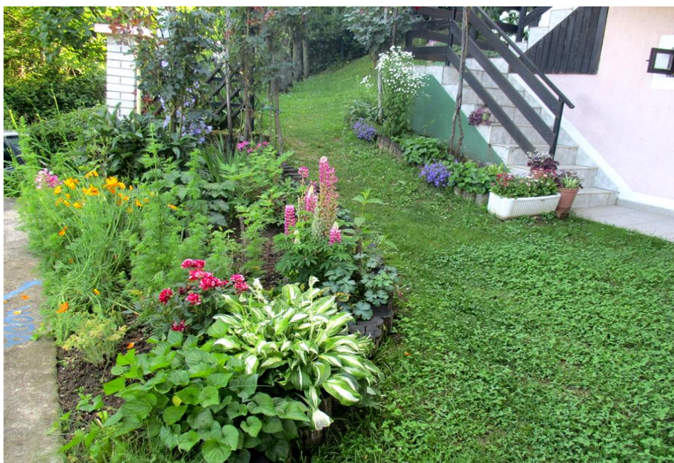
Slika 17. Vrt 1. Lepoglava