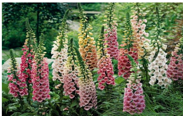
Slika 8. Naprstak ( Digitalis purpurea )

Naprstak ili crvena pustikara je dvogodišnja zeljasta biljka iz porodice trputaca ( Plantaginaceae ). Porijeklom je iz Europe. Autohtono raste na rubovima šuma i na planinskim pašnjacima, a česta je biljka u cvjetnjacima kao ukrasna biljka. Može narasti i do 200 cm. Cvatu od lipnja do rujna. Plod je kapsula koja sadrži mnogo sjemenki. U prvoj godini stvara se samo prizemna rozeta, druge godine naraste a stabljika s listovima. Dobra je medonosna biljka. Otrovnost je biljka, no u stručnoj medicini nalazi primjenu za liječenje srčane slabosti. ( http://www.plantea.com.hr/crveni-naprstak/ ).