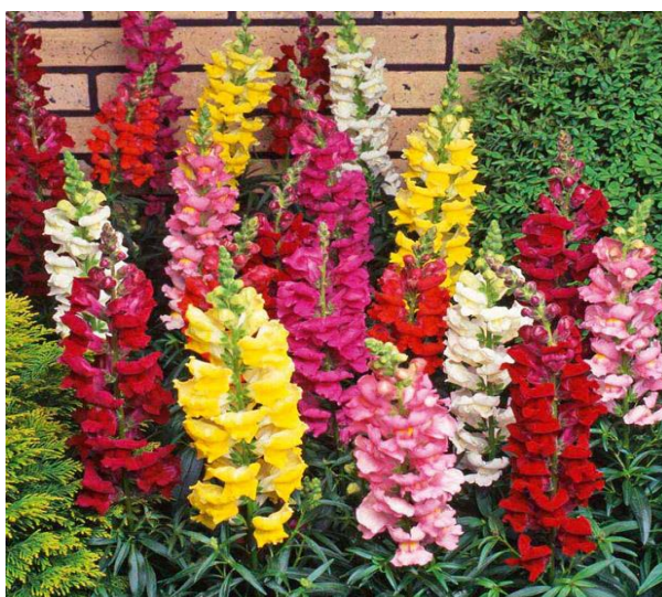
Slika 5. Zijevalica ( Antirrhinum majus )