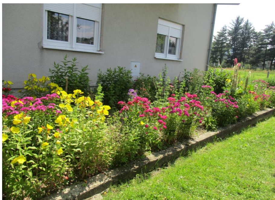
Slika 20. Vrt 3. ljeti