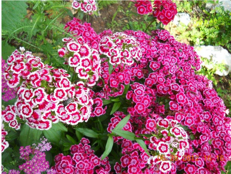
Slika 9. Turski karanfil ( Dianthus barbatus )