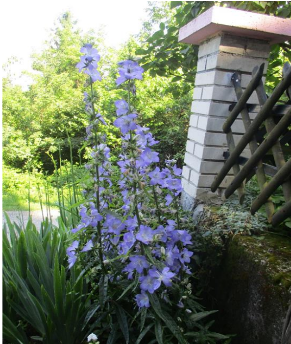
Slika 26. Marijin zvončić ( Campanula sp. )