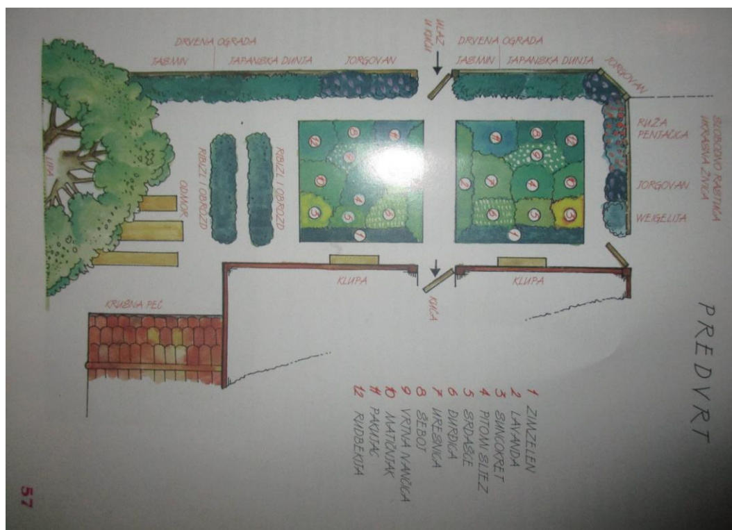
Slika 16. Planiranje cvjetnjaka