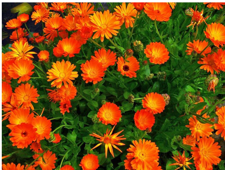
Slika 4. Neven ( Calendula officinalis )

ili u polusjeni. Visine je od 30-60 cm. Optimalan razmak sadnje je 30 cm. Najpoznatija nevenova primjena je u izradi kućnih pripravaka za njegu kože. U tu svrhu najpoznatiji je nevenov uljni macerat koji je naširoko poznat kao sredstvo koje se upotrebljava za razna oštećenja i upalne bolesti kože (Hessayon, 2001.).