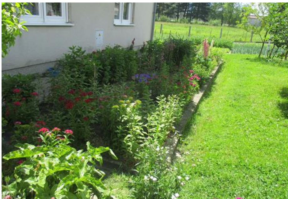
Slika 19. Vrt 3. u proljeće