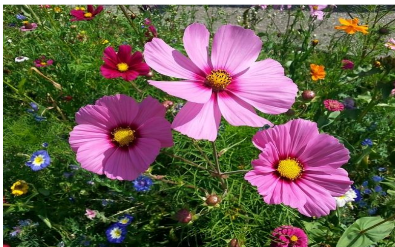
Slika 7. Uresnica ( Cosmos bipinnatus )

Evropu je stigla u 17. stoljeću iz Meksika i vrlo se brzo proširila po samostanskim, a zatim i po seoskim vrtovima. Cvate od svibnja pa sve do jeseni lijepim velikim cvjetovima, čija boja varira od bijele preko ružičaste do tamnocrvene. Visine je od 30-90 cm. Najprikladniji su sunčani i polusjenoviti položaji uz ograde tako da je biljku po potrebi moguće i privezati. Sije se u sandučiće u ožujku, a zatim se presađuje u vrt krajem travnja. Kao i mnoge druge vrste starinskog cvijeća, na povoljnom se položaju razmnožava sama sjemenom. Koriste se kao cvijeće za rez. (Komes, 1996.).