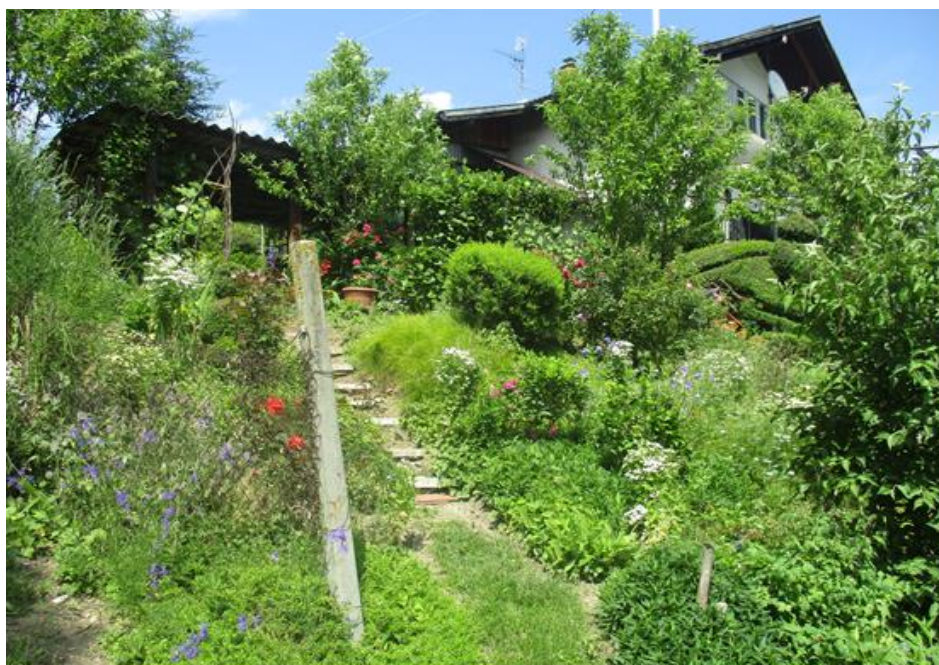
Slika 18. Vrt 2. Bednja

Nakon cvatnje turskog karanfila Dianthus barbatus ubrani su suhi cvjetovi u kojima se nalazi sjeme. Sjeme pakujca Aquilegia vulgaris nalazi se u tobolčićima koji su ubrani nakon cvatnje kada su bili u suhom stanju. Sjeme je pohranjeno u vrećice. Kod srebrenke Lunaria annua , nakon što su se osušile, ubrane su plosnate mahune sa sjemenom koje izgledaju kao kruškoliki kolut. Kod kadifica ( Tagetes sp. ), ubirani su najljepši suhi cvjetovi, označeni u cvatnji. Iz osušenih cvijetova čišćenjem pomoću pincete izdvojeno je sjeme. Nakon cvatnje crnjike ( Nigella damascena ) ubrani su suhi tobolci u kojima se nalazi sitno sjeme crne boje koje je pohranjeno u vrećice. Suhi tobolci kod maka ( Papaver somniferum ) zrenjem su pucali, te se sjeme osipavalo u posudu u kojoj su sušeni. Cvjetovi bijelog vratića ( Tanacetum parthenium ) ubrani su kada su bili u suhom stanju kao i cvjetovi nevena ( Calendula officinalis ).