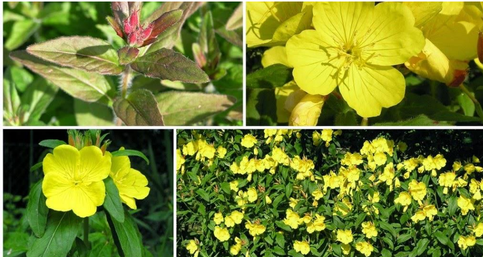
Slika 10. Pupoljka ( Oenothera grandiflora )