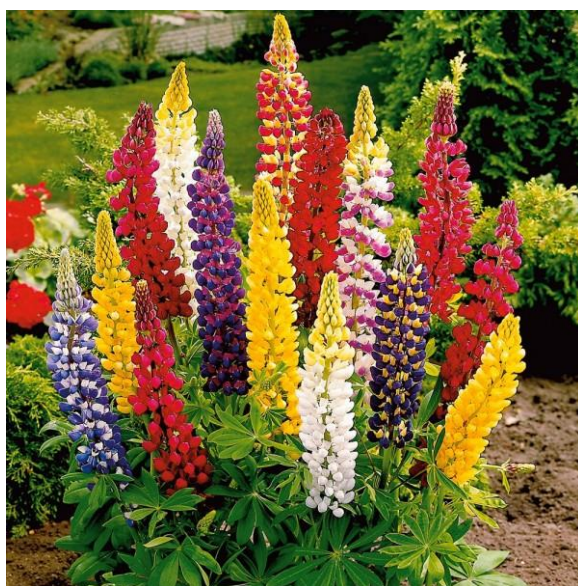
Slika 15. Ukrasna lupina ( Lupinus polyphyllus )

Lupinus je rod zeljastih trajnica iz porodice mahunarki ( Fabaceae ). Postoji stotinjak vrsta koje su većinom rasprostranjene u Sjevernoj i Južnoj Americi te na području oko Mediterana. Lupina je danas jedna od popularnijih trajnica, njezini cvjetovi su gusto poredani na ravnim cvjetnim klasovima u širokom rasponu boja. Obično rastu do 150 cm visine, iako postoji vrsta Lupinus jaimehintoniana koja u Meksiku raste kao stablo visoko 8 metara. Vrlo je dekorativna u doba cvatnje. Cvate u svibnju i lipnju. Korijenje je duboko te preko gljivica na kvržicama veže dušik u tlu, zbog čega je sadnja lupine popularna u vrtovima kao sredstvo zelene gnojidbe. Najčešće se uzgajaju vrste Lupinus polyphyllus , angustifolius , albus i luteus . ( http://www.plantea.com.hr/vucika/ ).