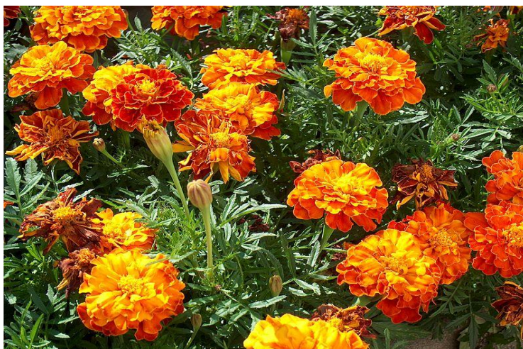
Slika 3. Kadiflica ( Tagetes sp. )