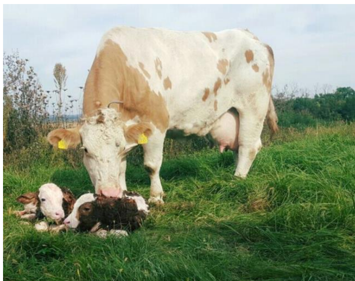
Slika 1. Simentalsko govedo na OPG Mužinić