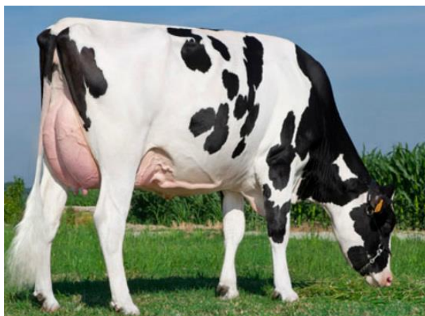
Slika 2. Holsteinsko govedo

Izvor: http://cattleinternationalseries.weebly.com/holstein.html (25.06.2017)