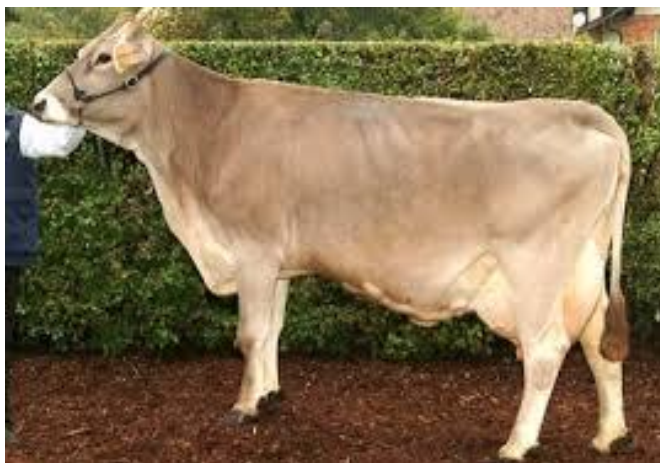
Slika 3. Smeđe govedo

Smeđe govedo (Slika 3.) je pasmina podrijetlom je iz Švicarske i Austrije. Goveda odlikuje čvrsta građa i otpornost. U Hrvatskoj ima jednako dugu tradiciju kao i simentalac. Pretežito se uzgaja u brdskim i planinskim krajevima, kod nas su goveda ove pasmine zastupljena na planinskim pašnjacima Gorskog Kotara, Dalmacije i Like. Na čitavom ovom području ima oko 22.000 smeđih krava što iznosi oko 5,8% ukupnog broja. To je kombinirana pasmina smeđe boje dlake, visine u grebenu 132 do 138 cm i tjelesne mase od 600 do 700 kg. Ova pasmina u prosjeku proizvodi od 3.500 do 4.000 litara mlijeka u laktaciji, no postoje proizvodne razlike između dva osnovna tipa ove pasmine. Tako prvi tip ili europsko smeđe alpsko govedo proizvodi od 5.000 do 6.000 litara mlijeka, dok američki mliječni tip brown swiss i preko 7.000 litara. U 2013. godini u Hrvatskoj se uzgajalo 4.603 krava s proizvodnjom od 5.631 kg mlijeka, mliječnom masti od 3,98% i postotkom proteina od 3,42%. U cilju dobivanja što kvalitetnijeg ženskog rasplodnog podmlatka koriste se bikova za umjetno osjemenjivanje iz drugih uzgoja kao što su Njemačka, Austrija, SAD, Italija.