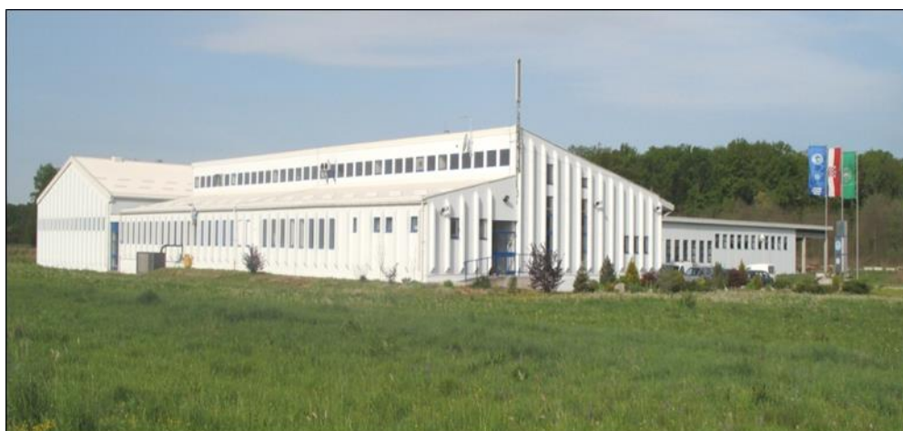
Slika 4. Središnji laboratorij za kontrolu mlijeka u Križevcima (SLKM)

Kontrola mlijeka u Hrvatskoj obavlja se u Središnjem laboratoriju za kontrolu kvalitete mlijeka (SLKM) u Križevcima (Slika 4.) koji djeluje pri Hrvatskoj poljoprivrednoj agenciji (HPA).