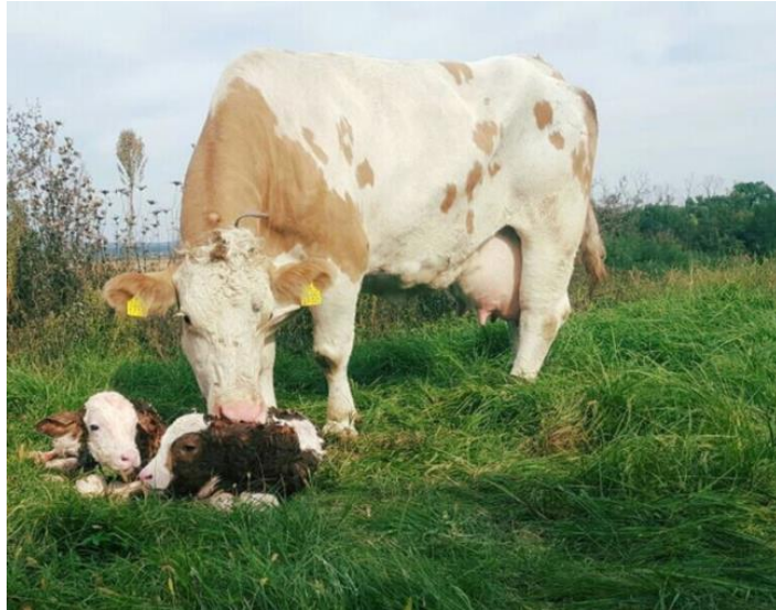
Slika 1. Simentalsko govedo na OPG Mužinić