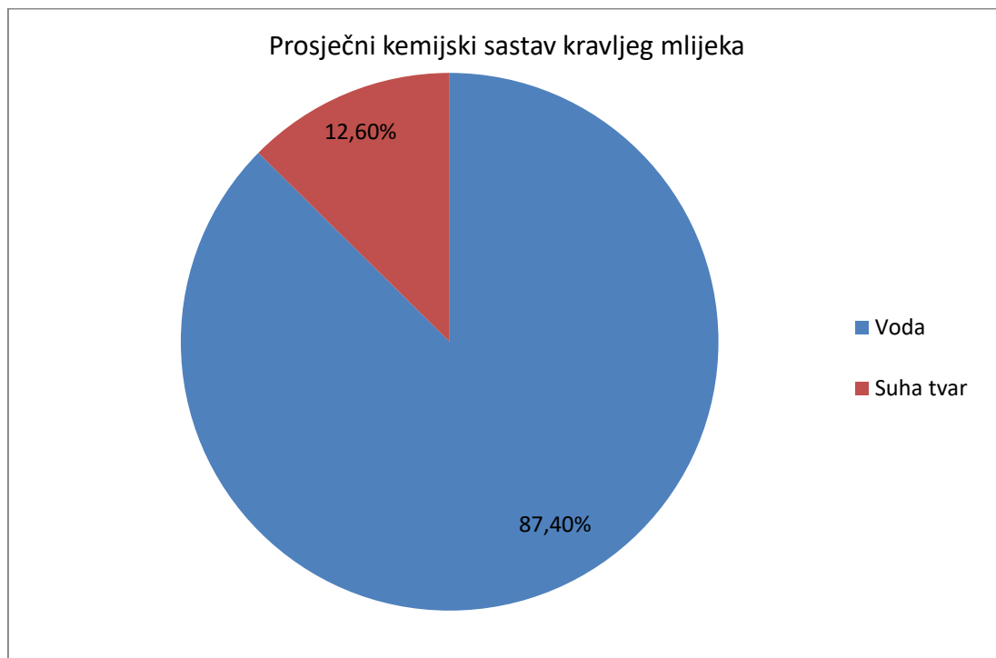
Graf 1. Prosječni kemijski sastav