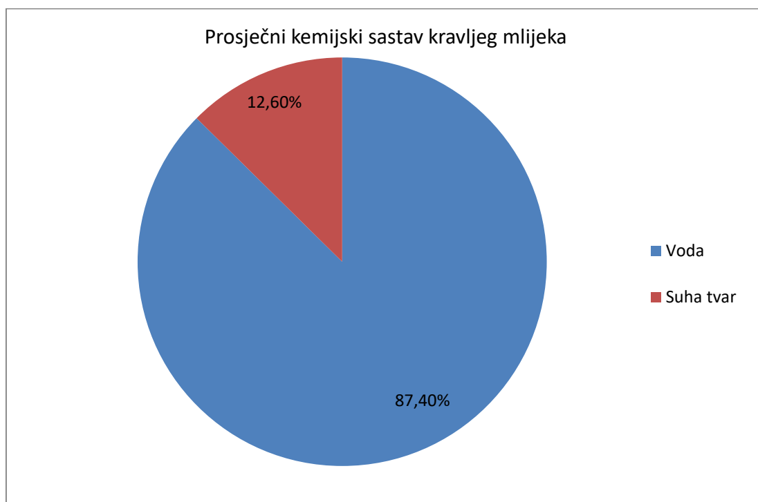
Graf 1. Prosječni kemijski sastav