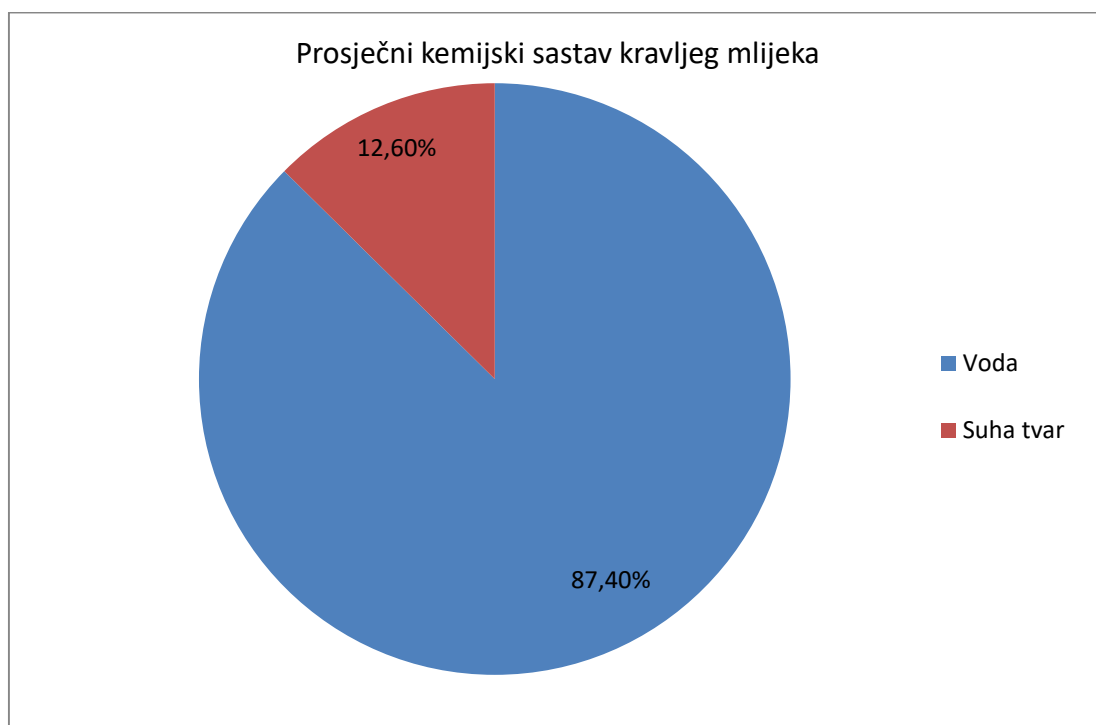
Graf 1. Prosječni kemijski sastav