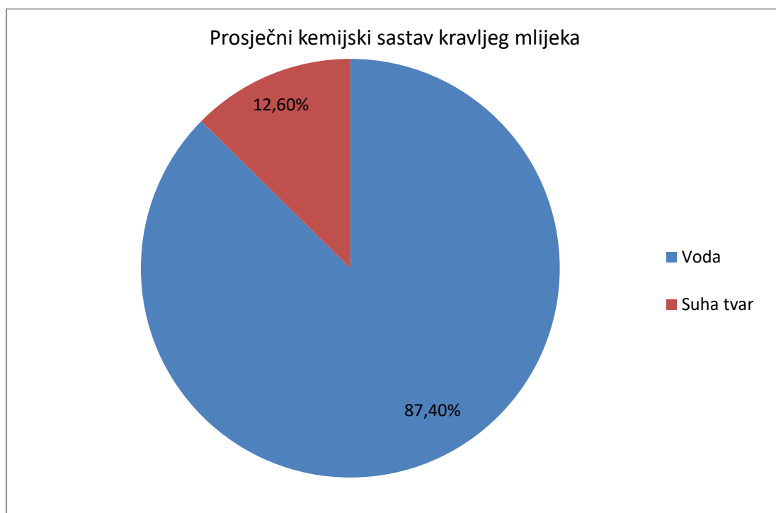
Graf 1. Prosječni kemijski sastav