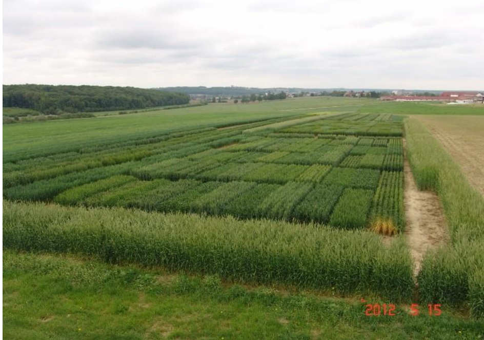
Slika 2: Konvencionalna proizvodnja na Visokom gospodarskom učilištu u Križevcima