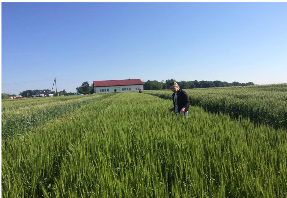
Slika 3: Pokusno polje konvencionalne proizvodnje na Visokom gospodarskom učilištu u Križevcima