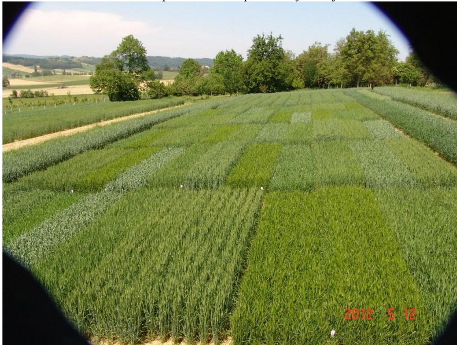
Slika 1: Mikropokus ekološke proizvodnje u Vojakovcu