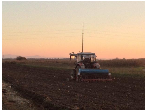
Slika 1. Sjetva ječma, 20.10.2015.

Nakon sjetve i nakon nicanja na 1\text{m}^2 bilo je izbrojano 8 redova. U 1 redu Bosuta bilo je 60 biljaka, što je ukupno 520\text{ b/m}^2 , a u 1 redu Jallona bilo je 35 biljaka što je ukupno 280\text{ b/m}^2 .