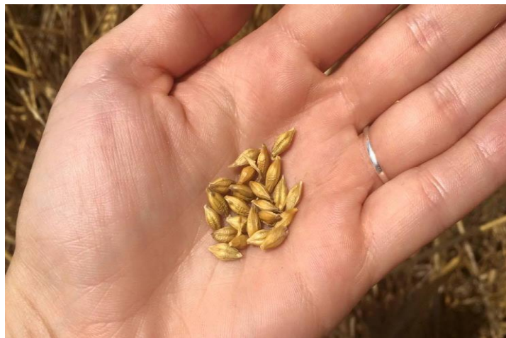
Slika 6. Zrno dvorednog ječma