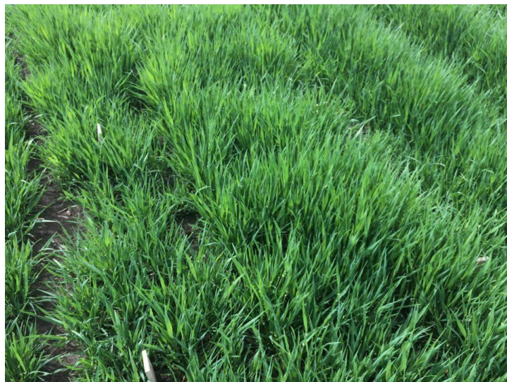
Slika 5. Ječam u fazi busanja, 05.12.2015.