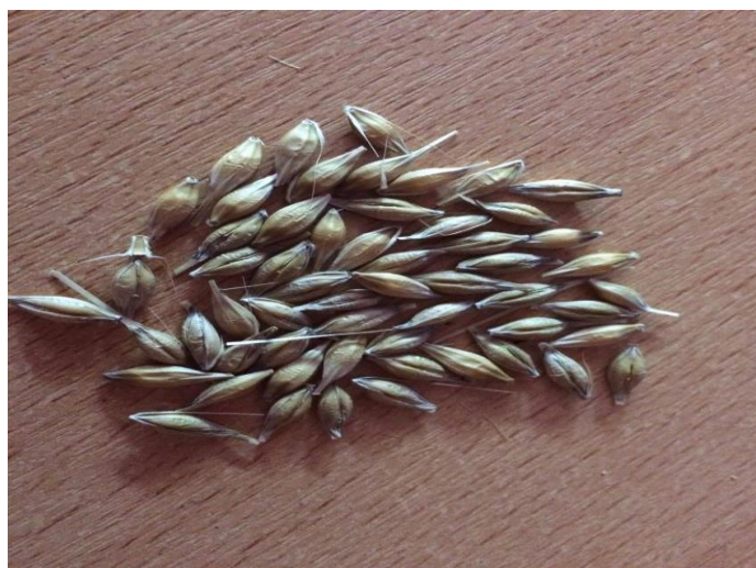
Slika 7. Zrno četverorednog ječma