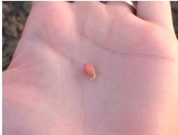
Slika 2. Klijanje ječma, 24.10.2015.

Izvor: vlastita fotografija, Barbara Fućec