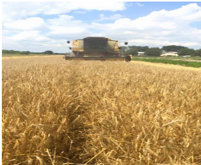
Slika 8 . Žetva ječma

Hektolitarska masa četverorednog ječma iznosila je 69,2 kg/hL, a dvorednog ječma 66,3 kg/hL. Na dan žetve najviša temperatura bila je 31,2°C. Vlaga četverorednog ječma bila je 11.12 %, a dvorednog ječma 12 % što je dobar postotak vlage za dobro čuvanje u silosu (Tablica 5.). Prinosi su s obzirom na prosječni urod u RH i mraz u cvatnji vrlo visoki za oba dva kultivara ječma.