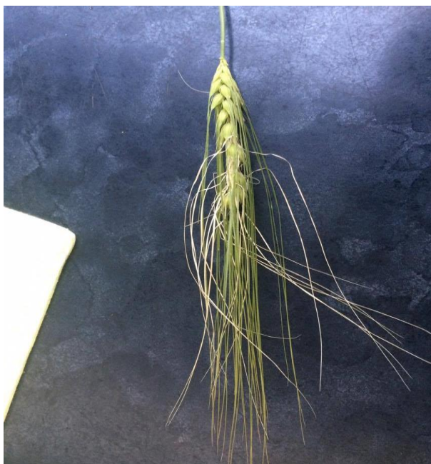
Slika 4. Oštećen klas od mraza, travanj 2016.