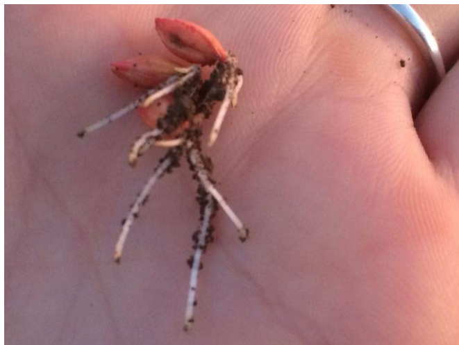
Slika 3. Korjenčić ječma, 29. 10. 2015.