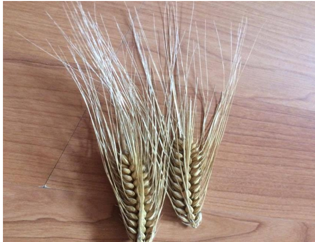
Slika 9. Klasovi čtetverorednog ječma