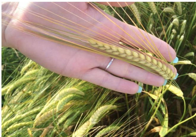
Slika 10. Klas dvorednog ječma