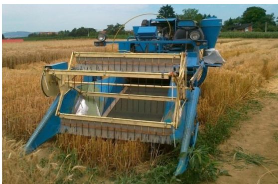
Slika 4. Žitni kombajn za žetvu mikropokusa

Žetva je obavljena 9. rujna 2013. godine, samohodnim žitnim kombajnom za mikropokuse marke Wintersteiger zahvata 1m. Prezrelo proso lako osipa zrno pa se u žetvu krenulo nešto ranije kako nebi došlo do osipanja zrna. Košnja je obavljena vrlo nisko zbog polijeganja pod velikim teretom metlice. Dobiveni prirod nakon kombajniranja zbog velikih primjesa zelene stabljike a time i velike vlažnosti zrna prosipali smo po podu i očistili od primjesa i ostavili da se suši tjedan dana. Nakon sušenja prirod smo izvagali, izmjerili masu 1000 zrna i hektolitarsku težinu.