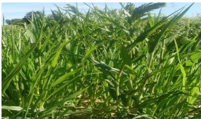
Slika 3. Zaostajanje u rastu zbog nastale depresije