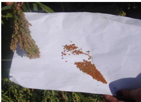
Slika 2. Brojanje zrna u metlici