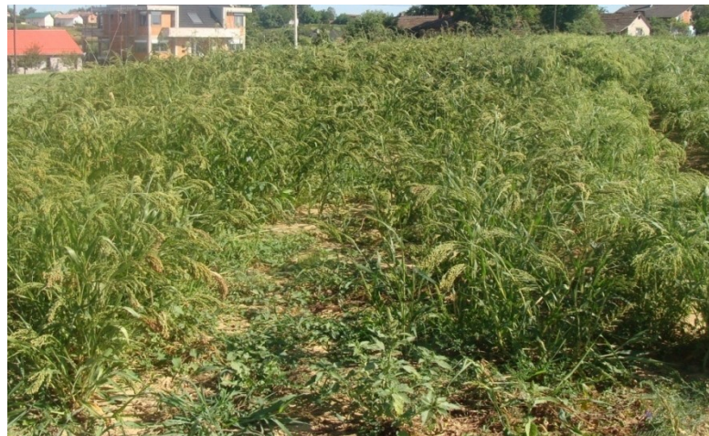
Slika 9. Pokusno polje prosa

... zrno je sitno pa je 1000 zrna teško 4 do 8 grama, a hektolitarska težina iznosi 70 do 75 kilograma. (M. Gagro 1997.). Dobiveni rezultati u usporedbi sa literaturnim su zadovoljavajući, kod žutog prosa hektolitarska težina čak je i veća od one literaturne što znači da je zrno visoke kvalitete.