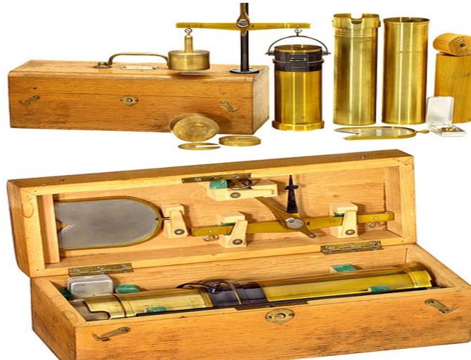
Slika 5. Schopperova vaga

Hektolitarska težina sjemena predstavlja masu volumena u 100 litara tj. jednog hektolitara sjemena i izražava se u kilogramima. Ona je ujedno i pokazatelj randmana brašna ili izbrašnjavanja a to znači koliko brašna dobijemo od sto litara zrna. Za svaki kilogram smanjenja hektolitarske težine smanjuje se količina brašna i povećava količina mekinja. Hektolitarsku težinu odredili smo pomoću Schopperove vage . Ispitni uzorak uzima se lopaticom i stavlja do oznake u cijev za nasipavanje. Mlaz sjemena mora padati u sredinu cilindra, a sjeme se ne smije poravnati s rubom cilindra. Pridržavajući mjerni cilindar nož brzo, ali bez potresa, treba izvući pri čemu klip, zajedno sa sjemenom iznad njega, naglo pada na dno cilindra. Tada se nož ponovno uvuče u prorez, sjeme iznad njega se potpuno ukloni, nož se izvuče, a sadržaj iz cilindra važe. Za dobivenu odnosno očitane masu zrna iz tablice se pročita vrijednost iskazana u kilogramima. Dobivena se vrijednost pomnoži sa 10 i dobiva se hektolitarska masa iskazana u kg/m 3 .