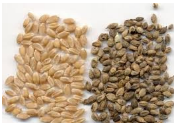
Slika 6. Primjer zaraze smrdljivom snijeti na pšenici

Proso je vrlo otporna biljka na bolesti i štetnike. Na pokusu nije bilo pojave bolesti i štetnika. Bolest koja se može pojaviti na prosu je smrdljiva snijet. Tipični znakovi mogu se uočiti tek pred žetvu. Zdrave metlice su povinute od težine zrna. Zaražene metlice su nakostrušene i strše uvis, jer su pljevice razmaknute radi snetljivih zrna. Snetljiva zrna su lakša, okruglasta, tamna te kraća i deblja u usporedbi sa zdravim zrnom. Vanjski dio zrna je očuvan, a unutrašnjost je ispunjena crnom, prašnom masom neugodna mirisa. U pravilu su sva zrna u metlici zaražena. Ako se zaražena metlica protrlja među dlanovima, vidi se crna prašina neugodna mirisa po ribi.