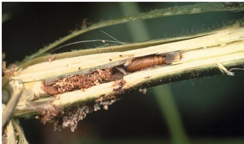
Slika 7. Štete od kukuruznog moljca

Suzbijanje: važna je mjera suzbijanja gusjenica koje prezimljuju u stabljici. Potrebno je mehanički uništiti ostatke kukuruzne stabljike, nakon berbe. Također treba uništiti i druge biljke domačine u kojima prezimljuju gusjenice (npr. paprika). Primjena insekticida mora biti pravovremena prije nego se gusjenice ubuše u stabljiku kukuruza.