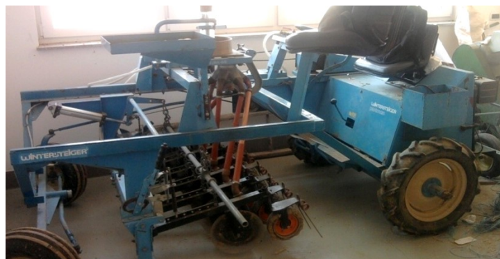
Slika 1. Samohodna Wintersteiger sijačica

Predkultura je bila pšenica. Pokus je postavljen u dvije parcele gdje je na 500 kvadrata bio crveni proso, a žuti na 200 kvadrata. Prethodne gnojidbe nije bilo. Norma sjetve bila je 30kg/ha. Količina sjemena ovisi o klijavosti, čistoći i masi 1000 sjemenki, gustoći sklopa, pripremi tla za sjetvu, cilju proizvodnje. Dubina sjetve bila je 3 cm. Treba voditi računa da proso ne posijemo preduboko, jer ima sitno sjeme s malom zalihom rezervnih hranjiva, sporije klija i niče, posebno pri nižim temperaturama.