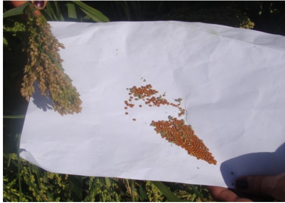
Slika 2. Brojanje zrna u metlici