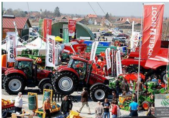
Slika 10. Međunarodni sajam u Gudovcu

Međunarodni pčelarski sajam, Izložba vina i vinogradske opreme u Gudovcu. Ove su priredbe postale veoma zapažene u zemlji i svijetu. Pokazale su potpunu svrhovitost održavanja na ovom mjestu, prostoru, vremenu i od davnina jakom i važnom stočarskom i poljoprivrednom kraju. Sajam ima prodajnu i izložbenu namjenu.