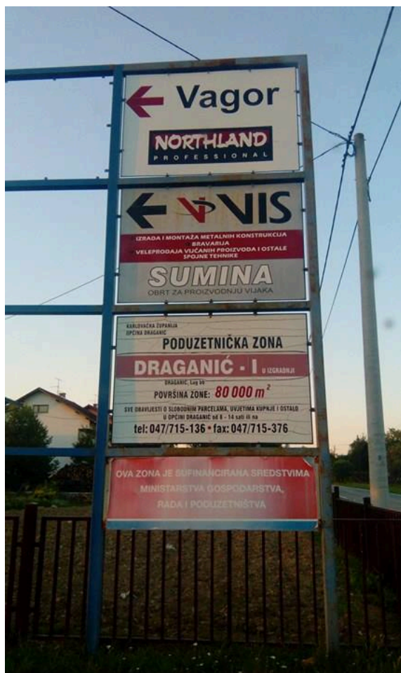
Slika 2. Poduzetničke zone

Zona je osnovana odlukom općinskog vijeća, ali nije potpuno definirana radi promjene trase pruge. Predviđena površina zone je cca 100.000 m 2 . Parcele su u privatnom vlasništvu, a po određivanju granice predviđa se otkup parcela ili sklapanje ugovora, te po obvezi iz PPU izrada Urbanističkog plana uređenja zone. 3