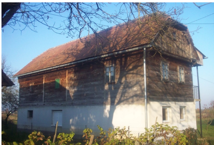
Slika 3. Čardak