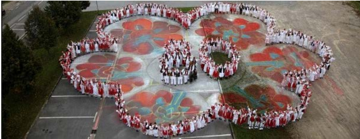
Slika 4. Proslava 80. godišnjice K.U.D. a Draganići