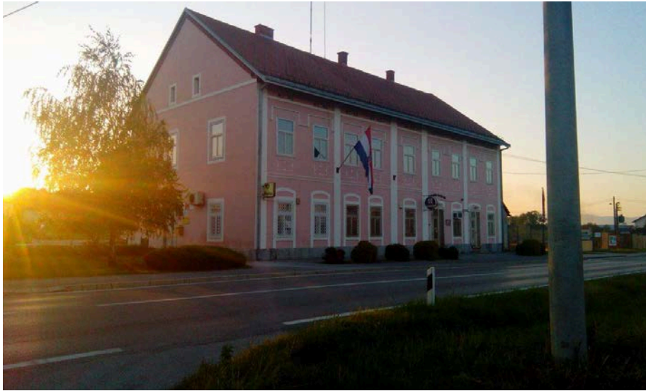
Slika 3. Općinska zgrada

Jedna od temeljnih funkcija jedinica lokalne i područne samouprave je zadovoljavanje javnih potreba u društvenim djelatnostima. Za izvršenje ove obveze u proračunima se osiguravaju potrebna financijska sredstva. Koje javne potrebe će biti financirane, utvrđuje se zakonom odnosno na zakonu utemeljenim aktima, a na županijskoj razini svake godine utvrđuje programima javnih potreba. Pored toga, određene obveze odnose se i na javne ustanove koje obavljaju javnu službu. Slijedi detaljniji prikaz navedenih institucija.