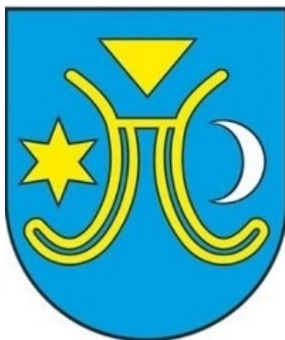
Slika 1. Grb Draganića

slova N.D. (Nobilijum Draganići), tj. Plemstvo Draganići. Prema tom pečatu izrađen je i prijedlog grba općine Draganić, a zastava općine je bila crvena s grbom u sredini ( http://www.draganic.hr/ )