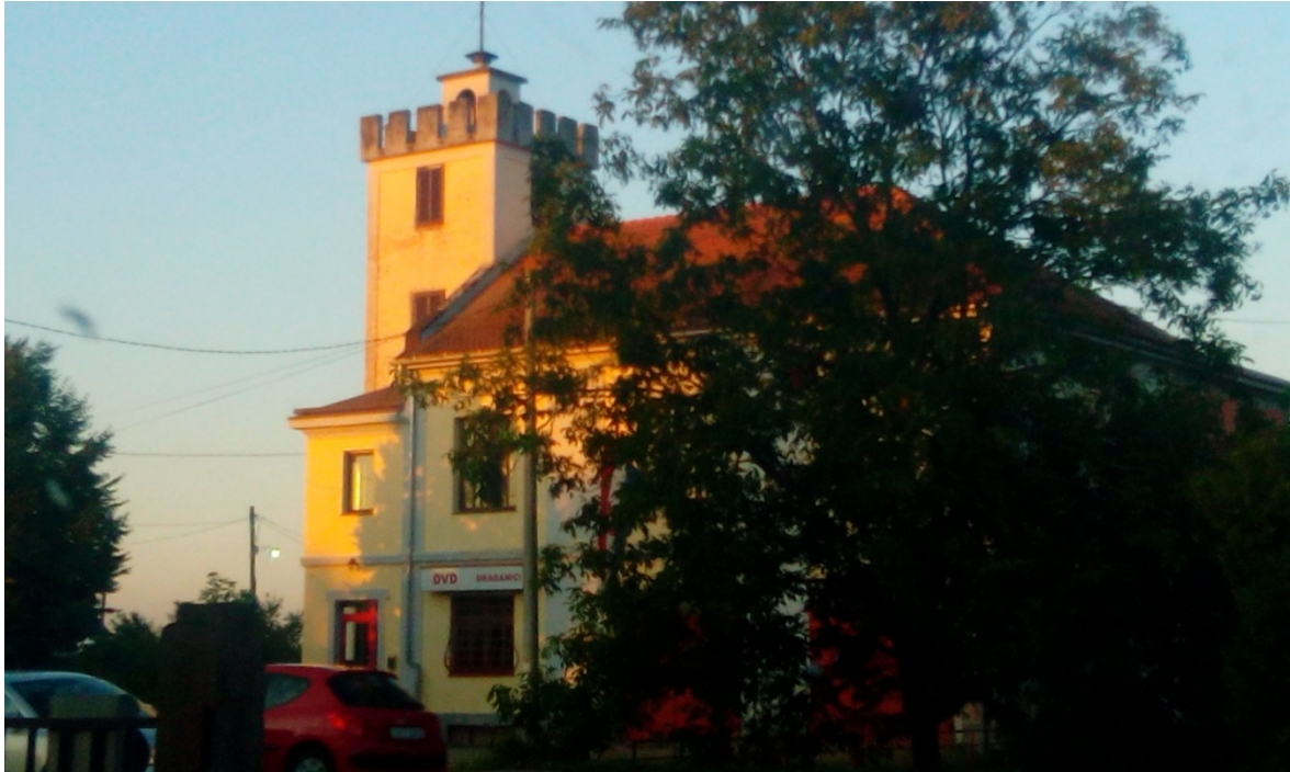
Slika 5. DVD Draganić