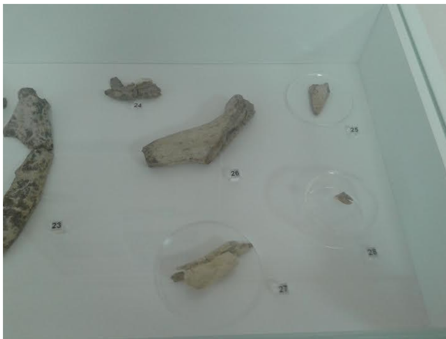
Slika 1. Ljudski zub (28) iz 13. stoljeća pronađen na nalazištu Buzadovec-Vojvodice

spremnici za hranu, na što nas upućuju rupice kroz koje su se provlačile niti za učvršćivanje i povezivanje oštećenih stijenki. U kuhinjskim loncima su pripravane kaše od različitih vrsta žitarica. Očuvani arheobotanički ostaci ukazuju na upotrebu prosa u 13. stoljeću te prosa, ječma, raži i pšenice u 15. stoljeću. Prikupljeni koštani nalazi većinom pripadaju ostacima domaćih životinja – govedu, svinji, a pronađene su i kosti konja, ovaca, koza te pasa. Evidentiran je i manji broj kostiju divljih životinja – jelena, lisice, zeca te ptica. Posebno se ističe nalaz ljudskog zuba pronađenog u arheološkoj cjelini datiranoj u 13. stoljeću (slika 1). Pojedini koštani ulomci prepoznati su kao uporabni predmeti i alatke. Na mnogima su vidljivi tragovi zasijecanja i rezanja pa i ukrašavanja, a također su u velikom broju prisutne nagrižene kosti kao pokazatelji prisutnosti pasa u ovom srednjovjekovnom naselju.