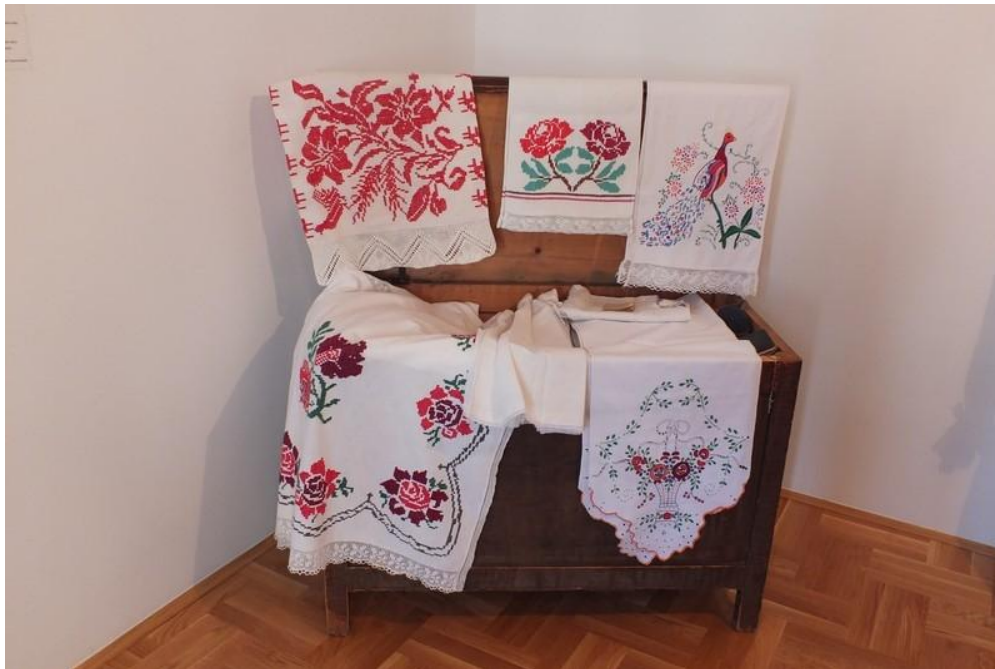
Slika 3. Škrinja s djevojčinim mirazom s početka 20. stoljeća