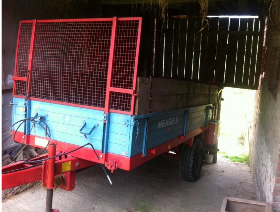
Slika 10. Prikolica za stajski gnoj, MENGELE

Gnojidba je obavljena u osnovnoj obradi obradi tla s 5 tona po hektaru stajskog gnoja. U predstjetvenoj pripremi stavljeno je još 250 kg/ha UREE i 350 kg/ha NPK 15:15:15. Za sjetvu je ukupno utrošeno 600 kg/ha mineralnog gnojiva.