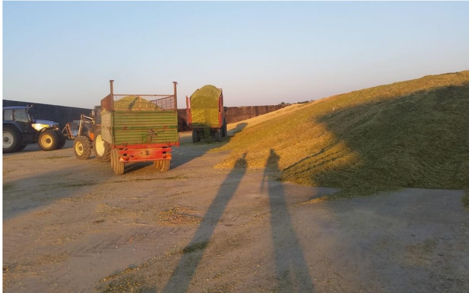
Slika 15: Dovoz zelene mase u silos