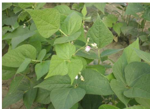
Slika 1. Biljka graha Phaseolus vulgaris

Cvjetovi graha su slabo vidljivi jer se nalaze u pazušcu listova na kraćoj stapci a mogu biti pojedinačni ili u parovima. Leptirasti su, a mogu biti bijeli, ružičasti, ljubičasti, crveni i dvobojni. Grah je samooplodna kultura, s malim postotkom stranooplodnje (Lešić i sur.,1993.).