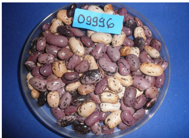
Slika 2. Sjeme graha Phaseolus vulgaris

Plod je mahuna koja u unutrašnjosti ima pergamentni sloj, pa u fiziološkoj zriobi lako puca, za razliku od graha mahunara koji ne puca u fiziološkoj zriobi jer nema pergamentnog sloja. Sjeme graha različitog je oblika (ovalno – okruglo, ovalno – spljošteno, valjkasto ili bubrežasto), boje (bijele, smeđe, šarano) i krupnoće (masa 1000 sjemenki vararia od 100 – 1000 g), (Lešić i sur. 1993.).