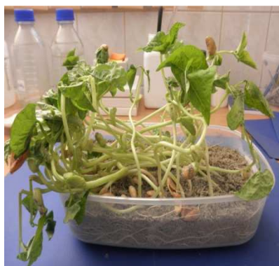
Slika 6. Prerastao uzorak graha