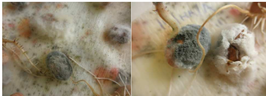
Slika 8., 9. Sjeme graha nakon inkubacije

Zdravstvena ispravnost sjemena ispitana je metodom na filter papiru u osam ponavljanja po 25 sjemenki. Inkubacija u trajanju od 10 dana provedena je na temperaturi od 20°C. Zaraza bolestima determinirana je pregledom sjemena pod stereomikroskopom, te pregledom micelija pod mikroskopom radi determinacije spora gljiva koje nisu dijagnosticirane na osnovu izgleda micelija. Determinacija je vršena prema Mathur i sur. (2003.). Kod sjemena graha i drugih kultura čije sjeme je bogato proteinima zaraza saprofitskim gljivama je u velikom postotku.