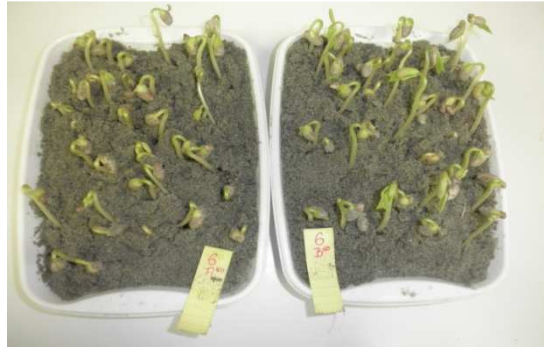
Slika 5. Uzorak graha nakon pet dana naklijavanja

komoru za naklijavanje na temperaturu 25°C, s tim da je svaka posuda stavljena u prozirnu najlon vrećicu da ne dođe do isušivanja podloge. Za tu svrhu korištene su velike vrećice jer klijanci rastu te ako uzorak preraste dolazi do truljenja kotiledona i prvih pravih listova zbog premalo prostora i prevlake vlage. Energija klijanja brojena je nakon pet dana, a klijavost nakon devet dana. Kod graha je jako važno držati se propisanih dana jer ako uzorak ima visoku energiju klijanja može prerasti te takav uzorak ne možemo brojiti, već ga ponovo postavljamo na analizu (slika 6.) .