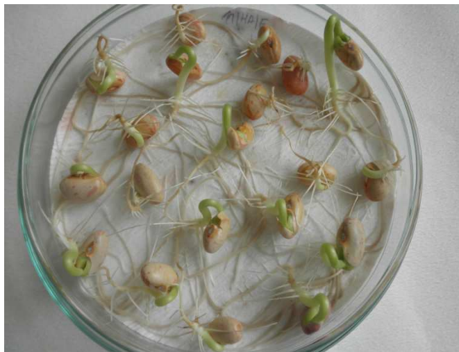
Slika 11. Uzorak broj 3 (OPG Gašparić) nakon inkubacije

Zaraza sa Fusarium spp. najveća je kod proizvođača kod kojih je i najniža klijavost sjemena.