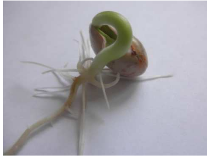
Slika 7. Nenormalni klijanac kod graha