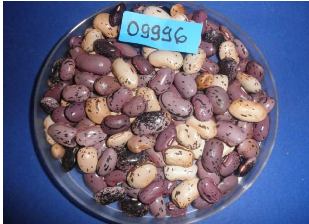
Slika 2. Sjeme graha Phaseolus vulgaris

Plod je mahuna koja u unutrašnjosti ima pergamentni sloj, pa u fiziološkoj zriobi lako puca, za razliku od graha mahunara koji ne puca u fiziološkoj zriobi jer nema pergamentnog sloja. Sjeme graha različitog je oblika (ovalno – okruglo, ovalno – spljošteno, valjkasto ili bubrežasto), boje (bijele, smeđe, šarano) i krupnoće (masa 1000 sjemenki varirava od 100 – 1000 g), (Lešić i sur. 1993.).