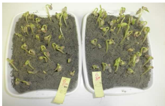
Slika 5. Uzorak graha nakon pet dana naklijavanja

komoru za naklijavanje na temperaturu 25°C, s tim da je svaka posuda stavljena u prozirnu najlon vrećicu da ne dođe do isušivanja podloge. Za tu svrhu korištene su velike vrećice jer klijanci rastu te ako uzorak preraste dolazi do truljenja kotiledona i prvih pravih listova zbog premalo prostora i prevlake vlage. Energija klijanja brojena je nakon pet dana, a klijavost nakon devet dana. Kod graha je jako važno držati se propisanih dana jer ako uzorak ima visoku energiju klijanja može prerasti te takav uzorak ne možemo brojiti, već ga ponovo postavljamo na analizu (slika 6.) .