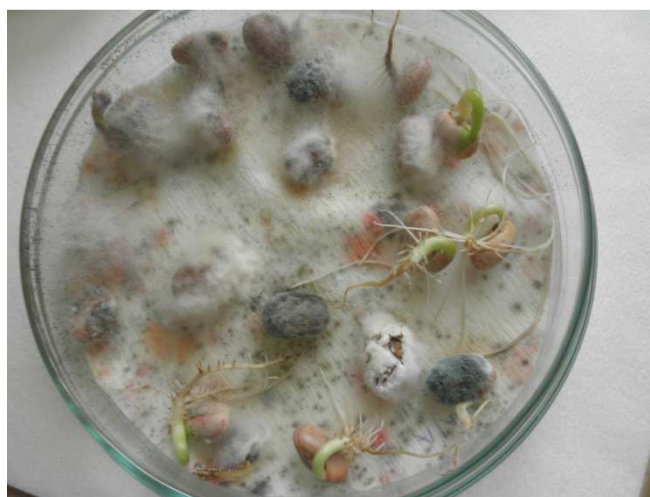
Slika 12. Uzorak broj 1 (OPG Balaško) nakon inkubacije