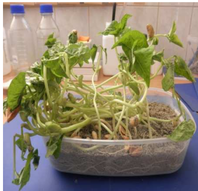
Slika 6. Prerastao uzorak graha