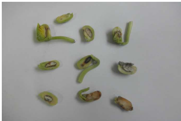
Slika 10. Nenormalni klijanci uzorka OPG Smontara

Prema Pravilniku o stavljanju na tržište sjemena povrća (NN 129/07,78/10,43/13) minimalna klijavost sjemena graha je 75%. Klijavost sjemena proizvođača OPG Balaško i OPG Smontara ne odgovara minimalnoj propisanoj klijavosti. Sjeme navedenih proizvođača imalo je povišen postotak vlage, no energija i klijavost sjemena ispitani su nakon dosušivanja sjemena. Uzrok niske klijavosti može biti i dosušivanje na visokoj temperaturi, ali i bolesti na sjemenu. Kod ocjenjivanja klijavosti graha obavezan je pregled kotiledona i prvih pravih listova. Ako su kotiledoni unutar sjemene ljuske, ljuska se miče i kotiledoni se otvaraju. Kod uzoraka koji nemaju minimalnu klijavost, prisutan je velik broj nenormalnih klijanaca, zaraženih bolestima.