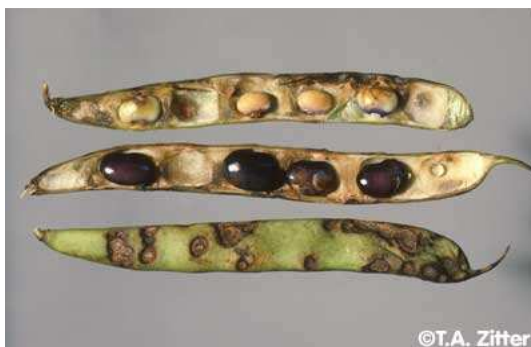
Slika 3. Zaraza sjemena i mahuna graha sa Colletorichum lindemuthianum

Simptomi se javljaju na svim nadzemnim dijelovima biljke, ali su najčešći na mahunama. Na mahunama se javljaju pjege smeđe boje koje su u početku izduljene, a kasnije kružne. Na sjemenu se javljaju žućkastosmeđe pjege, ali je te simptome lako zamijeniti sa simptomima bakterioza. Gljiva se prenosi sjemenom u obliku dormantnog micelija u sjemenom omotaču, ili u obliku spora između kotiledona. Spore se mogu naći i na drugim dijelovima sjemena, ako su locirane u embriju sjeme nema klijavost, a ako su u sjemenom omotaču sjeme klije ali je klijavost slabija (Jovićević i Milošević 1990.).