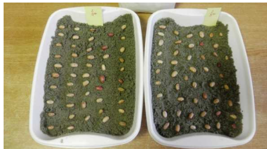
Slika 4. Grah na podlozi za naklijavnje

Klijavost sjemena je u postocima izražen odnos normalno razvijenih klijanaca prema ukupnom broju sjemenki stavljenih na klijanje. Klijavost je ispitana metodom u pijesku. U plastičnu posudu stavljen je sloj pijeska, na njega je poslagano 50 sjemenki koje su pokrite još jednim tanjim slojem pijeska, ispitivanje je provedeno u četiri ponavljanja po 50 sjemenki.