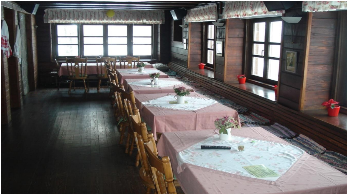
Slika 6: Unutrašnjost Planinarskog doma Kalnik