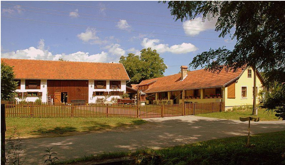
Slika 4: Sunčano selo