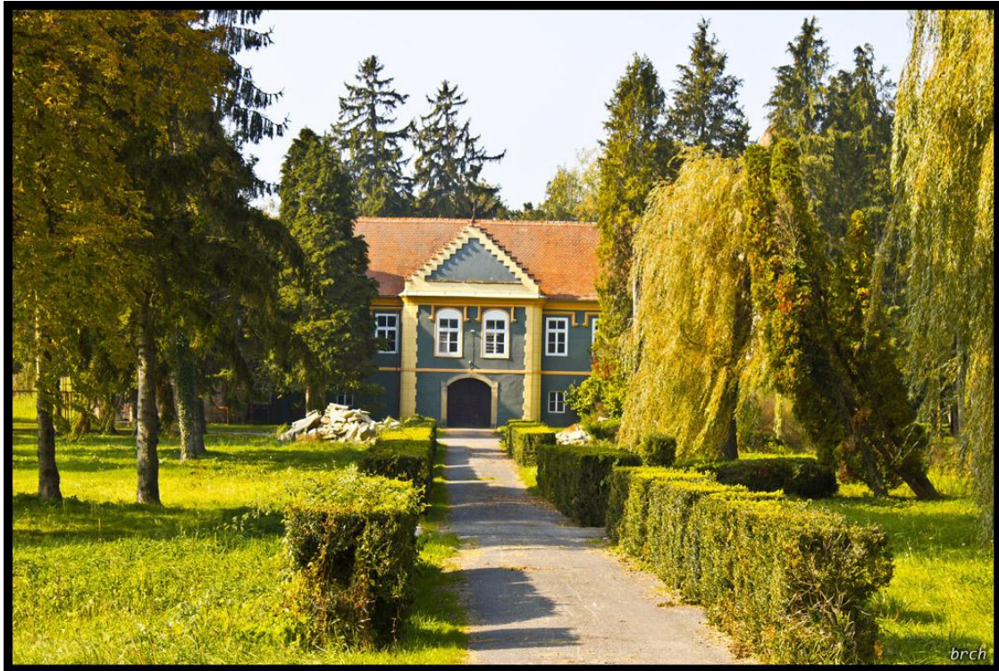
Slika 15: Dvorac Erdödy, Gornja Rijeka