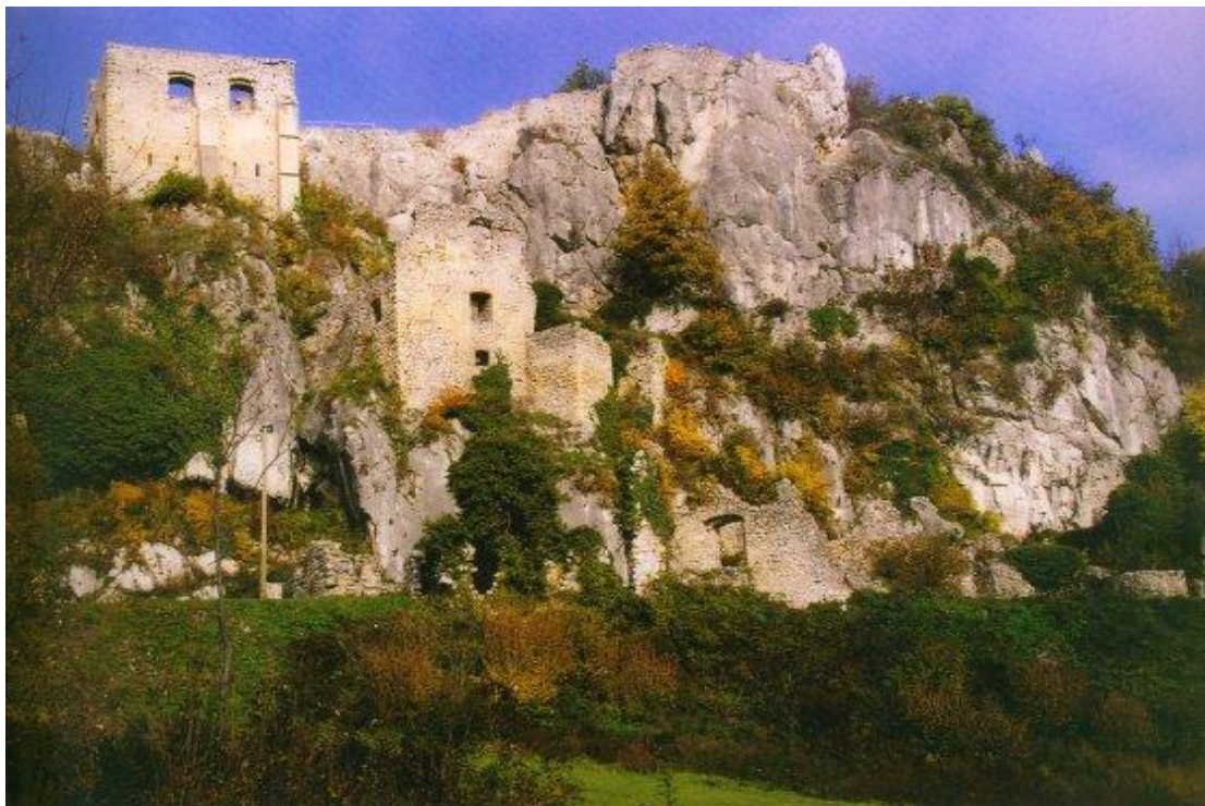
Slika 14: Utvrde Veliki Kalnik