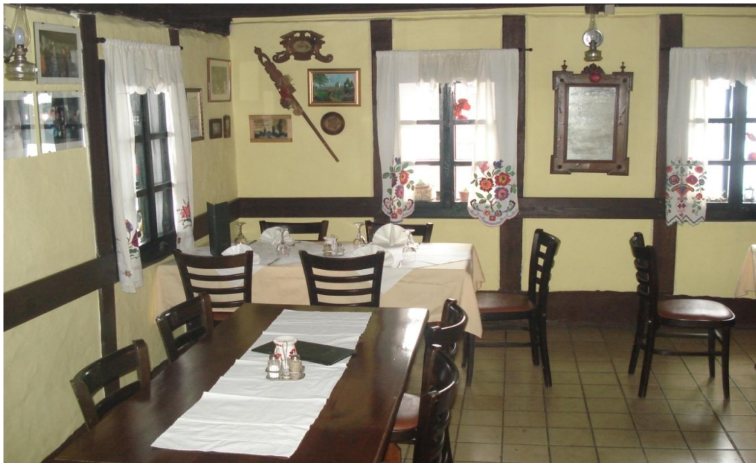
Slika 2: Gornjevinska klet, unutrašnjost

takvih objekata. Kod konačnog izračuna Indeksa uspješnosti provođenja mjera za razvoj ruralnog turizma u KKŽ (podpoglavlje 4.3.) koristit će se usporedivi podaci iz Nacionalnog kataloga ruralnog turizma .