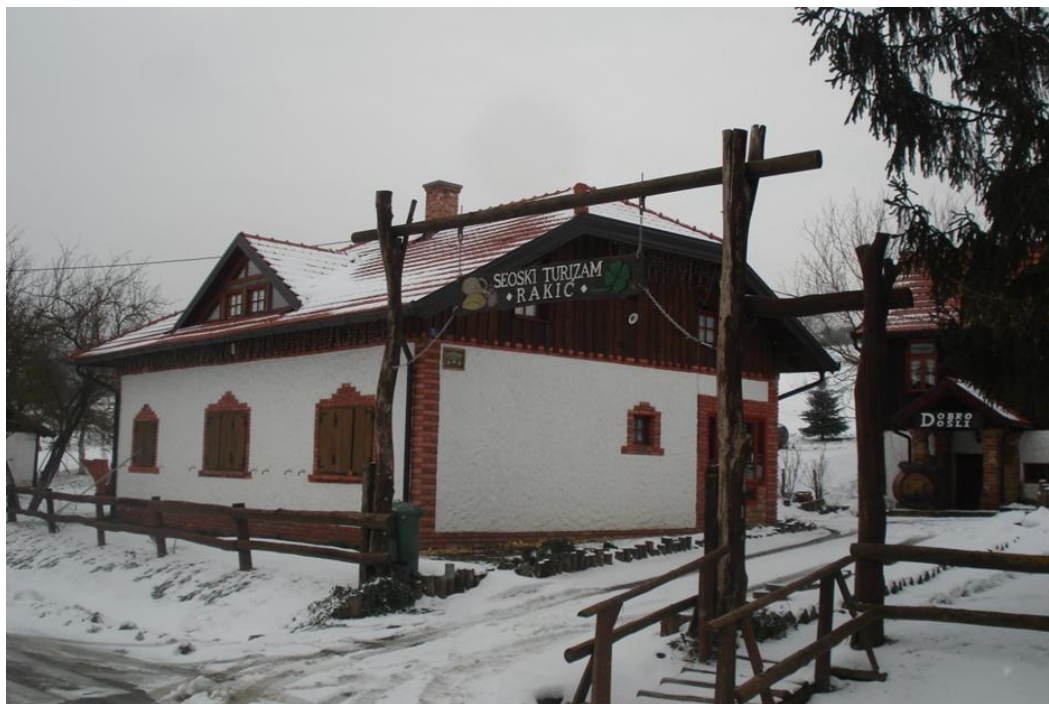
Slika 3: Seoski turizam Rakić