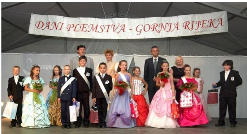
Slika 11: Dani plemstva u Gornjoj Rijeci