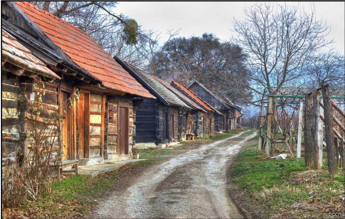
Slika 13: Kalnik, Obreške klijeti