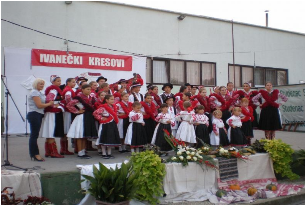
Slika 12: Ivanečki kresovi –detalj sa manifestacije