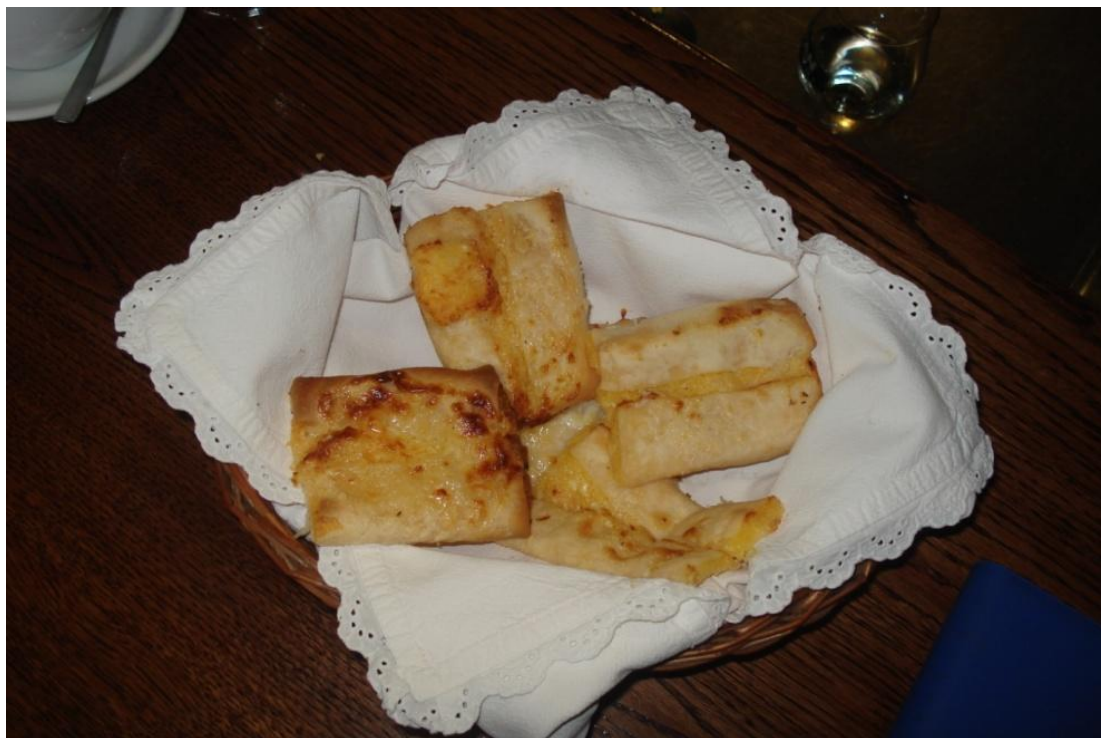
Slika 7: Ponakliči