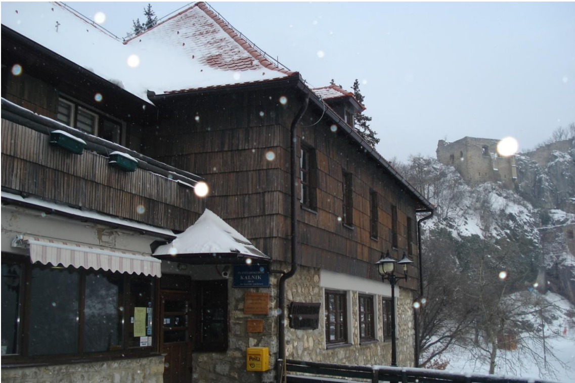
Slika 5: Planinarski dom Kalnik, u pozadini Stari grad Kalnik