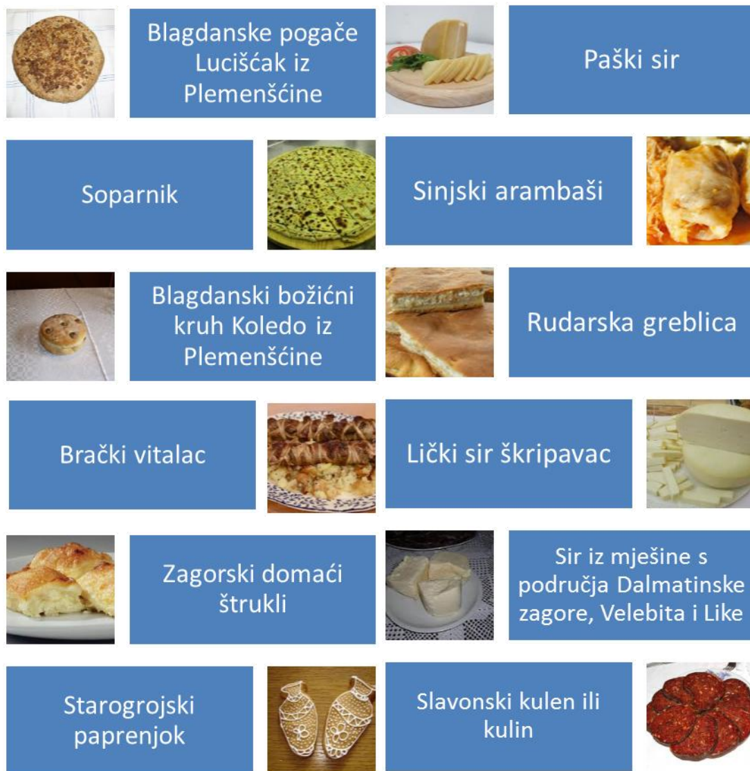
Slika 10. Hrvatska jela uvrštena u nematerijalnu kulturnu baštinu RH

sortama vinove loze zastupljenih po hrvatskim vinogradarskim regijama, odnosno javlja se nedostatak usporedivih podataka na nacionalnoj i županijskoj razini navedeni podaci neće se uzeti u obzir prilikom izračuna u podpoglavlju 4.3.