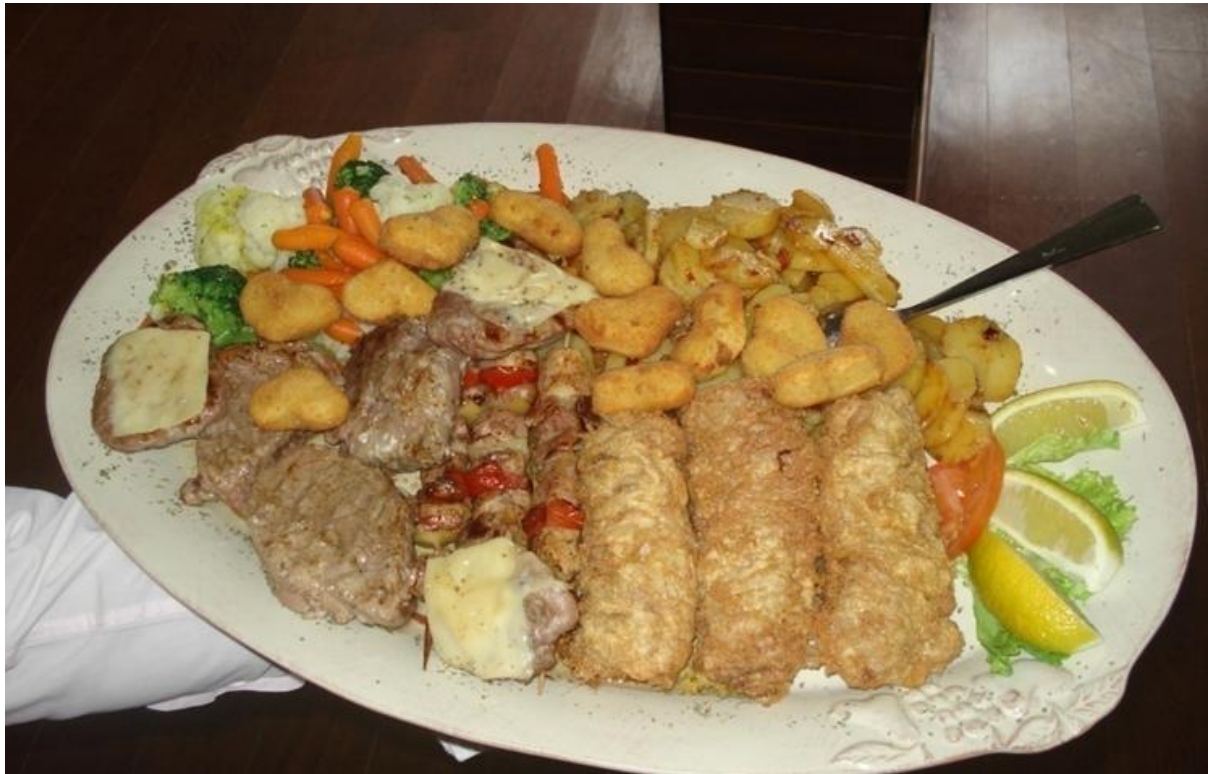
Slika 9. Pladanj Stari grad, Planinarski dom „Kalnik“