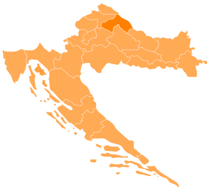
Slika 1. Položaj Koprivničko - križevačke županije na karti Republike Hrvatske

Također, na području KKŽ, provodi se i projekt " Europske mogućnosti za ruralne žene " čiji je cilj informirati žene iz ruralnih područja o mogućnostima koje donosi članstvo u Europskoj Uniji te osvijestiti njihov doprinos EU 12 .