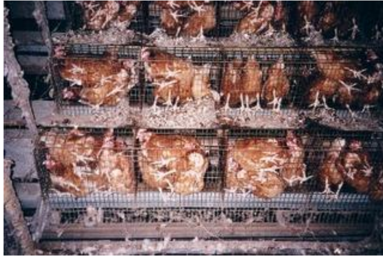
Slika 1. Držanje kokoši u starim kavezima,

Izvor: http://www.duh-vremena.blogger.index.hr/post/porijeklo-jaja/7788506.aspx