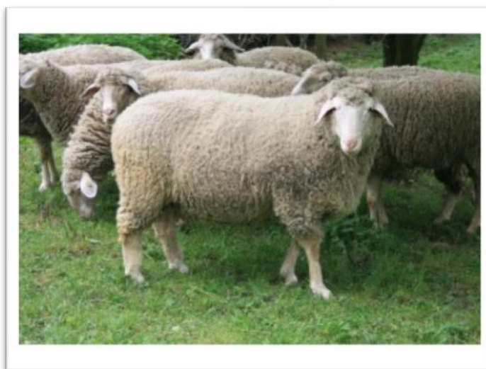
Slika 5. „Wurtemberg“