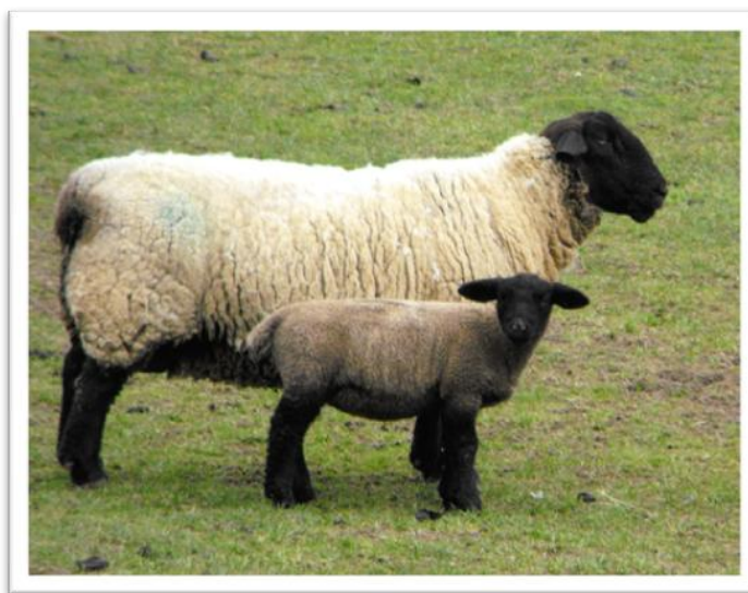
Slika 2. Ovca i janje Suffolk pasmine