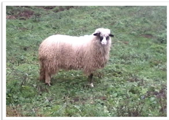
Slika 3. Travnička pramenka

Nastala, a i danas se najviše uzgaja na području Travnika (BiH), po čemu je i dobila ime, a prema navodima Mioča i sur. (2011). Travnička pramenka je kombinirana pasmina za proizvodnju mlijeka i mesa.