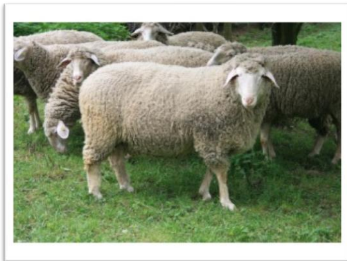
Slika 5. „Wurtemberg“