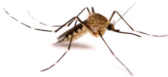
Slika 3. Komarac ( Culicidae )