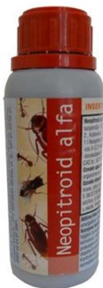
Slika 4. Sredstvo za dezinfekciju Neopitroid alfa