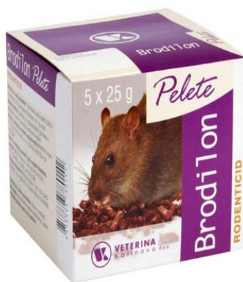
Slika 6. Brodilon mamac