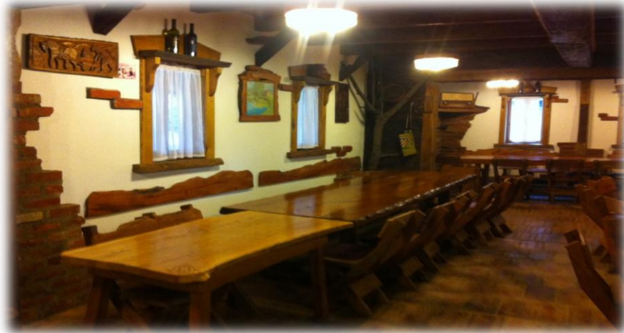
Slika 6. Interijer veće sale

Izletište Matezović također se može pohvaliti s vrlo rijetkim primjerom gastronomske ponude šarana s rašlji kojeg možete dobiti bilo koji dan u tjednu bez posebne najave i narudžbe.