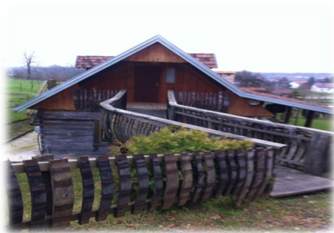
Slika 4. Smještaj na seoskom domaćinstvu Matezović

Na pitanje „Imate li usluge smještaja?“ vlasnik je odgovorio: „Da, za sada samo tri sobe. Planirao sam urediti još nekoliko soba i apartman, ali trenutno je preskupo.“