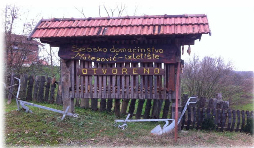
Slika 2. Seosko domaćinstvo Matezović

Seosko domaćinstvo Matezović (u daljnjem tekstu izletište) nalazi se u mjestu Gračec, na području grada Dugo Selo u istočnom dijelu općine Brckovljani, u prirodnoj idili podno crkve Sv. Brcka na terenu koji je u protekloj povijesti pripadao poznatoj plemićkoj obitelji grofa Draškovića.