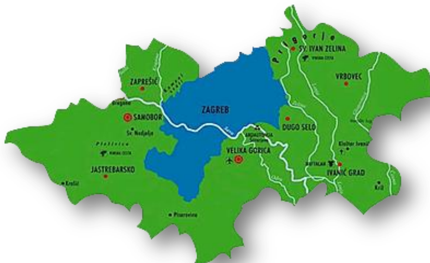
Slika 1. Karta Zagrebačke županije

Harmonija razvoja urbanog dijela županije uz zadržavanje agrikulturne tradicije unaprijeđene modernim tehnologijama i procesima čine ZZ poželjnim mjestom življenja prepunog mogućnosti i poslovnih prilika. Stoljećima unazad prostor ZZ spajao je i privlačio ljude. Na tom temelju počiva današnja raznolikost spomenika, običaja, tradicijskih vrijednosti i rijetkih znanja. Iz takve baštine crpe se ideje, pretaču u suvremene oblike na gubeći pri tome onaj duh koji svatko može osjetiti dolaskom u županiju 5 .