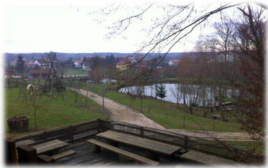
Slika 3. Eksterijer seoskog domaćinstva