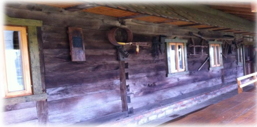
Slika 5. Etno zbirka

Ono što domaćinstvo čini posebnim je etno zbirka 11 . Sastoji se od raznih starih predmeta koje je vlasnik sakupljao po starim kućama i dvorištima. Zbirku čini razno posuđe, oruđe, alat, plugovi, glačala, tranzistor i slično. Zbirka nije službeno registrirana, ali u objektima i izvan njih ima puno predmeta koji se mogu vidjeti. Vlasnik čak planira jednu manju drvenu kućicu urediti i otvoriti suvenirnicu.