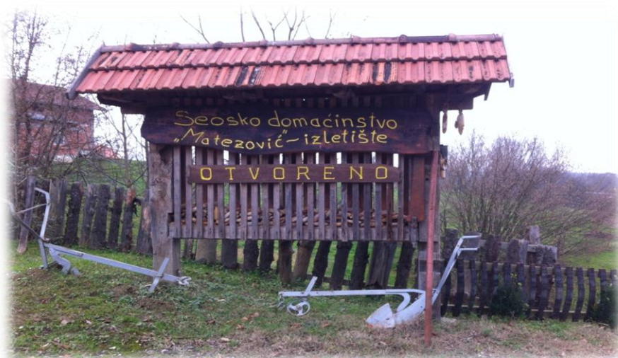
Slika 2. Seosko domaćinstvo Matezović

Seosko domaćinstvo Matezović (u daljnjem tekstu izletište) nalazi se u mjestu Gračec, na području grada Dugo Selo u istočnom dijelu općine Brckovljani, u prirodnoj idili podno crkve Sv. Brcka na terenu koji je u protekloj povijesti pripadao poznatoj plemićkoj obitelji grofa Draškovića.