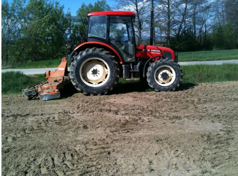
Slika 2. Traktor Zetor 7341 Super turbo

Kao što je već prije navedeno, na gospodarstvu su trenutno 3 traktora, koja služe svrsi i obavljaju sve poslove na farmi i u poljima. OPG u skoroj budućnosti planira nabavku 4 traktora zbog širenja obujma poslova i potrebe za većim i modernijim strojevima.