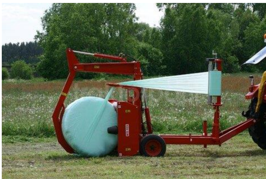
Slika 9 Omotač bala Metal Fach