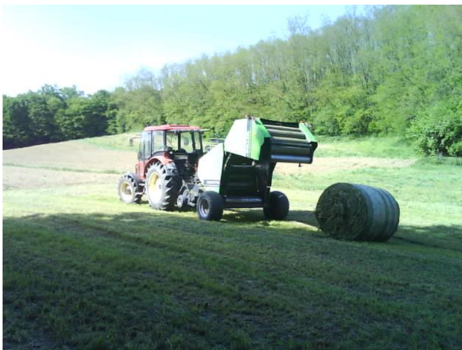
Slika 8. Roto preša Deutz-Fahr