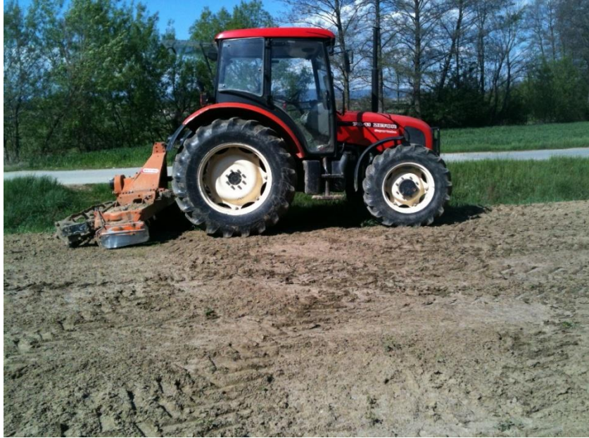
Slika 2. Traktor Zetor 7341 Super turbo

Kao što je već prije navedeno, na gospodarstvu su trenutno 3 traktora, koja služe svrsi i obavljaju sve poslove na farmi i u poljima. OPG u skoroj budućnosti planira nabavku 4 traktora zbog širenja obujma poslova i potrebe za većim i modernijim strojevima.