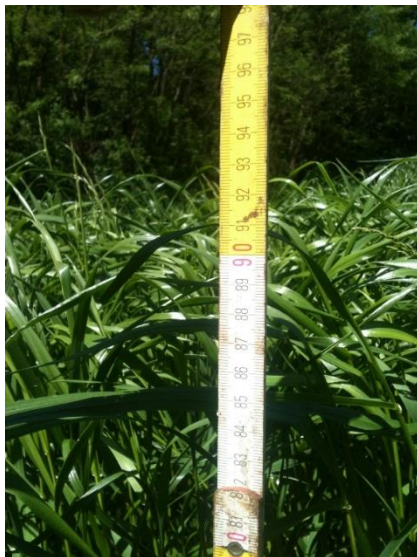
Slika 10. Prikaz visine prvog otkosa talijanskog ljulja

Košnja je također zahtjevniji proces jer iziskuje dosta snaga pogotovo kod livada sa većim prinosima zelene mase kao što možemo vidjeti na sljedećoj slici, gdje je visina prvog otkosa talijanskog ljulja varirala od 90-100 centimetara.