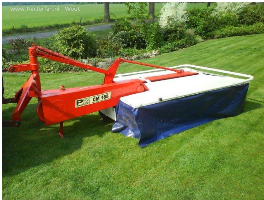
Slika 5. Rotacijska bubnjasta kosilica