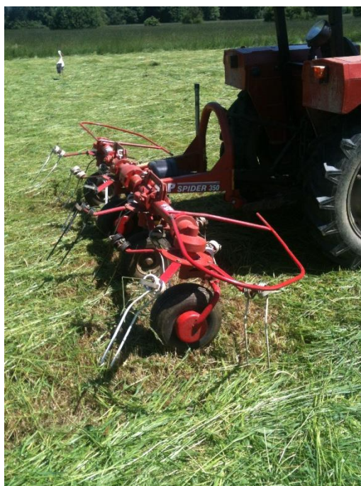
Slika 6. Okretač sijena SIP