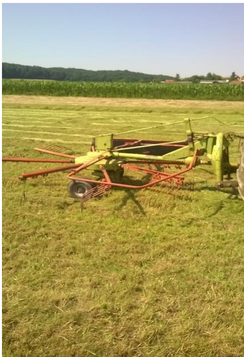
Slika 7 Sakupljač sijena CLAAS