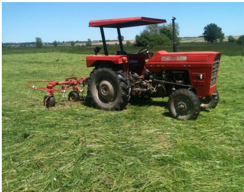
Slika 4. Traktor IMT 540

Traktor IMT 560 , snage je 42 kW, radi na poslovima košnje, sakupljanja, transporta bala, zatvaranja brazde, tj na poslovima koji zahtijevaju manje snage i koje je on u mogućnosti obavljati bez većih naprezanja.