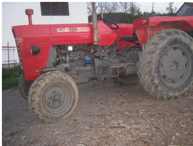
Slika 3. IMT 560

Traktor Zetor 7341 , snage 62,5 kW, u prosjeku radi oko 700 sati godišnje, zadužen je za teže poslove kao što su baliranje, oranje, podrivanje, transport i slične stvari.