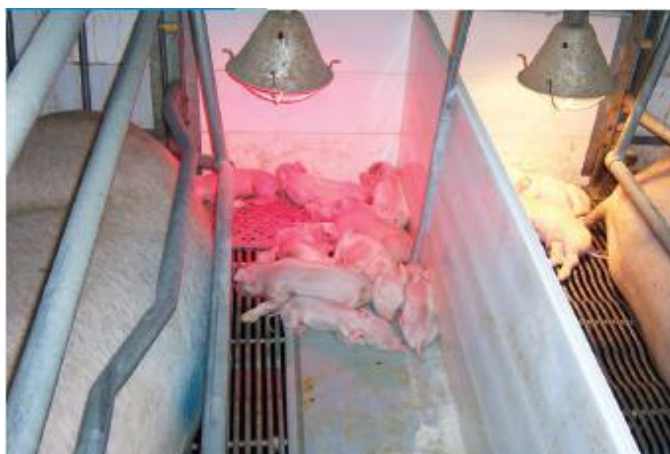
Slika 8. Prasad u prasilištu grije se ispod infracrvene lampe

Iako odrasle svinje u pravilu ne trebaju dodatno grijanje, ono se primjenjuje u nastambama s mlađim životinjama, odnosno u prasilištima, uzgajalištima, a ponekad i u predtovu. Prasad u prasilištima mogu se grijati infražaruljama, termogenima, plinskim grijalicama ili grijanjem poda na kojem leže prasci. Ima li dovoljno topline, svinje jasno pokazuju svojim ponašanjem. Vlasnik životinja mora pratiti ponašanje životinja i ovisno o ponašanju tijekom ležanja, precizno podesiti termoregulaciju (Kralik i sur., 2007). Može se napraviti strukturiranje obora, čime će temperatura u objektu i na ležištu biti drugačija. Također se mogu koristiti i izvori geotermalne energije.