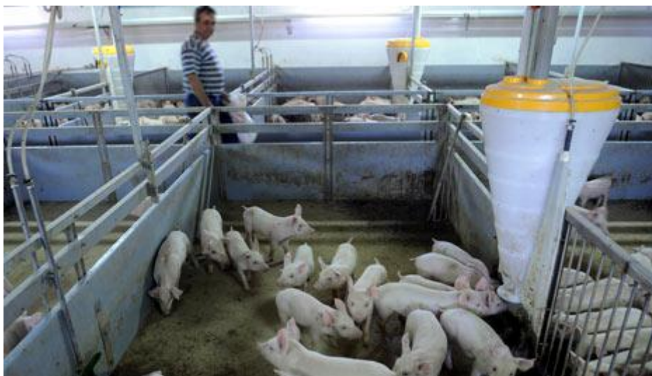
Slika 2. Prasad u uzgajalištu unutar zatvorenog tipa farme

Primjenjuju se drugačije zootehničke mjere, životinje su pod stalnim nadzorom što odgovara uzgoju plemenitih pasmina, a k tomu je i hranidba drugačija i specijalizirana. Također, u zatvorenom prostoru mikroklima je prilagođena potrebama životinja, a i higijena je veća nego u otvorenom sustavu držanja te je puno slabiji negativni efekt lošeg vremena. Unutar zatvorene farme nalaze se objekti za rasplodne svinje, objekti za prasenje i uzgoj prasadi te objekti za tov ( Uremović i Uremović, 1997 ).