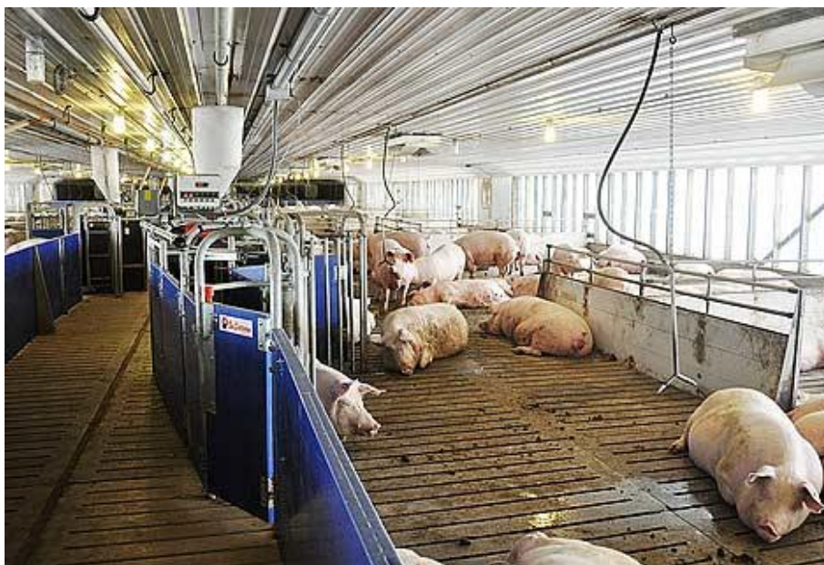
Slika 4. Krmače u čekalištu u skupnom boksu s Callmatic sistemom hranjenja

Objekt u kojem gravidne krmače borave nakon ustanovljivanja gravidnosti i do oko 5 dana pije prasenja, kada se sele u prasilište, što znači da krmače tamo borave oko 80-85 dana. Uglavnom su smještene u grupne boksove gdje su sortirane prema tjelesnoj masi, fizičkoj kondiciji ili očekivanom datumu prasenja. U jednom boksu može biti 6-10 životinja, a krmači treba biti osigurano 2,25 m 2 prostora, a nazimicama 1,64 m 2 . Boksovi imaju djelomično rešetkast pod. Također postoji i individualni način držanja koji je pogodniji zbog preciznije hranidbe. Krmače u čekalištu posebno se osjetljive na strest te treba biti pažljiv pri rukovanju i premještanju. U gospodarstvima s manjim brojem plotkinja gravidne se krmače mogu držati na pašnjaku u jednostavnim nastambama izgrađenim od drveta, trske i drugog priručnog materijala (Uremović 1997.) . Hranidba u čekalištu može biti ručna ili mehanizirana; spiralnim transporterom, lančastim transporterom, callmatic hranilicom itd.