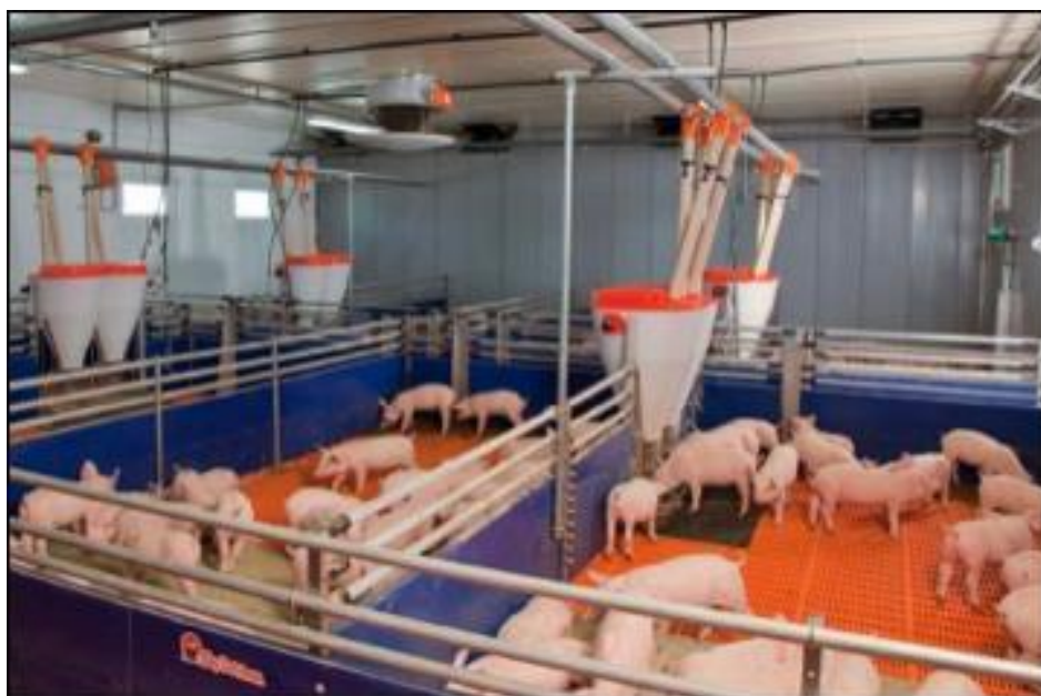
Slika 20. Prasad u uzgajalištu u sistemu Big Dutchman

Uzgajalište je objekt u kojem se uzgaja prasad do 25 kg. Sastoji se od 2 objekta unutar kojih se nalazi 18 soba po 12 boksova za skupno držanje prasadi, a svakom prasetu osigurano je minimalno 0,3 m 2 prostora. Prebacivanje prasadi iz prasilišta obavlja se nakon 28 dana starosti, a u uzgajalištu borave do postignutih 25-30 kg, nakon čega odlaze u tovilište. Uzgajalište je jedini dio farme na kojem se životinje hrane suhom hranom u peletiranom obliku, odnosno granulama. Sastoji se od dva objekta povezana hodnikom, a pod u sobama uzgajališta izrađen je od plastičnih rešetki ispod kojih su kanali za skupljanje fecesa i urina koji se povezanim kanalima prebacuju u bioplinsko postrojenje. Hranidba je automatizirana, a hrana se hranidbenim linijama prebacuje u volumne dozatore, tzv. „tubuse“ 4 koji se nalaze u boksovima, iz kojih hrana pada u hranilice. Uz to, koriste se i pravokutne hranilice za prihranu i davanje lijekova prasadi. Svaka soba sadrži 12 boksova za skupno držanje prasadi. Svaki boks ima podne ploče za grijanje prasadi u najranijim fazama uzgoja. Ventilacija je slična kao u prasilištu, samo što zrak ulazi kroz prozorčice, to jest klapne ispod krova objekta, a zatim kroz rešetkasti strop ulazi u objekt te se ventilatorima ustajali zrak izbacuje van. Objekt se grije grijaćim toplovodnim konvektorima.