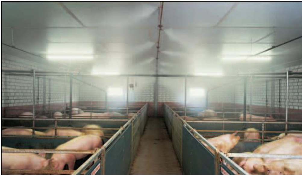
Slika 18. Prikaz rada CombiCool sustava za hlađenje