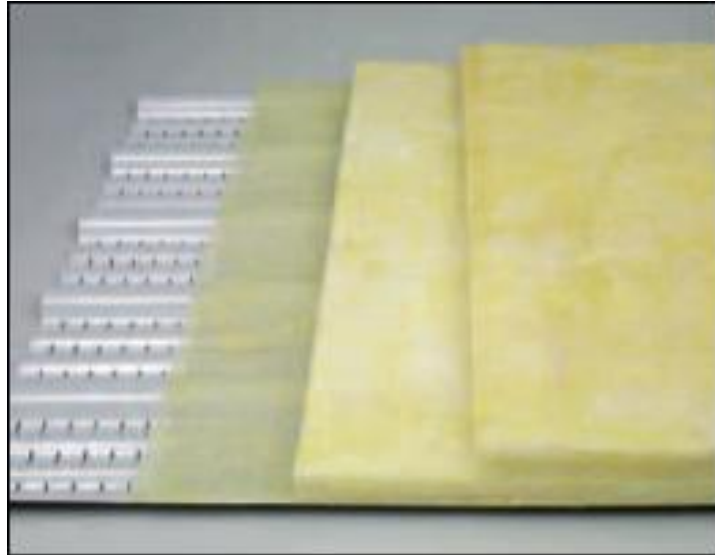
Slika 21. Propusni strop kroz koji ulazi svjež zrak u staju