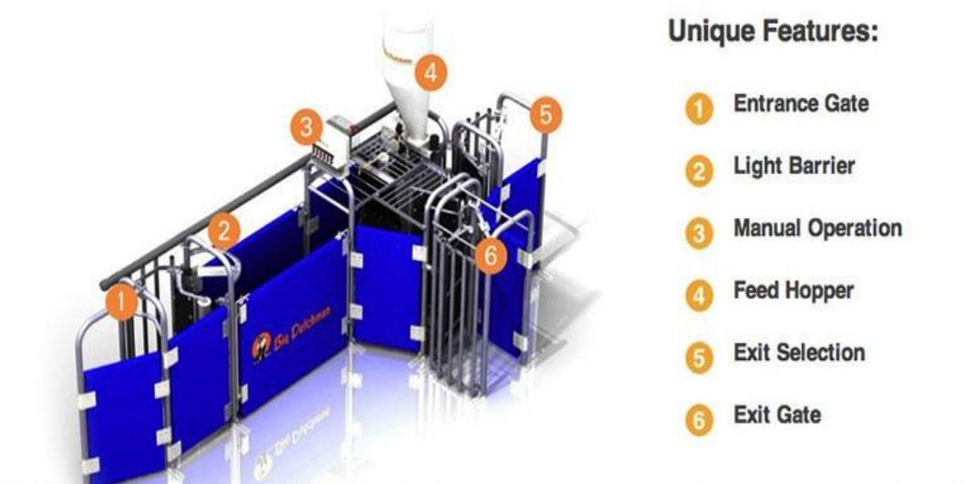
Slika 14. Shema hranidbene postaje Big Dutchman Callmatic sa 1.) ulaznim vratima, 2.) senzorom, 3.) računalom za ručne postavke, 4.) hranilicom, 5.) selekcijskim izlazom i 6.) izlaskom nazad u boks.

Čekalište je objekt gdje suprasne krmače i nazimice čekaju prasenje, odnosno sve do preseljenja u prasilište, što znači da u čekalištu ostaju oko 80 dana. Sastoji se od dvije velike prostorije s 22 skupna boksa za krmače gdje se krmače drže slobodno u boksovima, tj. nema uklještenja. Otprilike oko 5 dana prije prasenja krmače sele u prasilište gdje se prase te ostaju do zalučenja, odnosno povratka u pripustilište. Pod u čekalištu također je betonski te podijeljen na rešetkasti dio i puni pod. Hranidba u čekalištu je automatizirana i svaki skupni boks ima postaju za hranjenje – Big Dutchman callmatic sistem.