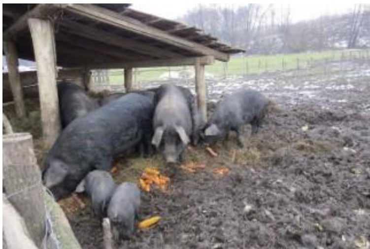
Slika 1. Držanje crnih slavonskih svinja na otvorenom

također pozitivno utječe i na kakvoću mesa. Za uzgoj na otvorenome najviše su sposobne autohtone primitivne vrste, kao što su u Hrvatskoj crna slavonska svinja i turopoljska svinja, jer one su otporne na bolesti, loše uvjete držanja i hranidbe. K tomu, krmače u laktaciji imaju bolji tek kada se nalaze na otvorenom te imaju kvalitetnije mlijeko.