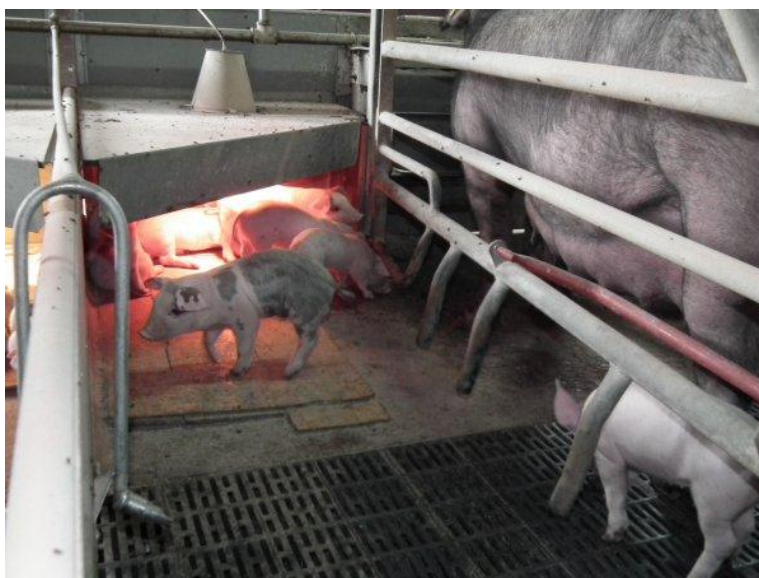
Slika 3. Polurešetkasti pod u prasilištu

Zatvoreni tip nastambi tijekom zime sačuva toplinu, a tijekom ljetnih mjeseci „odnosi“ višak topline, što znači da tijekom cijele godine osigurava protok čistog zraka (Kralik i sur. 2007). Ovakav tip nastambi koristi se za intenzivnu proizvodnju u kojoj je visok stupanj mehaniziranosti, ali su veliki troškovi izgradnje i opremanja. Uglavnom imaju rešetkaste ili polurešetkaste podove. Nastambe s rešetkastim podovima najčešće se koriste za tov svinja što znači da je cijela površina boksa rešetkasta, što međutim košta više nego polurešetkasti pod. Takve nastambe imaju kvalitetnu mikroklimu te stoga postižu najbolje proizvodne rezultate. S druge strane, nastambe s polurešetkastim podovima imaju 60-75% boksa s punim podom i blagim nagibom, a ostatak je rešetkasti pod izgrađen od betonskih gredica. Prednost je ta što je lakše zagrijati prostor tijekom zime, a nedostatak slabija higijena. Rešetkasti dio poda može biti od ljevenog željeza ili armirano-betonskih gradi, što je puno češće jer je jeftinije. Širina grede iznosi 10 cm, a razmak između njih 20 mm, jer ovaj razmak omogućuje dobro propadanje balege i nema ozljede papaka.