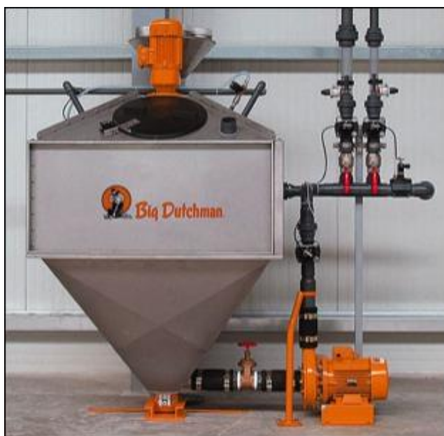
Slika 13. Big Dutchman postaja za miješanje hrane (za mokru hranidbu)

( http://bigdutchmanusa.com/wp-content/uploads/2014/07/wetmix-4.jpg )