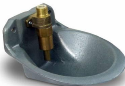
Slika 10. Pojilica tipa posude za prasad