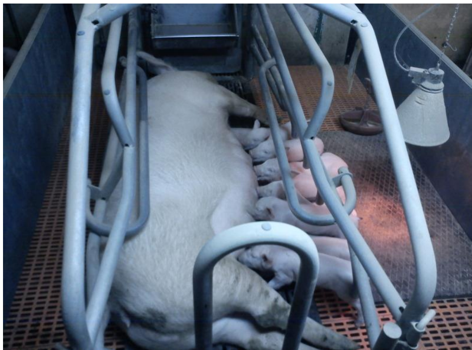
Slika 5. Krmača i prasad u prasilištu

mehanizirana, krmače u boksovima glavom su okrenuta jedna prema drugoj. Valov od pocinčanog lima nalazi se u prednjem dijelu boksa, a hranidba može biti mehanizirana ili ručna, dok se mali valov za privikavanje prasadi nalazi postrance. Prasad se može zaštititi od prignječenja ugradnjom uređaja za rastjerivanje prasadi. Okretanje krmača može se spriječiti ugradnjom gornjih poprečnih cijevi, a boks za prasnje može se koristiti kao privremeni smještajni prostor za prasad nakon odbića od krmače. Vrste podova u boksovima za prasnje mogu biti: puni pod, mrežasti pod od žice ili perforirani pod, ali prasilišta u modernim farmama ne koriste prostirku, nego se prasad drži na mrežastim ili rupičastim podovima, uz ugrađen prostor za ležanje prasadi izgrađen od tvrde plastike. Boksovi od aluminijskog rupičastog lima trajniji su, a na njima je i manja je i manja mogućnost ozljeda nogu sisajuće prasadi i vimena krmača. Propusnost za ekskreme krmača slabija je nego u žičanih podova, što ima za posljedicu slabiju higijenu u boksu za prasnje. Boksovi od sintetskog rupičastog materijala trajniji su, topliji, udobniji, s minimalnim troškovima održavanja u odnosu na podove izrađene od žice ili aluminija (Uremović i Uremović, 1997.).