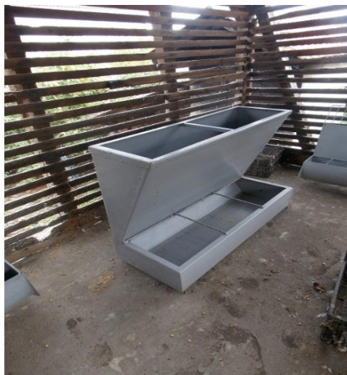
Slika 10. Hranilica za tov svinja

Dozatori hrane koriste se u individualnoj hranidbi sa suhom hranom, rade na masenom ili volumnom udjelu, a imaju zapremninu oko 10 litara, konusnog su oblika i otvor na dnu može se otvarati ručno ili automatski, s time da se zapremnina može podesiti. Punjenje dozatora obavlja se pomoću sustava transportera koji transportiraju hranu iz silosa ili iz mješaonica hrane (Kralik i sur., 2007).