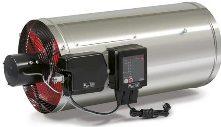
Slika 9. Klasični plinski grijač