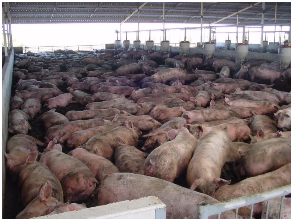
Slika 6. Velika grupa tovljenika u tovilistu