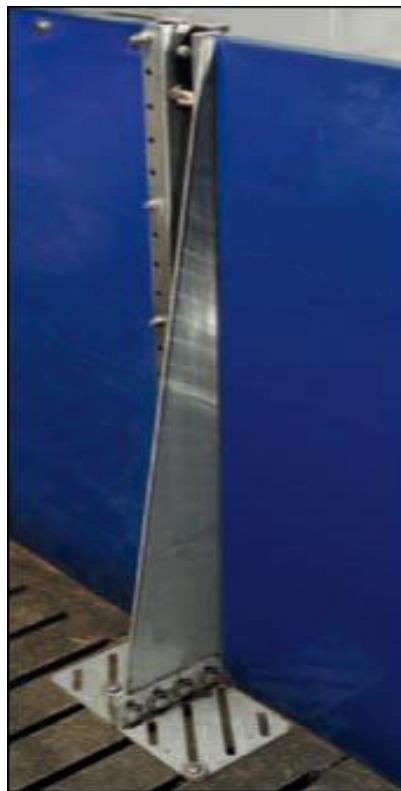
Slika 22. Pregrada za boksove

( http://bigdutchmanusa.com/wp-content/uploads/2014/07/diffair-3.png )