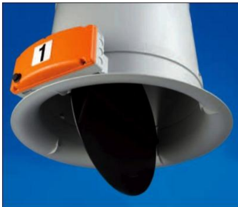
Slika 17. Ispušni ventil kroz koji zrak izlazi iz nastambe