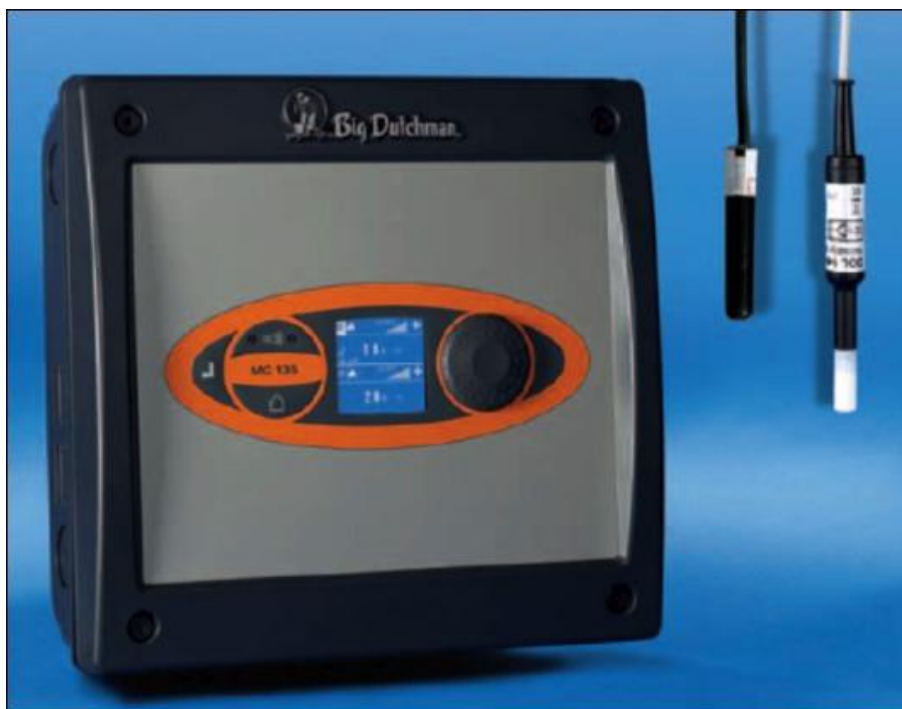
Slika 19. Računalo pomoću kojega se kontrolira ventilacija u objektu

( http://bigdutchmanusa.com/wp-content/uploads/2014/07/combicool-1.png )