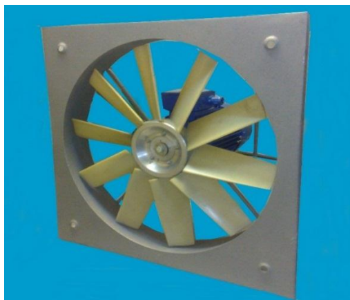
Slika 7. Aksijalni ventilator

se na zidni ili prozorski otvor, a rade na principu usmjeravanja strujanja zraka u pravcu svoje osovine. Prema obliku krilaca na propeleru postoje ventilatori ravnog i srpastog oblika.