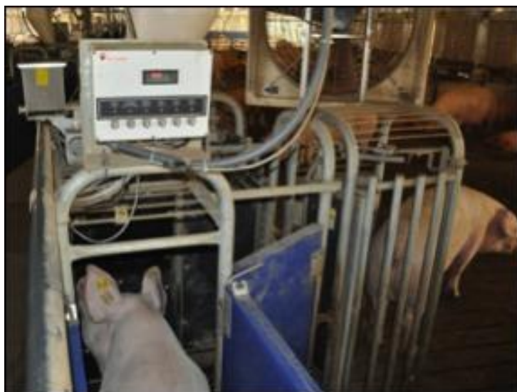
Slika 15. Hranidbena postaja Big Dutchman callmatic