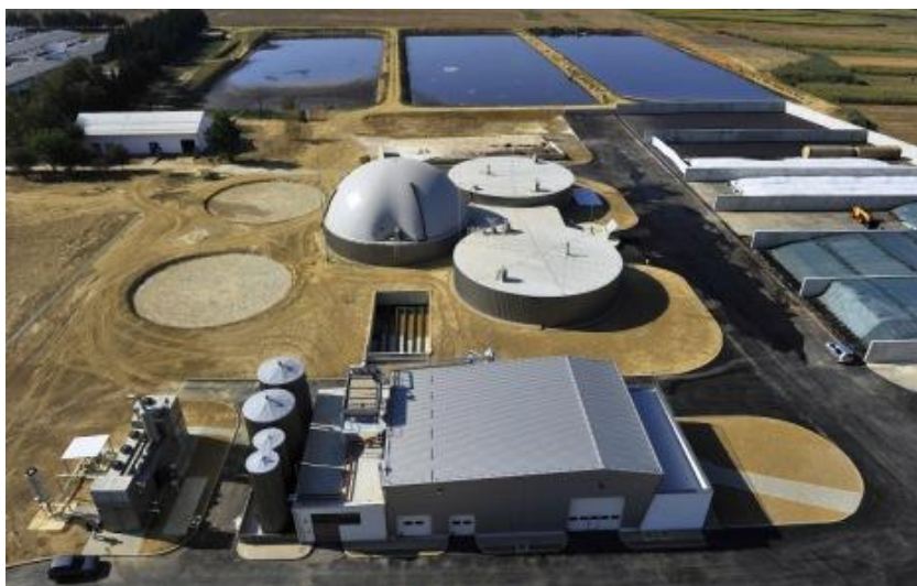
Slika 11. Bioplinsko postrojenje