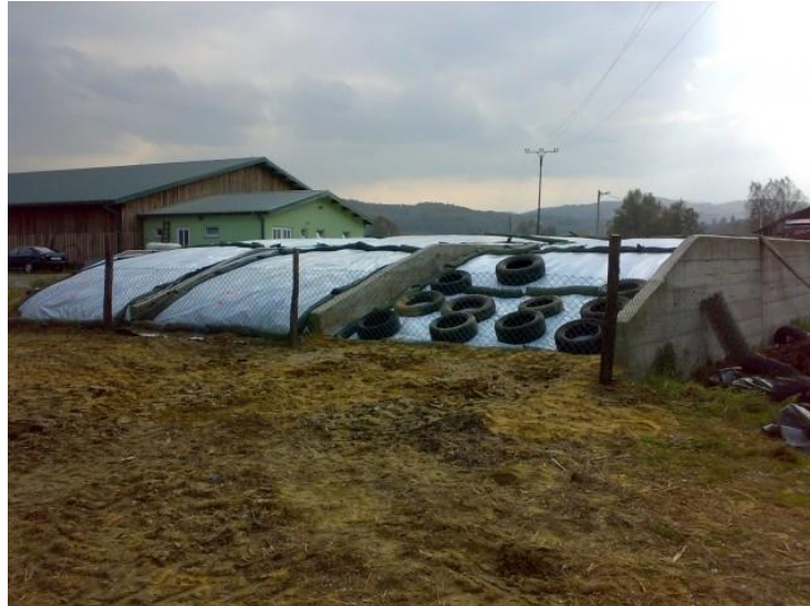
Slika 7: Horizontalni silosi