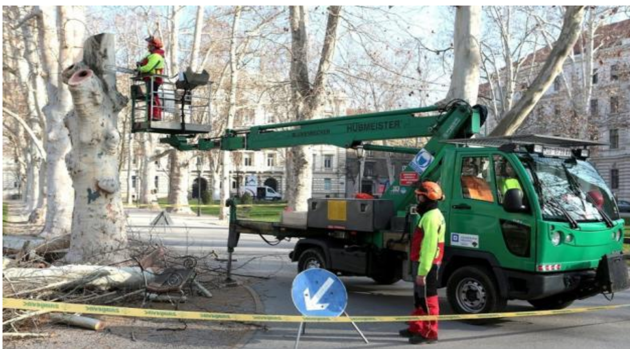
Slika 4. Orezivanje drveća

Da bi do procesa kompostiranja uopće došlo, bio-otpad je potrebno sakupiti i dovesti do kompostišta. S obzirom na površine koje se održavaju u Zagrebu, količina dovezenog bio-otpada je velika. Biomasa se skuplja s javnih površina grada Zagreba tokom čitave godine. Ostaci koji nastaju nakon rezidbe i rušenja drveća u parkovima i drvoredima, košnje trave, sakupljanje lišća u jesenskom periodu, te rezidbe grmlja i živica tvore biomasu koju koristimo u proizvodnji komposta. Otkad je kompostana otvorena sa svim sadašnjim strojevima i uređajima, podružnica Zrinjevac sakuplja bio-otpad koji nastaje izvan grada Zagreba te su trenutno jedini u Zagrebačkoj županiji koji imaju strojeve za usitnjavanje velikih panjeva i slične krupne biomase.