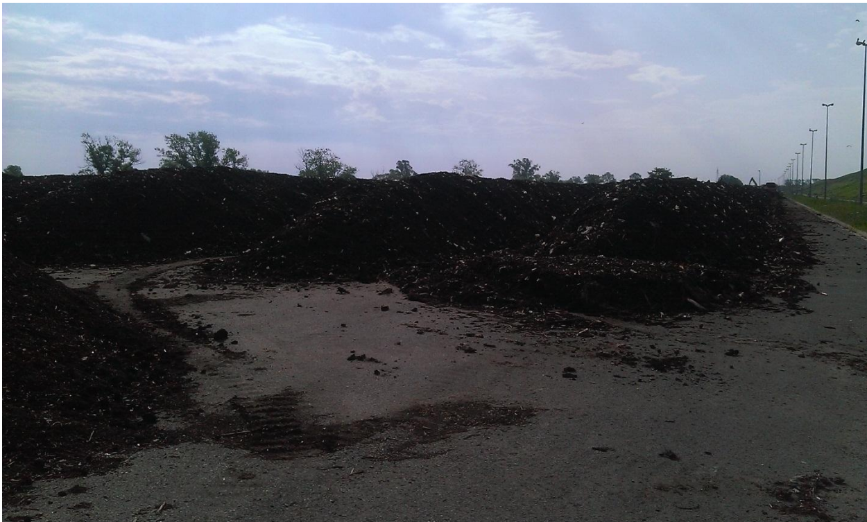
Slika 2. Snimak kompostane Jakuševac