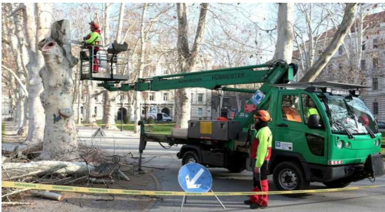
Slika 4. Orezivanje drveća

Da bi do procesa kompostiranja uopće došlo, bio-otpad je potrebno sakupiti i dovesti do kompostišta. S obzirom na površine koje se održavaju u Zagrebu, količina dovezenog bio-otpada je velika. Biomasa se skuplja s javnih površina grada Zagreba tokom čitave godine. Ostaci koji nastaju nakon rezidbe i rušenja drveća u parkovima i drvoredima, košnje trave, sakupljanje lišća u jesenskom periodu, te rezidbe grmlja i živica tvore biomasu koju koristimo u proizvodnji komposta. Otkad je kompostana otvorena sa svim sadašnjim strojevima i uređajima, podružnica Zrinjevac sakuplja bio-otpad koji nastaje izvan grada Zagreba te su trenutno jedini u Zagrebačkoj županiji koji imaju strojeve za usitnjavanje velikih panjeva i slične krupne biomase.