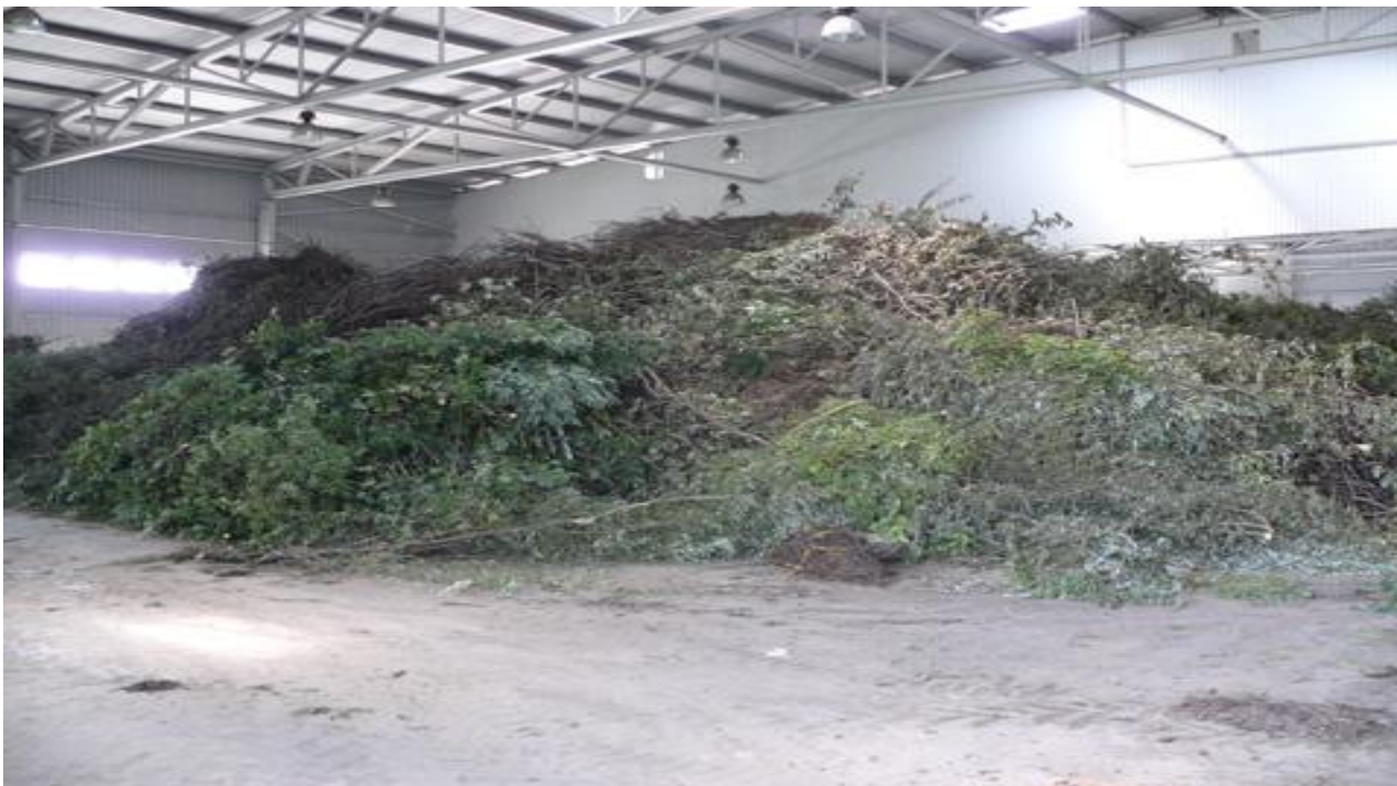
Slika 6. Organski otpad na odlagalištu