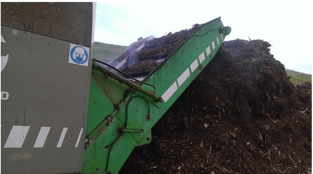
Slika 9. Hrpa mljevenog materijala pri izlasku iz drobilice