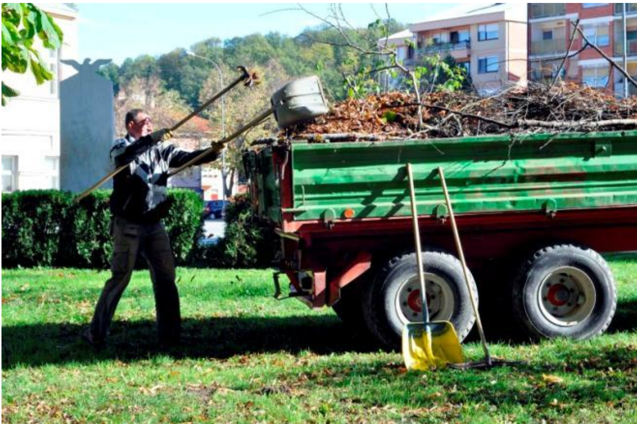
Slika 5. Utovar bio-otpada u kamion