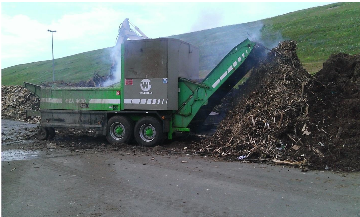
Slika 7. Usitnjivač Willibald MZA-4600

Analizom rada stroja „Willibald“ može se zaključiti da stroj ima jako veliki kapacitet, ali i nedovoljno kvalitetno usitnjavanje. Jednom garniturom noževa (48 komada) može usitniti 2000-3000 m 3 biomase. Nova generacija usitnjivača (u SAD i Europi) je uz smanjenje kapaciteta znatno povećala kvalitetu usitnjavanja. Korištenjem takvih strojeva i boljom kvalitetom noževa, postiže se bolje usitnjavanje te se znatno skraćuje vrijeme fermentacije bio-otpada.