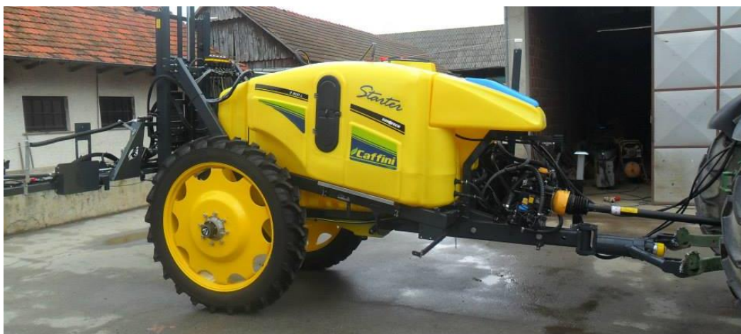
Slika 11. Vučena prskalica za zaštitu bilja

Strojevima kojima se provodi kemijska zaštita bilja postavljeni u neki standardi u pogledu opremanja minimalnom opremom, bez koji niti jedna prskalica ne bi smjela biti korištena za primjenu pesticida. Na gospodarstvu gdje se istraživanje provodilo koristile su se dvije prskalice marke Caffini vučena od 2900 litara i nošena od 800 litara.