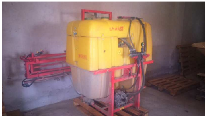
Slika 4. Prskalica, AKPIL 800 l

Zaštita protiv korova provedena je 3. ožujka 2015. herbicidom Alistergrande 0,8 l/ha. Prva zaštita protiv bolesti provedena je 16. travnja 2015. fungicidom Falcon 0,6 l/ha, a druga 12. svibnja 2015. fungicidom Prosaro 1 l/ha + Biscaya 0,3 l/ha (prskalicom AKPIL zapremine 800 l, širine zahvata 12 m).