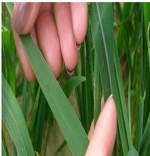
Slika 9. Bolest Septoria sp.

Vegetacijska sezona bila je iznimno siromašna oborinama, najviše u ožujku i travnju. Proizvodni pokus pogodila je elementarna nepogoda (tuča, 8. srpnja 2015.) neposredno prije kombajniranja. Procjena ovlaštenoga procjenitelja bila je da šteta od tuče na pokusu iznosi prosječno 17 % što ovisi o sorti (kasna/rana, golica/brkulja). Kod sorata Bologna i Renan evidentirana je Septoria sp.