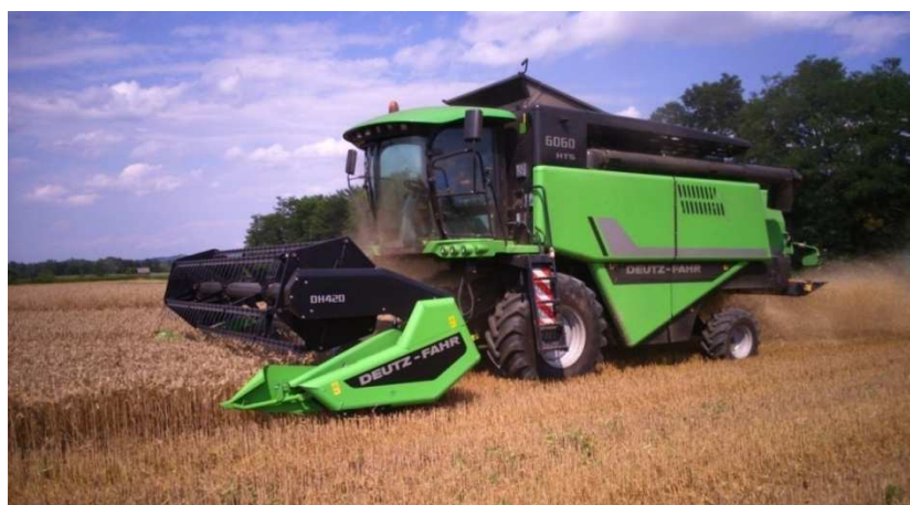
Slika 8. Kombajn, Deutzfah 6060 HTS

Žetva je obavljena 15. srpnja 2015. kombajnom Deutzfah 6060 HTS . Kombajn nije u vlasništvu OPG-a Šopar, već je korišten iz uslužnih djelatnosti.