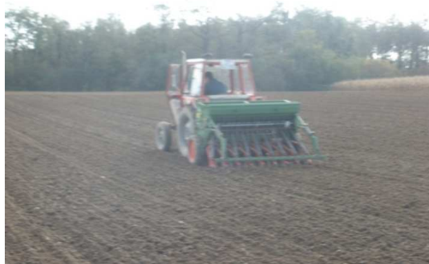
Slika 2. Sjetva traktorom IMT 539 te sijačicom Hassia DK2000

Pokus je zasijan 5. studenoga 2014. godine. Sjetva je bila obavljena izvan optimalnoga roka zbog obilnih kiša i zadržavanja vode na parceli.