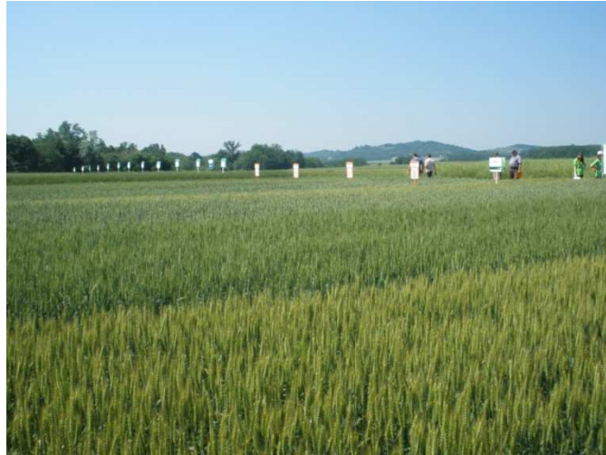
Slika 1. Pokus pšenice