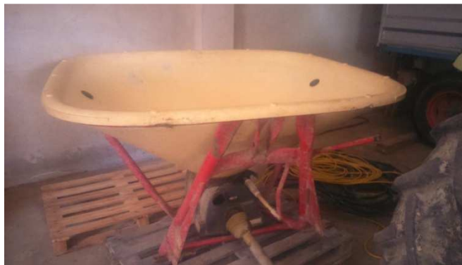
Slika 3. Rasipač mineralnoga gnojiva, Vicon 400 kg

Gnojidba je izvršena na sljedeći način: u tlo je zaorano 300 kg/ha NPK 0-20-30, a u predsjetvenoj je obradi tla dodano još 200 kg/ha NPK 15-15-15. U prvoj se prihrani, 4. ožujka 2015., dodalo 150 kg/ha KANA, a u drugoj, 2. travnja 2015., dodano je još 110 kg/ha KANA. Gnojidba je izvršena rasipačem mineralnoga gnojiva marke Vicon, nosivosti 400 kg.