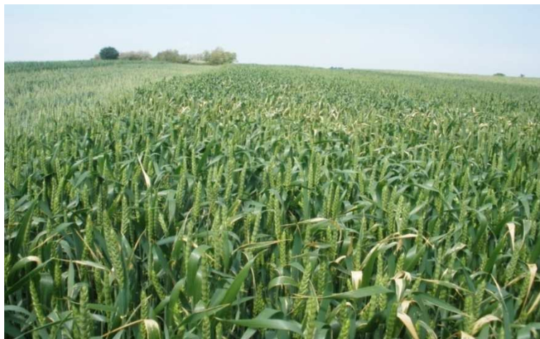
Slika 7. Pšenica u fazi klasanja

U fazu klasanja pšenica je ušla, ovisno o sorti, od 13. do 17. svibnja 2015. godine. Točan datum ulaska svake sorte pšenice u fazu klasanja nije evidentiran.