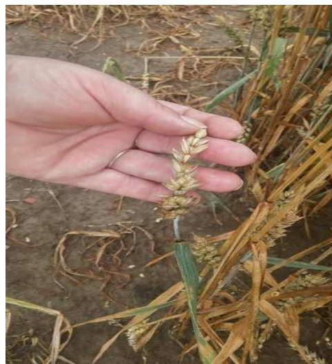
Slika 10. Pšenica nakon tuče