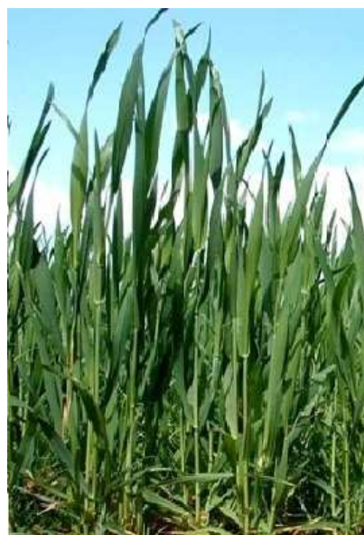
Slika 6. Pšenica u fazi vlatanja