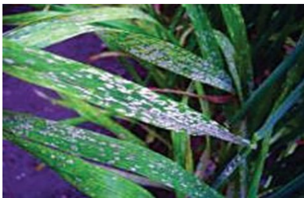
Slika 4. Pepelnica na listu pšenice