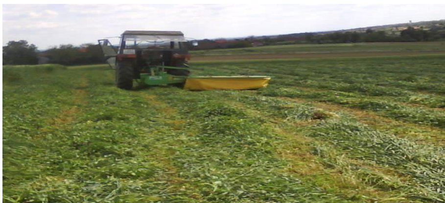
Slika 16. Kosilica s bubnjevima marke SAMASZ u radu