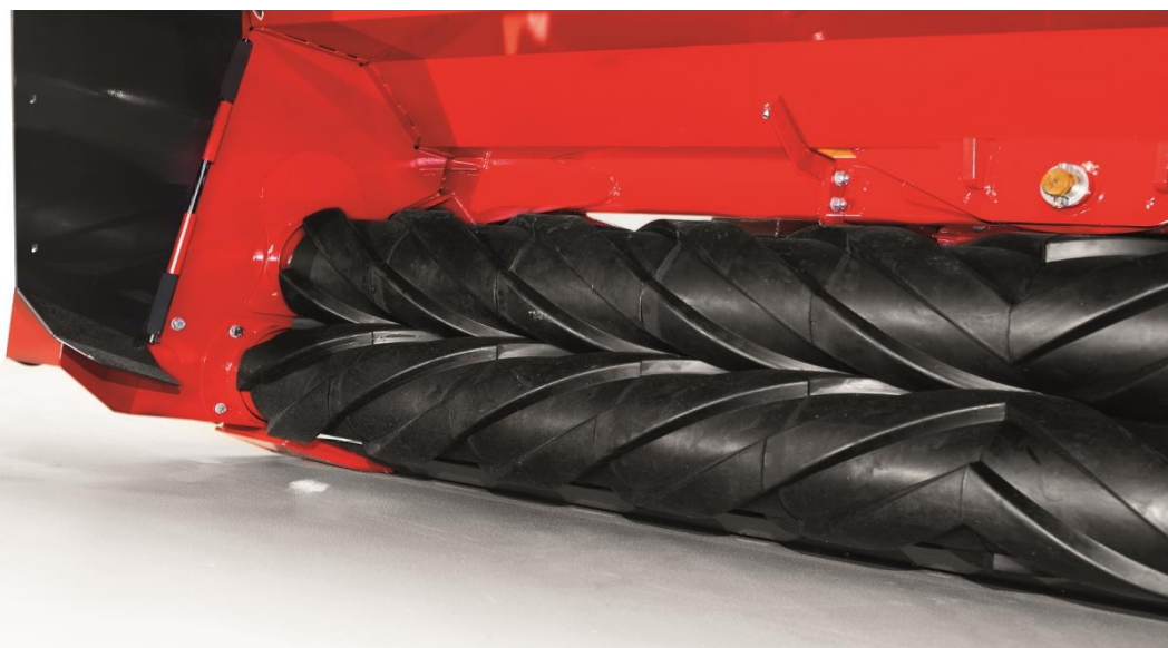
Slika 5. Gnječilica ugrađena na kosilicu

Da bi sačuvali lišće na stabljici, u novije vrijeme za košnju zelene mase preporučuje se korištenje kosilice koja je opremljena s gnječilicom (Slika 5.). Gnječenjem se ujednačava vrijeme sušenja stabljike i lišća, te se skraćuje vrijeme njihovog sušenja.