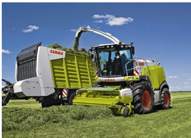
Slika 10. Silažni kombajn

Kombajn provenutu masu sakuplja, sječka i utovara u prikolicu. Masa u obliku sječke lakše se s polja transportira na mjesto istovara te se lakše ugazi u silos. Razgrtanje i gaženje mase odvija se isto kao i kod spremanja sjenaže samoutovarnom prikolicom.