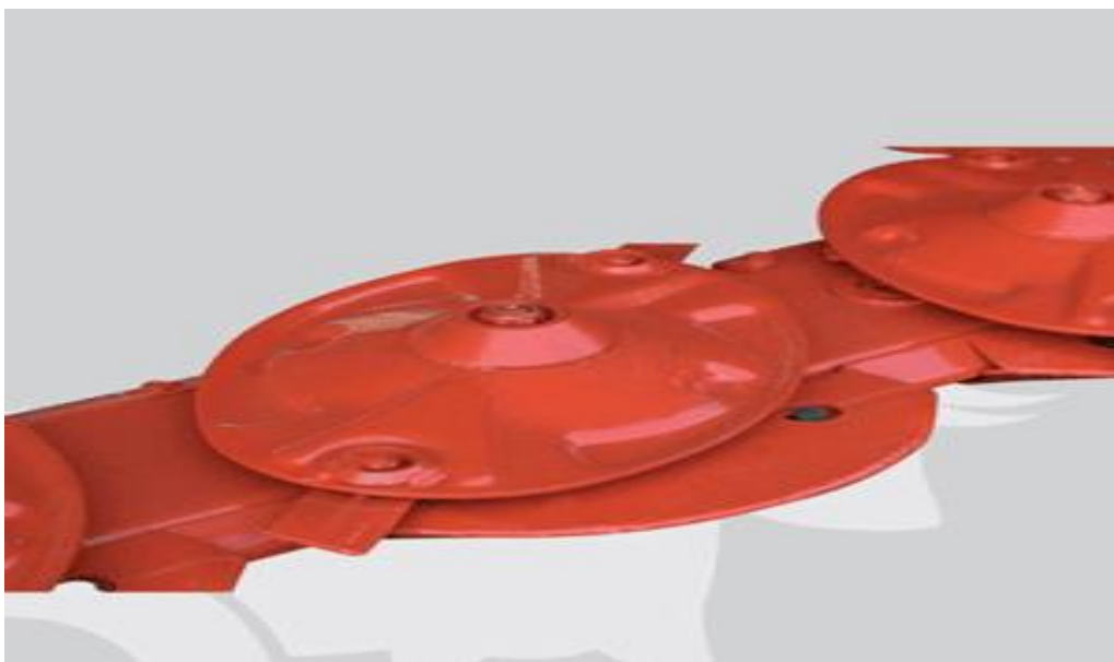
Slika 4. Diskovi sa dva noža