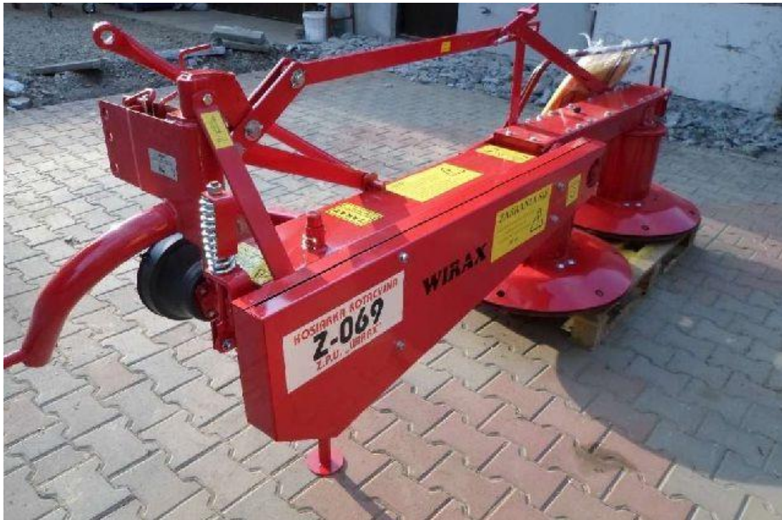
Slika 3. Rotacijska kosilica s bubnjevima