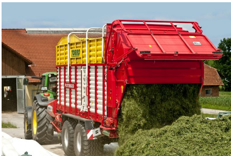
Slika 9. Samoutovarna prikolica

Prema Landeki (2004) jedan od najjeftinijih načina spremanja sjenaže svakako je spremanje samoutovarnom prikolicom (Slika 9.). Naime, prosušena masa sakupljena u zbojeve podiže se sakupljačkim pick-up uređajem u samoutovarnu prikolicu a uređajem za rezenje reže se na ulazu u sanduk prikolice. Istovar ovakve mase u silos odvija se pokretnim podom prikolice koji transportira krmu prema otvoru na stražnjem dijelu prikolice. Istovarenu masu u silosu treba što ravnomjernije razgrnuti da bi se što bolje istisnuo zrak, da bi gaženje bilo što kvalitetnije, te da bi u krajnjem slučaju bilo što manje kvarenje sjenaže. Razgrtanje mase obavlja se ralicom. Nakon razgrtanja mase obavlja se njeno gaženje u silosu. Gaženje se odvija teškim traktorima ili radnim strojevima.