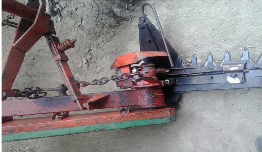
Slika 2. Oscilirajuća kosilica s pomičnim prstima