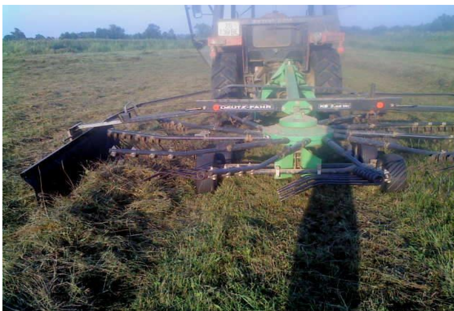
Slika 20. Sakupljač provenute mase marke DEUTZ FAHR u radu

Kod sakupljanja krme kombiniranim okretačem-sakupljačem marke SIP FAVORIT, na parceli od 1 ha bilo je potrebno 3 sata i 10 minuta, a za sakupljanje na parceli veličine 0,28 ha bilo je potrebno 54 minute, što znači da bi za 1 ha bilo potrebno 3 sata i 12 minuta.