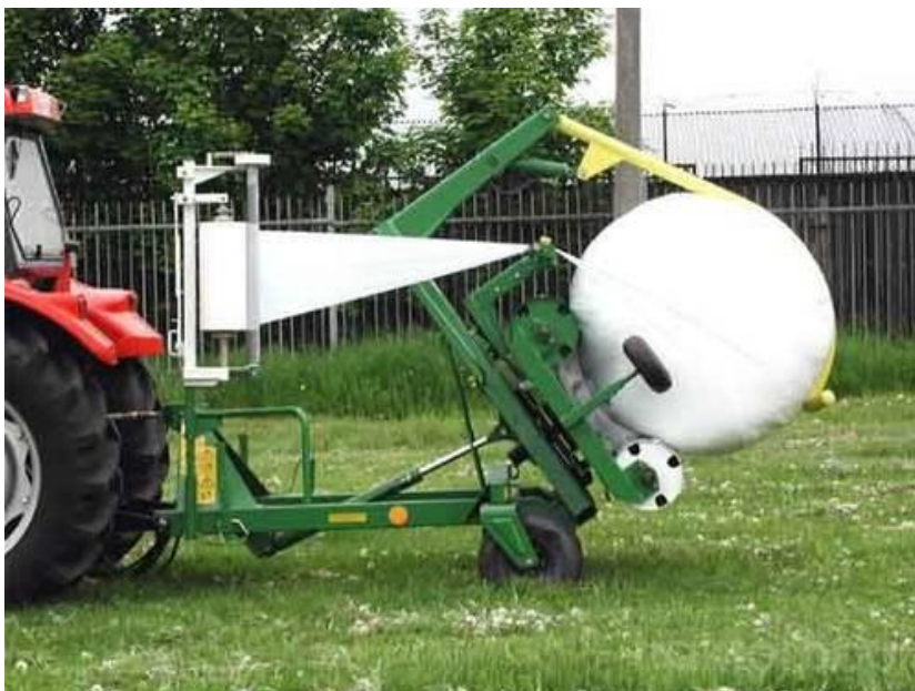
Slika 13. Spuštanje bale na tlo