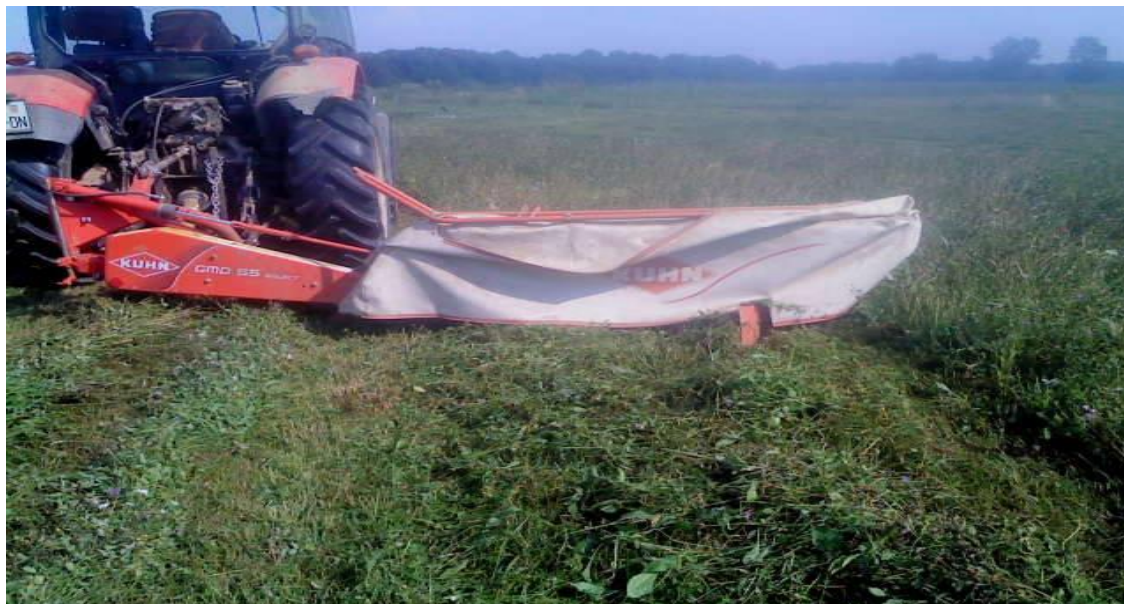
Slika 17. Kosilica s diskovima marke KUHN u radu

Iz ovog istraživanja (Tablica 3.) uočljivo je da kosilica s diskovima (Slika 17) zbog većeg radnog zahvata, te veće radne brzine ima veći učinak u odnosu na kosilicu s bubnjevima. Kod male površine potrebno je više vremena za košnju i okretanje na uvratinama zbog nepravilnog oblika parcele.