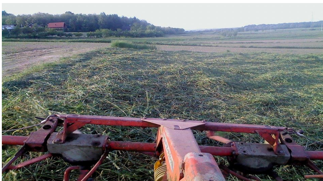
Slika 19. Okretač marke DEUTZ FAHR u radu