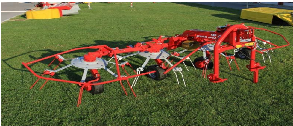
Slika 6. Okretač zelene mase

Svježe pokošenu masu treba okretati da bi se u što kraćem vremenskom periodu prosušila. Ovim postupkom pokošena masa okreće se i rahli, tako da sunčeva toplina i strujanje zraka mogu lakše prosušiti masu. Okretač mase je priključni stroj koji se prikapča na stražnju stranu traktora. Okretač mase se sastoji od rotora s rukama na čijim se krajevima nalaze elastični prsti koji zahvaćaju pokošenu masu, te ju okreću i ostavljaju iza stroja. Stroj se sastoji obično od rotora u paru. Ovaj tip okretača zelene mase radi na principu zvrka.