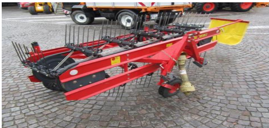
Slika 7. Okretač i sakupljač s beskonačnim remenom

U ne tako davnoj prošlosti kod spremanja zelene mase u sjenažu često su bili korišteni okretači s beskonačnim remenom na kojima se nalaze elastični prsti. Ovaj tip okretača, a ujedno i sakupljača, svakako je bio vrlo praktičan za mala poljoprivredna gospodarstva zbog toga što se jednim strojem obavlja okretanje i sakupljanje mase. Zbog malog radnog zahvata i radnog učinka ovaj priključni uređaj nije prikladan za spremanje sjenaže na većim gospodarstvima.