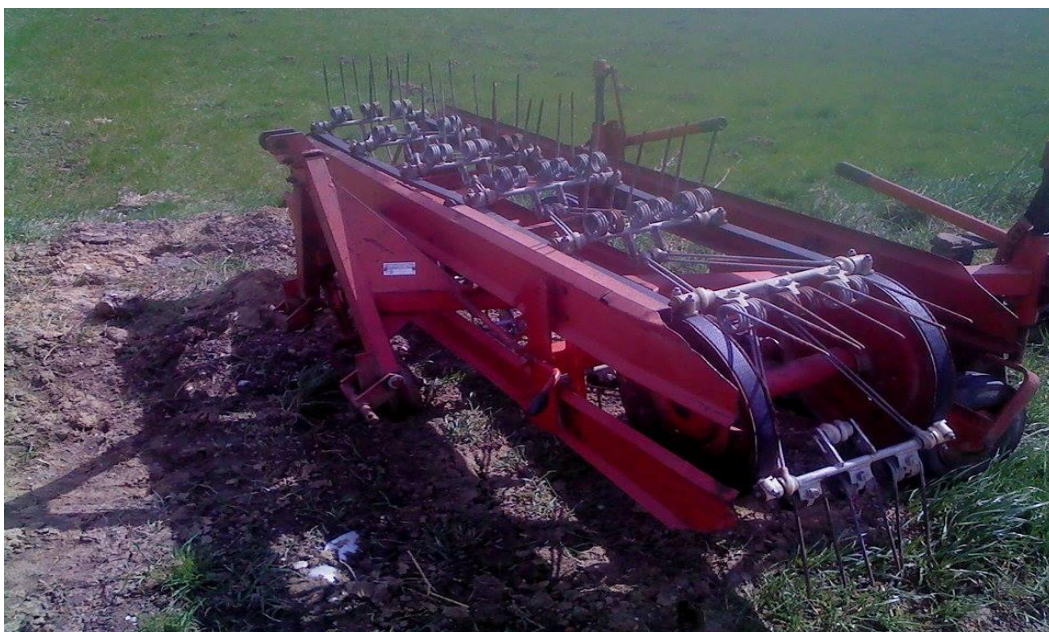
Slika 18. kombinirani okretač-sakupljač marke SIP