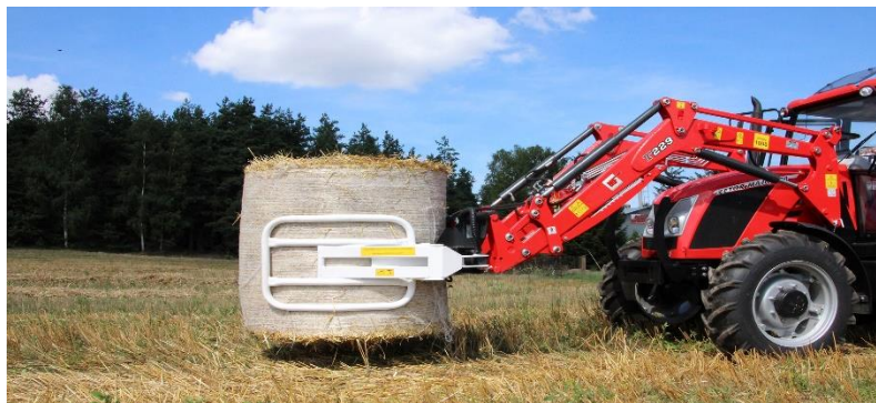
Slika 15. Hvataljke za bale u radu

Ulaskom zraka u balu doći će do aerobnih uvjeta u bali i tako nastati kvarenje mase u bali (Šumanovac, 2011).