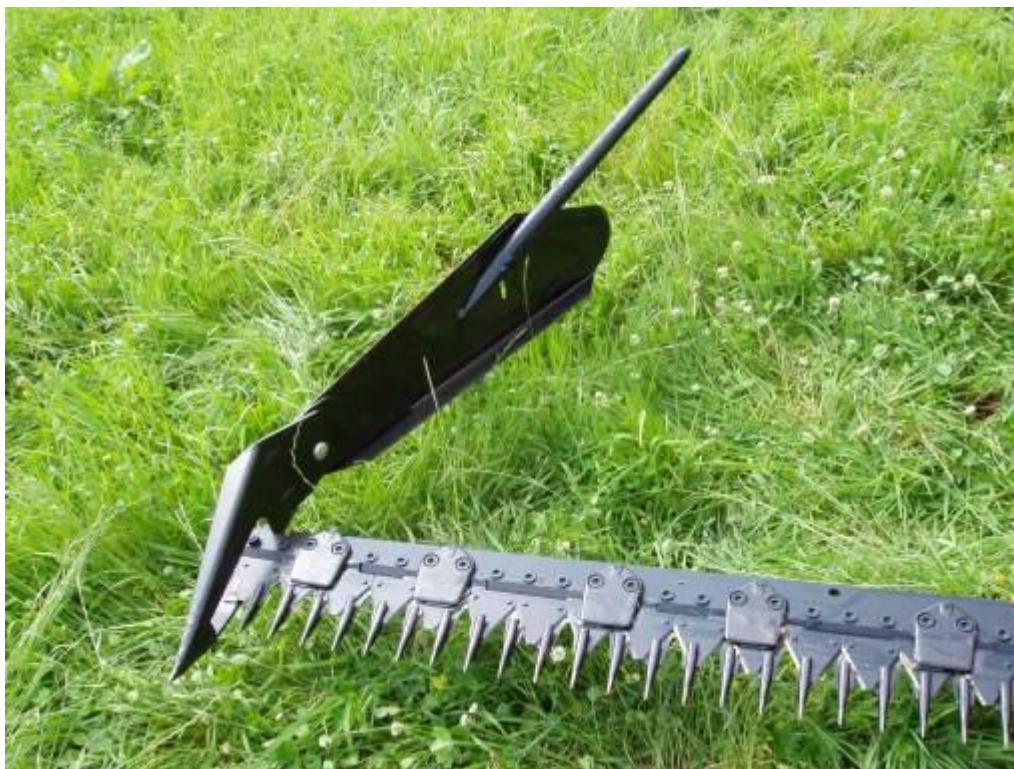
Slika 1. Oscilirajuća kosilica s kosom i prstima