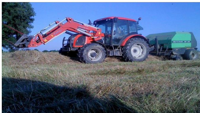
Slika 21. Preša u radu