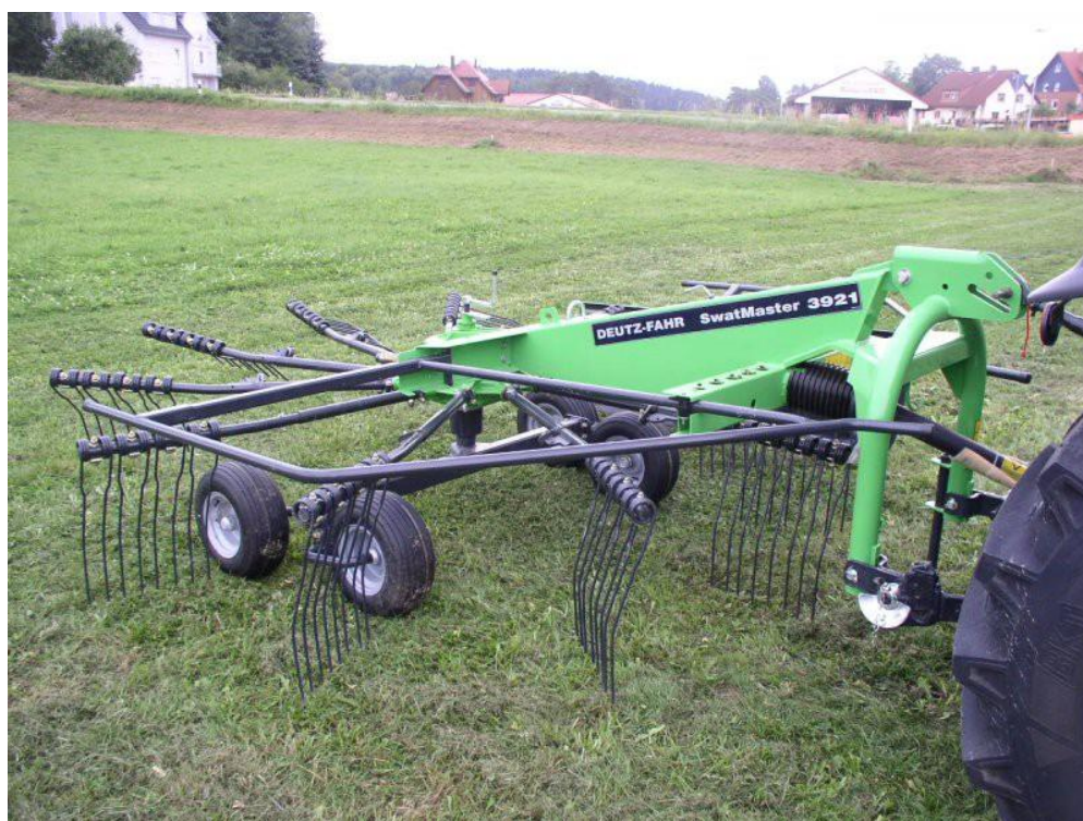
Slika 8. Rotacijske grablje

Svi ovi dodatci i oprema poboljšavaju kvalitetu rada i učinak stroja.