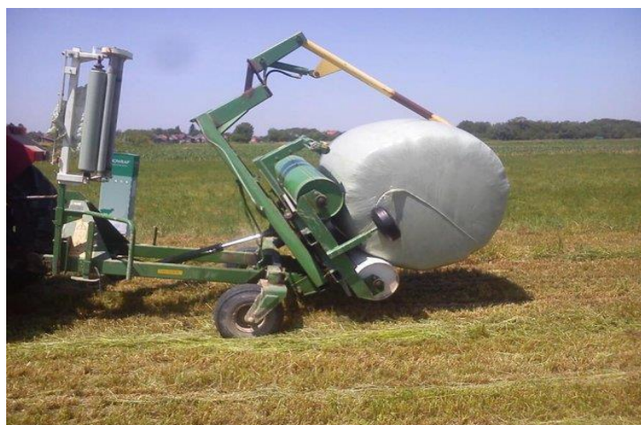
Slika 22. Omotač bala u radu