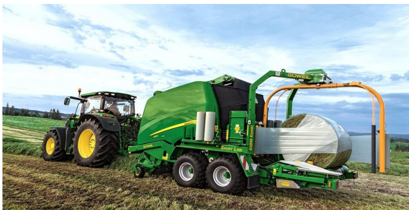
Slika 14. Preša i omotač u jednom stroju

Također, da bi se postigao veći radni učinak, veća gospodarstva posjeduju kombinaciju preše i omotača u jednom stroju (Slika 14.).