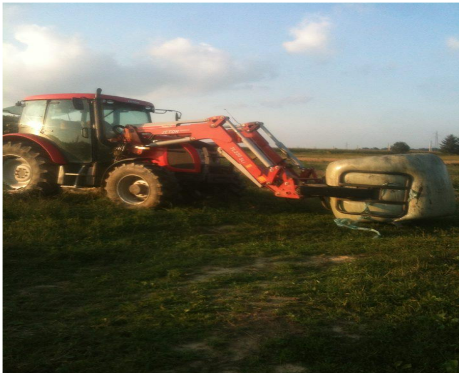
Slika 23. Traktor s prednjim traktorskim utovarivačem i hvataljkama za bale

Nakon baliranja i omatanja, bale je potrebno u što kraćem vremenskom periodu transportirati u gospodarsko dvorište ili gdje će odstajati. Za transport bala gospodarstvo koristi prikolicu marke TEHNOSTROJ, dok za utovar i istovar bala koristi prednji traktorski utovarivač marke TRAC LIFT koji je montiran na traktor marke ZETOR 8441 snage 66 kW. Da bi se spriječilo oštećenje folije prilikom utovara i istovara bala, na prednji traktorski utovarivač potrebno je montirati hvataljke za bale. Kapacitet prikolice za transport bala je 8 komada.