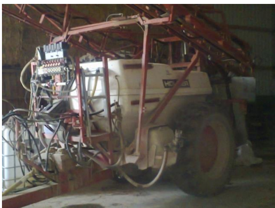
Slika 20. Prskalica