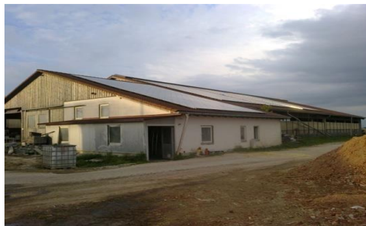
Slika 5. Staja za mliječne krave na OPG Stadler