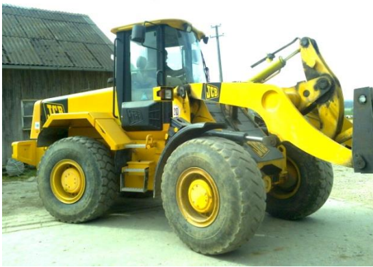
Slika 16. Utovarivač JCB