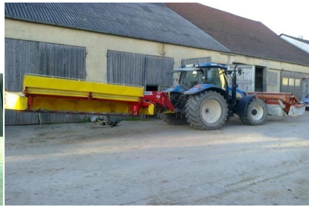
Slika 17. Traktor sa prednjom i stražnjom kosom