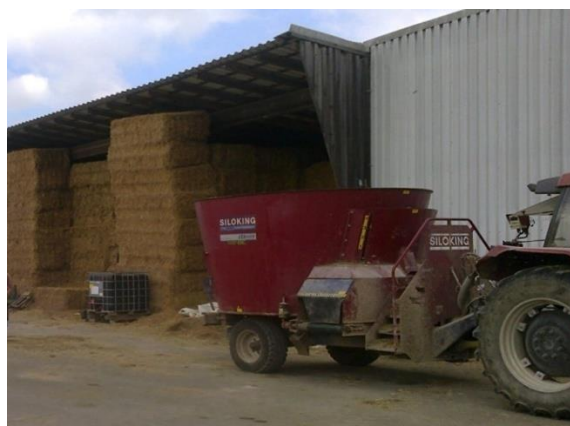
Slika 12. Spremište za slamu