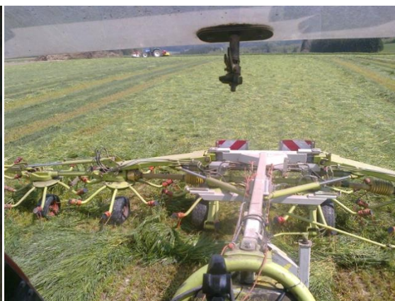
Slika 21. Prekretač za sijeno