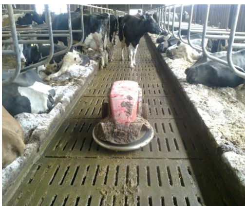
Slika 13. Robot za čišćenje rešetkastog poda marke „Lely“