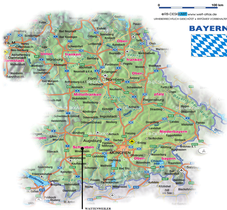
Slika 3. Položaj sela Wattenweiler