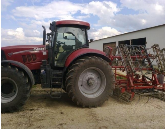
Slika 14. Traktor Case IH Puma CVX 185