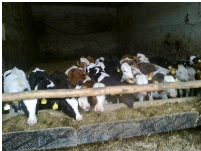
Slika 8. Staja za telad

U staji za telad nalazi se 5 malih i 2 veća boksa. Telad se nalazi na dubokoj stelji. U manjim boksovima drži se telad starosti od 3 tjedna do 3 mjeseca, a u većim od 3 mjeseca do 5 mjeseci starosti. Telad se napaja mliječnom zamjenicom, marke „Sprayfo“. Hrani se ručno, a svakodnevno se stavlja nova slama i brine se o higijeni. U blizini se nalaze i 3 vanjska iglua u koje se smješta telad odmah nakon teljenja.