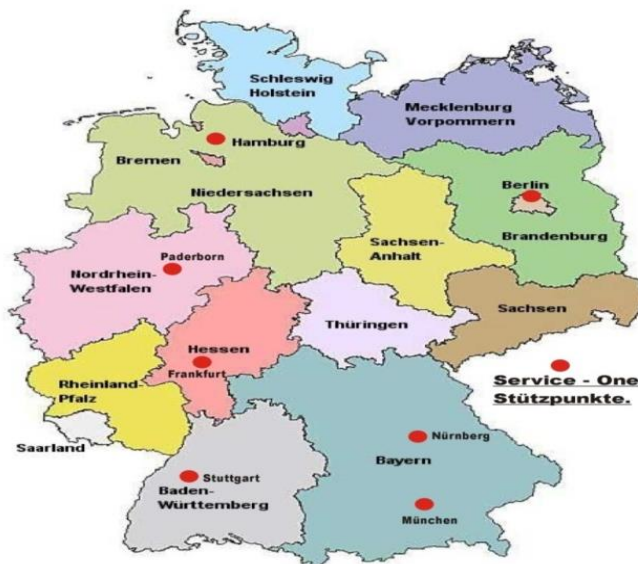
Slika 1. Položaj savezne države Bavarske u Njemačkoj

OPG Stadler najveće je poljoprivredno gospodarstvo u selu Wattenweiler.