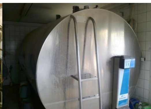
Slika 23. Spremnik za mlijeko