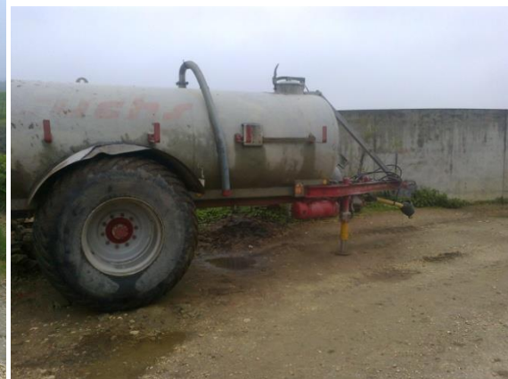
Slika 19. Cisterna za gnojnicu