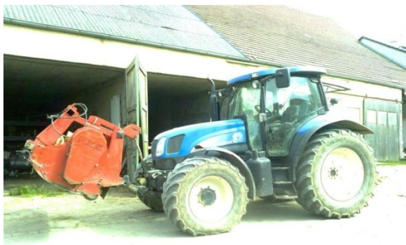
Slika 10. Prikaz garaže i radionice u pozadini traktora