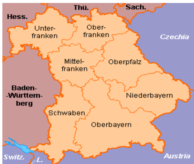
Slika 2. Prikaz pokrajine Schwaben u Bavarskoj