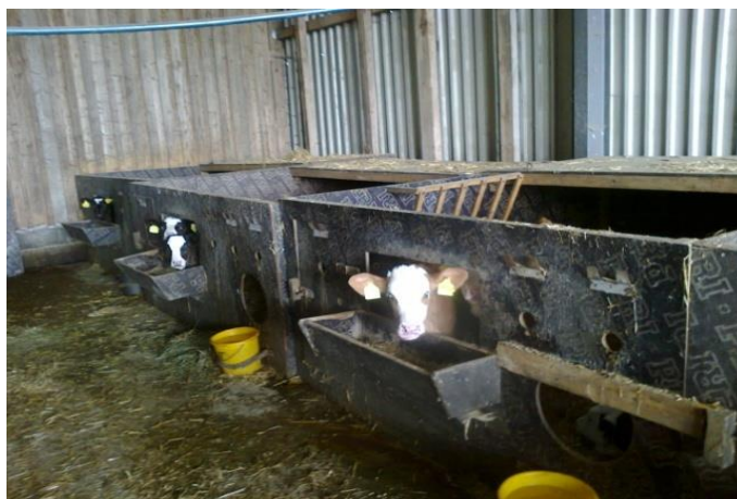
Slika 9. Boksovi za telad