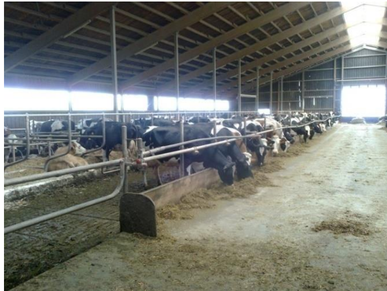
Slika 6. Lauf staja

Na krovu staje postavljene su solarne ćelije koje proizvode energiju za grijanje vode koja se koristi za potrebe farme (pranje izmuzišta i dr.).