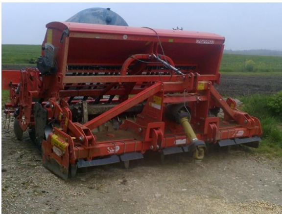
Slika 18. Roto drljača sa sijačicom