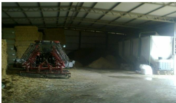
Slika 11. Hala