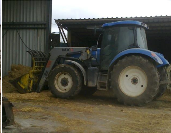
Slika 15. Traktor New Holland TM 125