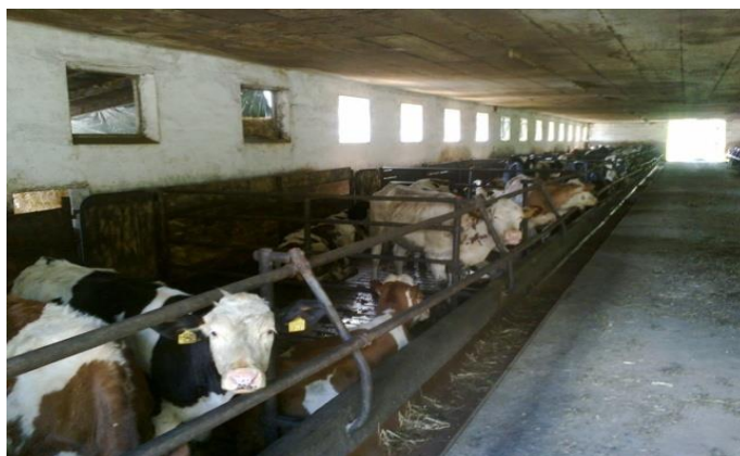
Slika 7. Staja za junice i mušku telad

Staja za junice nalazi se stotinjak metara od prve staje. U njoj obitavaju junice i muška telad starosti oko 7 mjeseci za daljnji tov. U staji se nalazi 9 boksova s jedne i 9 boksova s druge strane. Hodnik dijeli staju na dva dijela i ujedno služi kao hranidbeni stol za životinje. Pod je rešetkast, ventilacija je prirodna, a po potrebi i u kombinaciji sa ventilatorom. Podzemne lagune su kapaciteta 1000 m 3 .