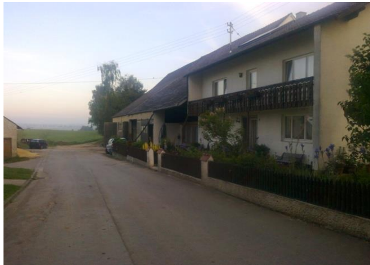
Slika 4. Obiteljska kuća Stadler

Osnovna djelatnost gospodarstva Stadler je proizvodnja mlijeka i tom se djelatnošću bave već 50-ak godina. U samom početku su krenuli sa 30 mliječnih krava, a danas posjeduju staju za 200 mliječnih krava. Za proizvodnju mlijeka najzastupljenija im je holstein pasmina krava te njemački simentalac (Fleckvieh).