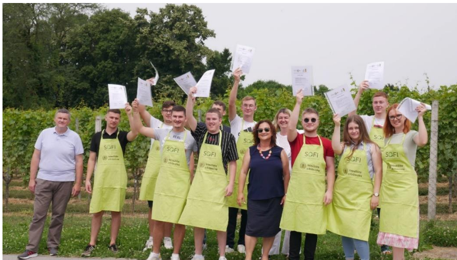
Slika 6. Polaznici Zelenog obrazovnog programa s mentorima, dodjela diploma