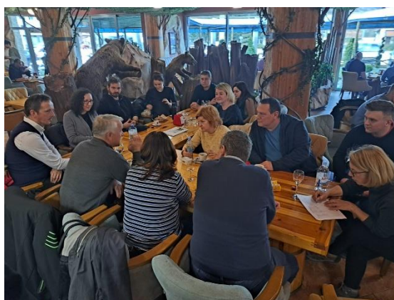
Slika 3. Projektni tim u Travniku (BiH)

Aktivnostima projekta nastoji se doći do krajnjeg cilja, a to je podignuta svijest poljoprivrednih dionika (Križevci i Travnik) o utjecaju poljoprivrednih praksi na klimatske promjene, odnosno potencijalu pametnih organskih poljoprivrednih praksi za ublažavanje njihovog negativnog utjecaja. (Udruga za ekonomiju zajedništva, 2023.) Slika 3. u nastavku prikazuje projektni tim u razgovoru s predstavnicima lokalne samouprave grada Travnika i poljoprivrednicima iz mjesta Guča Gora i Han Bila. U Travniku je u ožujku 2023. godine održana radna sjednica i konferencija „Pametna ekološka poljoprivreda“.