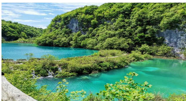
Slika 1. Panorama jezera Kaluđerovac na Plitvičkim jezerima

Plitvička jezera (slika 1) nalaze se na području Ličko-senjske i Karlovačke županije. Nacionalnim parkom proglašena su 8.travnja 1949. godine. Pri osnutku su se prostirala na 19.172 ha, a proširenjem granica u 1997. godini pa sve do danas prostiru se na 29.482 ha. Ogromno prostranstvo dijeli se na šume (22.308 ha), jezera (217 ha), pašnjake i ostalo (6.957 ha). Nacionalni park Plitvička jezera tijekom 2022. godine posjetilo je 1.160.884 posjetitelja. 28