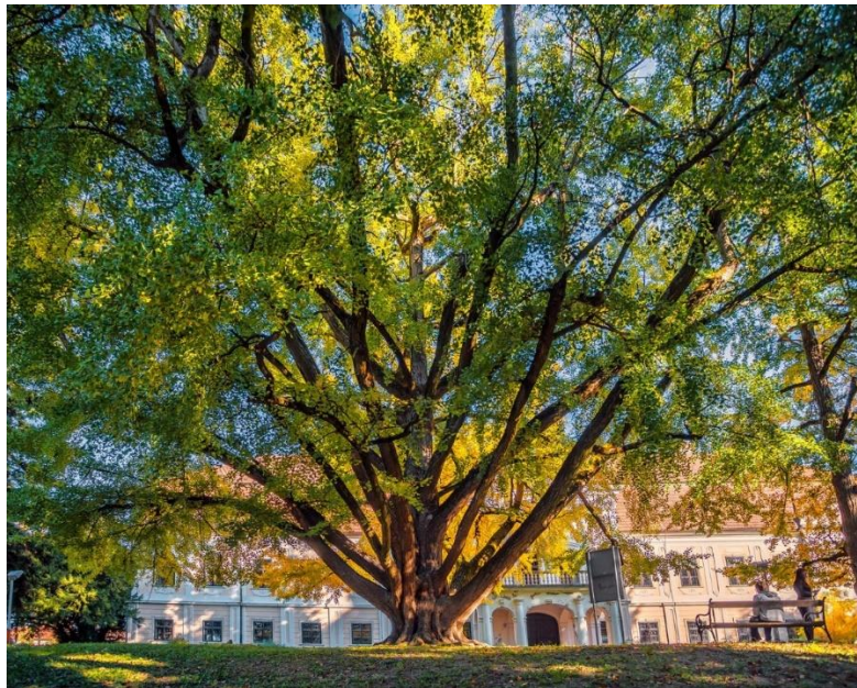
Slika 5. Stablo Ginka u Daruvaru

Stablo Ginka u Daruvaru (slika 6) zaštićeno je kao spomenik parkovne arhitekture. Stablo je nagrađeno dvjema nagradama u 2019. i 2020. godini, a to su Hrvatsko stablo 2019. godine i srebrno Europsko stablo 2020. godine. Stablo se nalazi ispred ulaza u dvorac Antuna Jankovića, a proglašeno je zaštićenim 4.listopada 1967 godine. 49