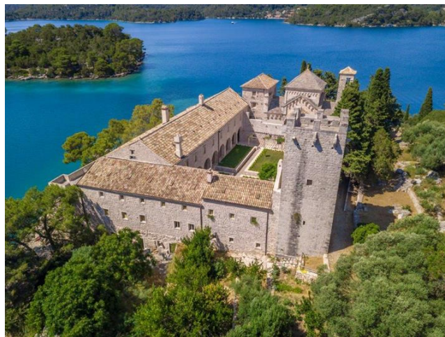
Slika 3. Benediktinski samostan na otoku Sv. Marija

Nacionalni park Mljet (slika 3) osnovan je 11. studenoga 1960. godine. Prostire se na 5300 ha uz morski pojas u širini 500 m od obalne linije, koji je nacionalnom parku dodan 1997. godine. Smještaj je moguće ostvariti u jedinom hotelu koji se nalazi na otoku, hotelu Odisej. 33