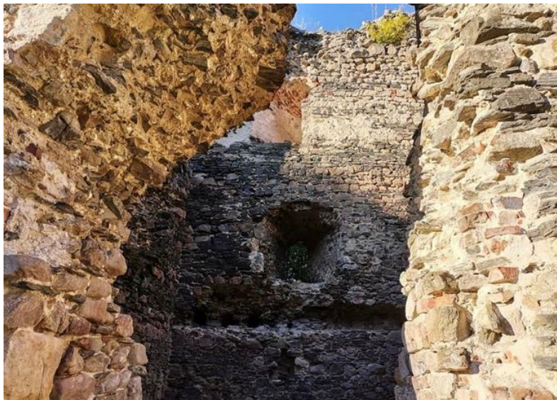
Slika 6. Zidine Garić grada

su danas omiljeno izletišta mnogima. U blizini Garić grada nalazi se i hotel Vila Garić koji ima infrastrukturu za prihvaćanje većeg broja posjetitelja. Garić grad i Vila Garić točke su biciklističke turističke staze i sastajalište planinara. 50