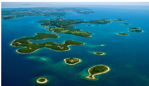
Slika 2. Otočje Brijuna