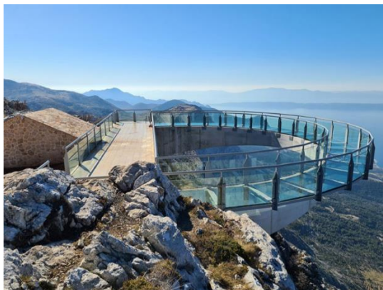
Slika 4. Biokovo Skywalk

Park prirode Biokovo nalazi se na planini Biokovo između rijeke Cetine i Neretve. Parkom prirode proglašen je 1981. godine. Prostire se na površini od 19 550 ha. Park je dio ekološke mreže Natura 2000 u koju su uvrštena područja značajna za ptice, njihova staništa i područja očuvanja značajna za ostale divlje vrste i stanišne tipove od interesa za Europsku uniju. Na području Parka tri su Natura 2000 područja, a to su Biokovo, Podbiokovlje i Biokovo-Rilić. Kao turistička atrakcija na predjelu Ravna Vlačka otvoren je Biokovo skywalk (slika 4) na visini od 1228 m nadmorske visine. Za vedrih dana s njega se pruža pogled čak i na Italiju. 39