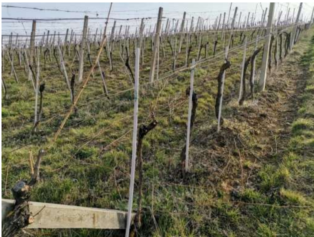
Slika 7. Rezidba vinograda Vinarije Šafran

Rezidba vinograda je posao s kojim počinje sezona radova u vinogradu. Stoga, svaki vinogradar jedva čeka, nakon zimskog odmora, započeti nešto konkretno raditi u vinogradu. Može se reći, da je svaki trs priča za sebe. Svaki trs traži da ga se dobro „odmjeri“ prije rezidbe, pri odluci koje rozgve će se odstraniti, koja ostaviti za lucanj i prigojni reznik, a koja eventualno za pričuvni reznik. Također mora se voditi računa, da trs ne pobjegne previše iznad prve žice, a isto tako, da krakovi ne odu previše u širinu. Najčešći uzgojni oblik vinove loze u vinogradima Vinarije Šafran je modificirani guyot (slika 6.). Modificirani Guyot je oblik gdje se ostavljaju dva reznika sa po dva pupa te jednim lucnjem s šest do dvanaest pupova ovisno o zdravstvenom stanju trsa i broju slobodnih mjesta u redu. Zaključno može se reći da je opterećenje trsa nisko, s 10 do 15 pupova.