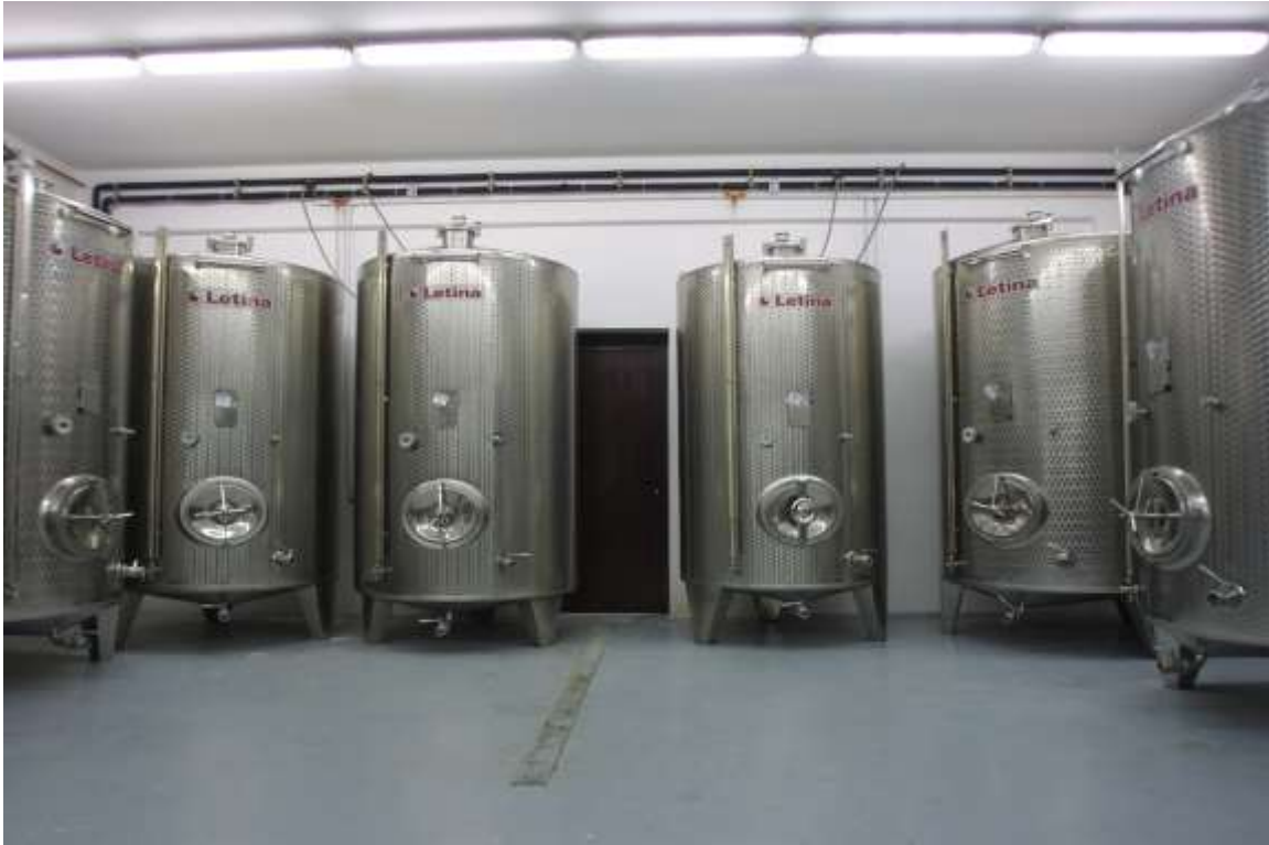
Slika 3. Zatvoreni tipovi sudova od inoxa u vinariji Šafran