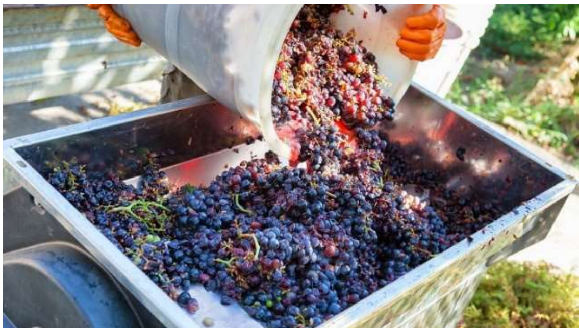
Slika 2. Primjer muljanja i ruljanja grožđa

Ako se želi proizvesti vina voćnog stila temperatura bi trebala biti ispod 14 °C, dok ja za kompleksniji stil između 14 i 20 °C.