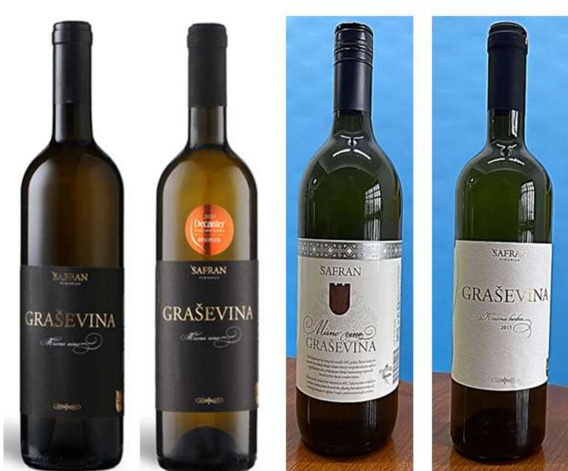
Slika 10. Graševine Vinarije Šafran