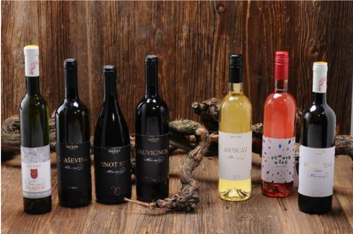
Slika 4. Proizvodni asortiman vina Vinarije Šafran