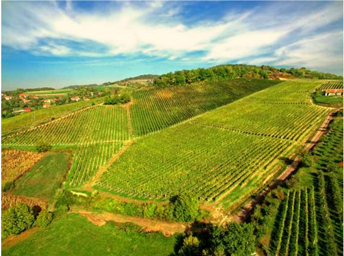
Slika 5. Vinogradi Vinarije Šafran

Uzdržavanje nasada glede agrotehničkih i ampelotehničkih zahvata i mjera njege je besprijekorno, što se reflektira u stalnosti količine i kakvoće prinosa. Starost vinograda je 15 godina, dok je broj trsova po hektaru oko 5.300 trsova. Prosječni broj pupova po trsu iznosi 12, a koeficijent rodnosti pupova iznosi 1,23.