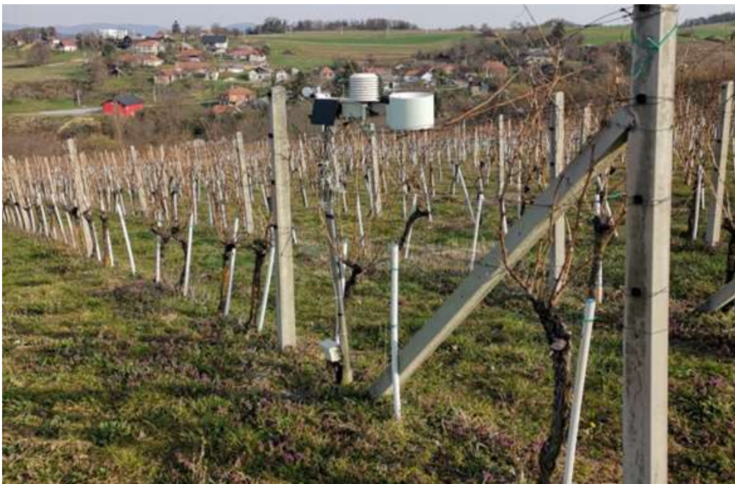
Slika 6. Meteorološka postaja u vinogradu vinarije Šafran

Ni 2019. godina ne moće se smatrati idealnom, doduše mjesec kolovoz je bio izrazito topao i suh, rujn je bio mjesec sa nešto višom prosječnom temperaturom, ali i sa nešto većom kolićinom oborina, a listopad je bio mjesec sa vrlo toplim vremenom i sa izrazito sušnim razdobljem. U 2020. godini kolovoz je protekao uz nešto veće temperature i manju kolićinu oborina, no klimatske prilike i dalje su pogodovale mogućnosti pojave bolesti, rujn je protekao s normalnom kolićinom oborina te nešto višom temperaturom, dok je listopad obilježen s povišenom temperaturom, ali i s povećanom kolićinom oborina. U 2021. godini ljeto je bilo suho s normalnom kolićinom oborina. Mjesec kolovoz je na vinogradarskom lokalitetu protekao uz nešto iznad prosjećnih kolićina padalina, dok su se temperature kretale prema normalnom rasponu. Rujan je bio mjesec idealan za dozrijevanje i berbu pa je tako kolićina padalina bila ispod prosjeka, a temperatura se karakterizira kao normalna. Moće se zaključiti da je to bila ponajbolja vegetacijska godina u promatranom razdoblju.