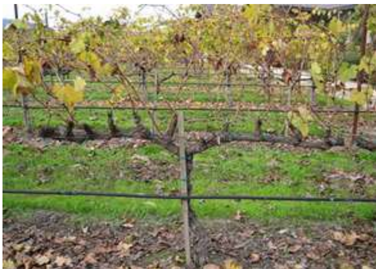
Slika 1. Prikaz naslona u vinogradu