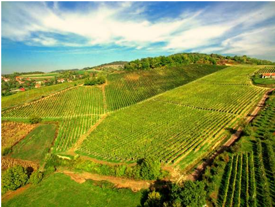
Slika 5. Vinogradi Vinarije Šafran

Uzdržavanje nasada glede agrotehničkih i ampelotehničkih zahvata i mjera njege je besprijekorno, što se reflektira u stalnosti količine i kakvoće prinosa. Starost vinograda je 15 godina, dok je broj trsova po hektaru oko 5.300 trsova. Prosječni broj pupova po trsu iznosi 12, a koeficijent rodnosti pupova iznosi 1,23.