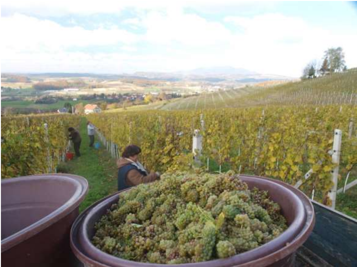
Slika 8. Berba grožđa u vinogradu Vinarije Šafran