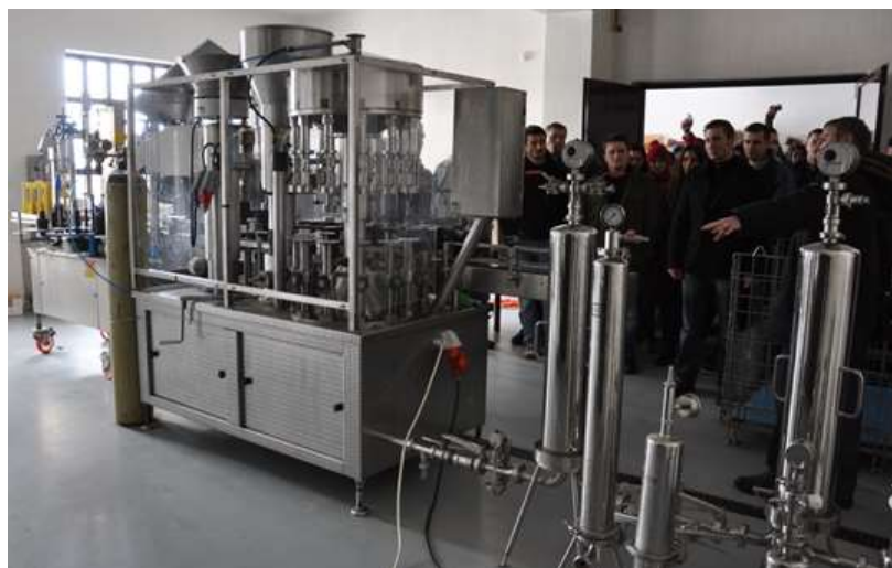
Slika 9. Drveni sudovi i linija za punjenje vina u ambalažu u Vinariji Šafran