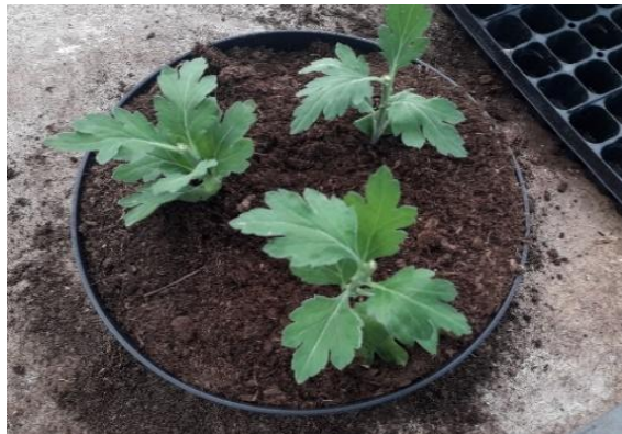
Slika 4. Tri sadnice na tri vrha

Optimalno vrijeme sadnje krizantema određuje se na način da od željenog vremena cvatnje oduzmemo broj tjedana vremenske reakcije kultivara i još tri do sedam tjedana za vegetativni rast (Bauer-Mikić, 2004.). Krizanteme za rez sade se u pripremljene gredice, dok se krizanteme namijenjene za prodaju kao lončanice najčešće sade u cvjetne posude promjera 25 cm. Sadnja u cvjetne posude može biti mehanizirana ili ručna, ovisno o proizvodnom kapacitetu. U cvjetne posude se najčešće sadi po šest biljaka ako se uzgoj planira na jedan vrh (Slika 6. i Slika 7.), ili tri biljke ako se uzgoj planira na tri vrha (Slika 4. i Slika 5.).