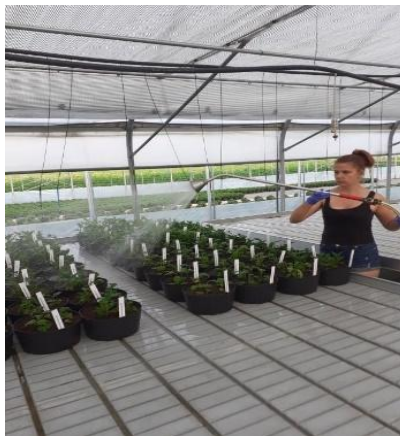
Slika 2. Rošenje mladih biljaka nakon sadnje

Krizantema ima velike potrebe za vodom u vrijeme zametanja i razvoja pupova te joj je potrebno omogućiti dovoljnu količinu vode. Količinu vode treba prilagoditi rastu biljaka, tipu tla, sadržaju vode i hranjiva u tlu/supstratu te vremenskim prilikama (Pagliarini i sur., 1997.). Dovoljnu količinu vode može se osigurati na više načina. Sistem “kap na kap” i sistem “potopnih stolova” najčešće se koriste u praksi dok se sustav raspršivanja ne preporuča jer omogućuju lakše širenje gljivičnih bolesti. Putem sustava za navodnjavanje osim vode možemo biljkama dozirati i hranjiva (Bauer-Mikić, 2004.).