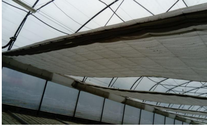
Slika 15. Energetske zavjese na poljoprivrednom gospodarstvu Težak