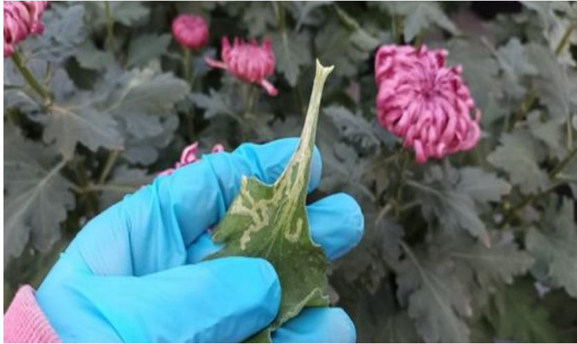
Slika 12. Štete od lisnog минера