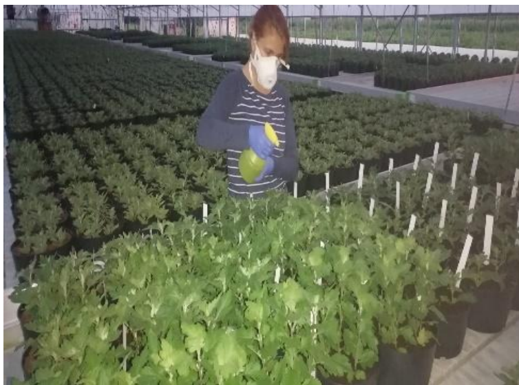
Slika 23. Primjena zaštitnih sredstava na pokusu