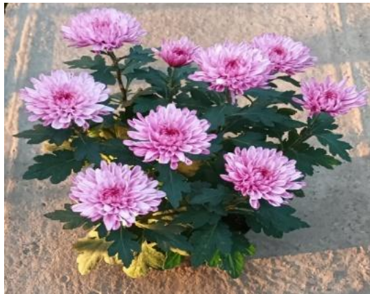
Slika 5. Devet cvjetnih glava iz tri sadnice