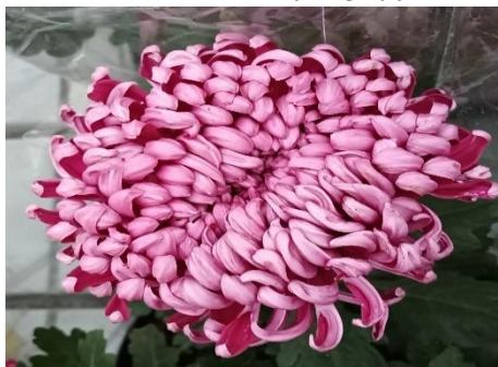
Slika 18. Chrysanthemum indicum Cosmo Purple