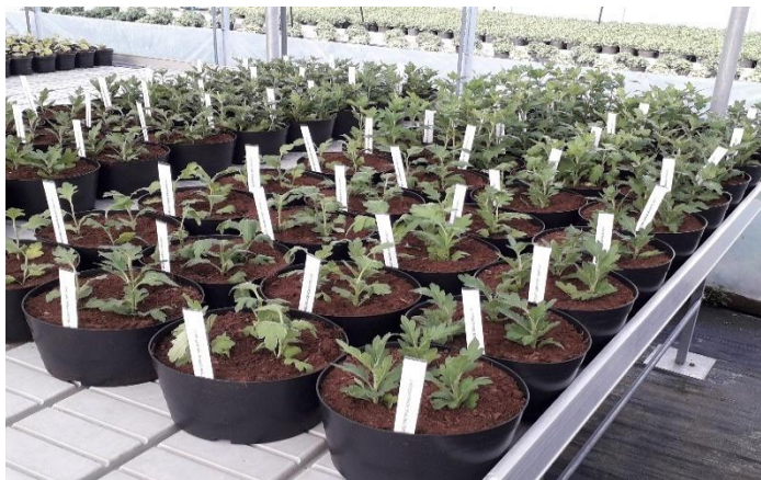
Slika 16. Krizanteme u potopno- pomičnim stolovima