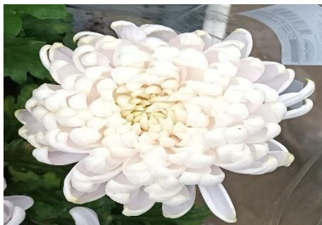
Slika 19. Chrysanthemum indicum Cosmo White