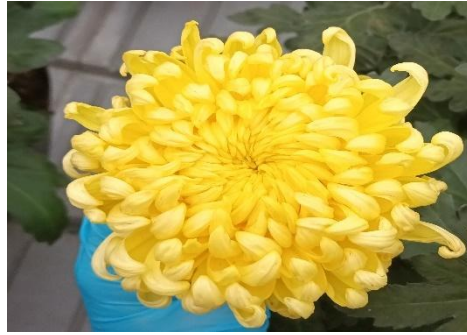
Slika 21. Chrysanthemum indicum Cosmo Yellow Improved