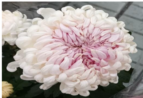
Slika 20. Chrysanthemum indicum Cosmo Fresh lime