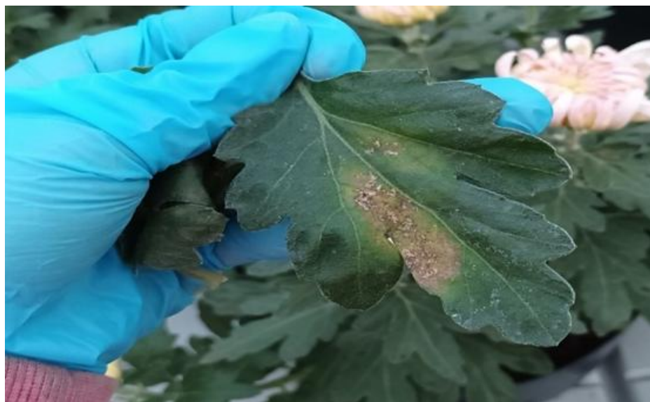
Slika 11. Štete od kalifornijskog tripsa

Potrebno je redovito vršiti kontrolu pojave štetnika pomoću ljepljivih ploča, kako bi se moglo pravodobno tretirati i zaštititi biljke. Ukoliko dođe do pojave štetnika na krizantemama iste je potrebno tretirati kemijskim ili biološkim pripravcima.