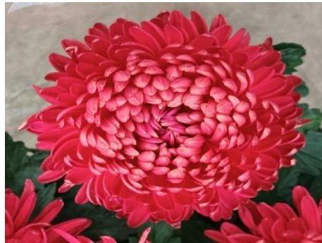
Slika 17. Chrysanthemum indicum Cosmo Bordeaux