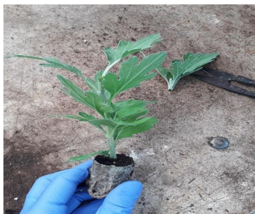
Slika 10. Postupak dekaptiranja krizanteme