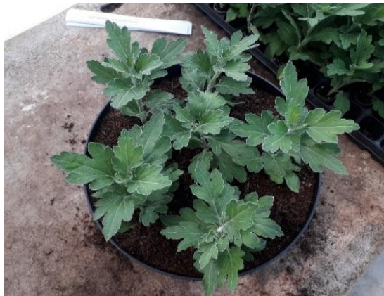
Slika 6. Šest sadnica na jedan vrh