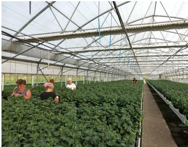
Slika 8. Pinciranje zaperaka na krizantemi

Pod pojmom pinciranje podrazumijeva se odstranjivanje postranih pupova, koji nisu bitni u proizvodnji te biljka nepotrebno troši snagu i hranjiva na njihov rast. Pinciranje je obavezna mjera njege kod veliko cvjetnih krizantema te se obavlja višekratno ovisno o formiranju bočnih pupova. Ako se krizanteme sade kasnije, tada se iz svake sadnice dobiva po jedan cvijet na način da se ostavi samo glavni pup, a svi postrani pupovi se moraju skinuti. Osim pinciranja u proizvodnji se provodi i dekaptiranje odnosno skidanje centralnog cvjetnog pupa. Kod krupnocvjetnih krizantema dekaptiranje se radi ako su sadnice posađene ranije i ako se iz jedne biljke želi dobiti više cvjetova (najčešće tri). Kada iz sadnice izrastu novi izboji, ostavlja se onoliko izboja koliko se želi cvjetova i na tim izbojima se vršni pupovi ostavljaju, a svi ostali izboji se opet pinciraju.