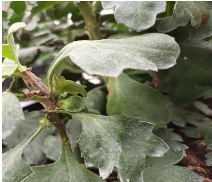
Slika 11. Štete uzrokovane bakterijom Erwinia chrysanthemi

Bakterijske bolesti (bakterioze) sprječavaju se sadnjom zdravog i certificiranog sadnog materijala. Prevencija se sastoji od primjene preparata na bazi bakra, a ukoliko dođe do zaraze zaražene biljke se uklanjaju iz nasada.