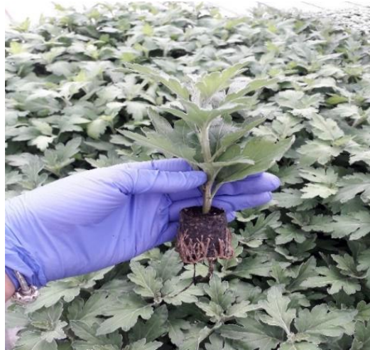
Slika 3. Ukorijenjena sadnica krizanteme