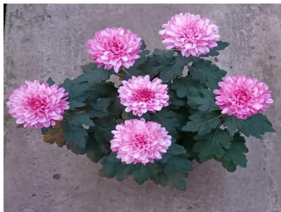
Slika 7. Šest cvjetnih glavica iz šest sadnica