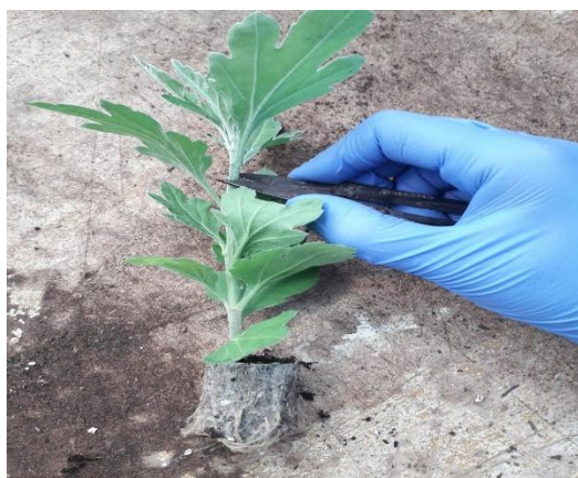
Slika 9. Postupak dekaptiranja krizanteme