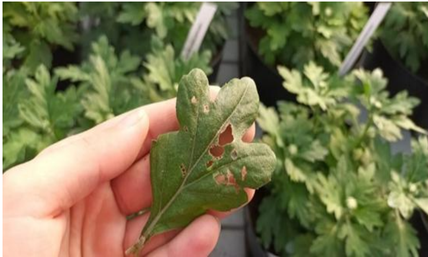
Slika 13. Štete od lisnih sovica