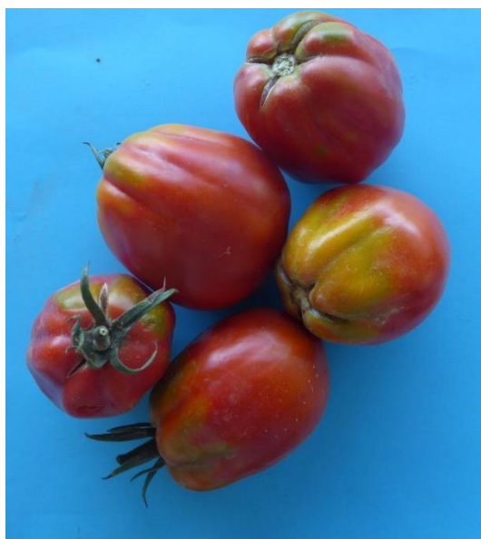
Slika 44. Zreli plodovi hibrida Amauri