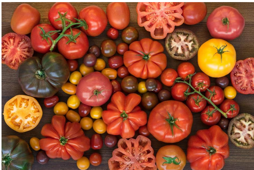
Slika 7. Oblici plodova rajčice