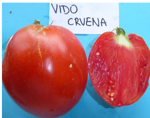
Slika 34. Zreli plod rajčice sorte Vido crvena