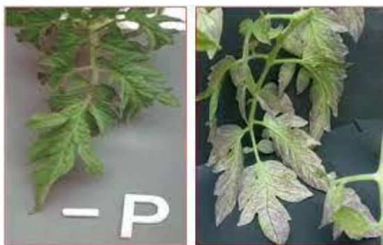
Slika 10. Simptomi nedostatka fosfora na listu rajčice