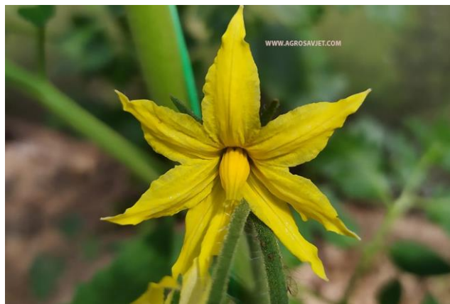
Slika 4. Cvijet rajčice