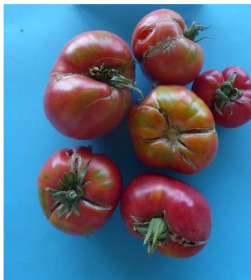
Slika 42. Zreli plodovi rajčice certificirane kao Volovsko srce dobavljača 2

Plodovi su bili u tipu jabučara sa jako udubljenim ožiljkom od peteljke, zeleno žutim dijelom uz peteljku i skloni pucanju (Slika 42.).