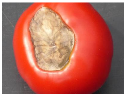
Slika 15. Vršna trulež ploda rajčice

Od fizioloških promjena na rajčici najznačajnija je vršna trulež ploda i nejednolična obojenost plodova rajčice. Vršna trulež ploda (Slika 15.) nastaje kao posljedica fizioloških poremećaja u usvajanju kalcija. Pojavljuje se na kiselim tlima koja imaju manjak ili je njegovo usvajanje iz tla otežano. Takvi uvjeti obično nastaju kada je tlo suho, kada nakon suše padnu obilnije oborine ili kada se prekasno počne navodnjavati (Matotan, 2004).