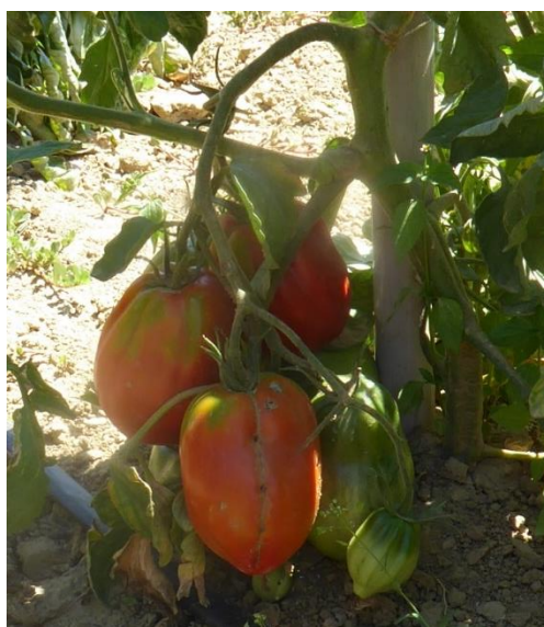
Slika 43. Rajčica sorte Amauri F-1

Osim standardnih sorata u istraživanje je bila uključena i hibridna sorta Amauri. Sorta Amauri imala je ujednačene plodove, ali nisu bili u tipu volovskog srca (Slika 43.).