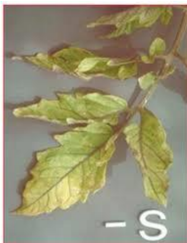
Slika 14. Nedostatak sumpora u rajčici