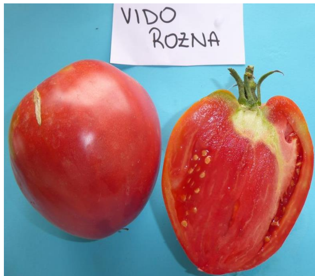
Slika 38. Zreli plod rajčice sorte Vido rozna