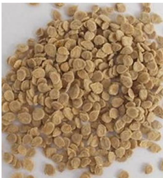
Slika 8. Sjeme rajčice

Sjeme je sitno, plosnato, bubrežastog oblika, obraslo dlačicama, dužine 2 - 4 mm. Masa 1000 sjemenki iznosi 2,7 - 3,5 g, a 1 kg sjemena sadrži 300 - 350 000 sjemenki. U kontroliranim uvjetima zadržava klijavost 4 - 6 godina, posle tog perioda energija klijanja naglo pada, a klijavost sjeme može zadržati i do osam godina (Milošević i Kobljinski, 2011.).