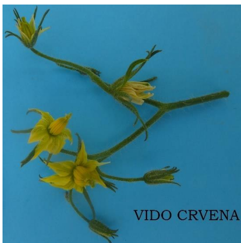
Slika 32. Cvat rajčice sorte Vido crvena

Cvjetovi su žute boje, dlakavi, u jednom cvatu ih ima od šest do osam, nejednoliko cvatu, pa su neki već ocvali dok se drugi tek otvaraju (Slika 32.).