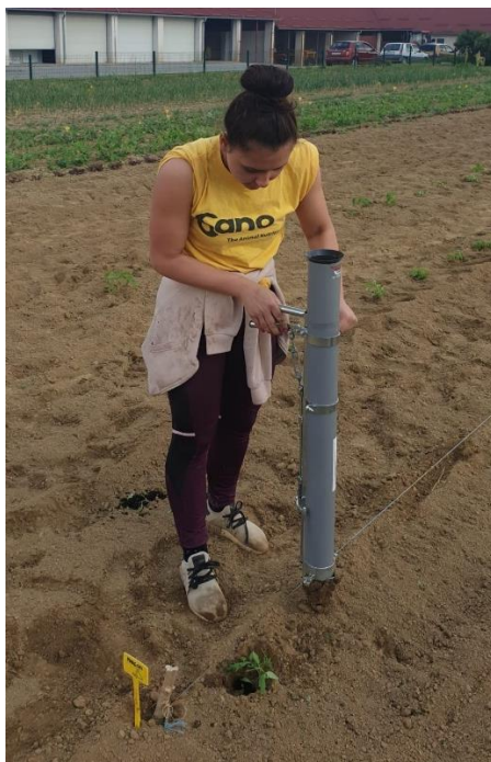
Slika 17. Sadnja presadnica

je obavljena 12.05.2022. u redove koji su izvučeni špagom. Od svake sorte posađeno je 20 biljaka na razmak 30 cm između biljaka i jedan metar između redova. Sadnja je obavljena ručnom sadilicom na način da je u sadilicom iskopana rupa, kroz cijev sadilice zalijevačem je zalijana rupa i na kraju je u cijev spuštена presadnica. Nakon toga tlo oko presadnica lagano je utisnuto (Slika 17.).