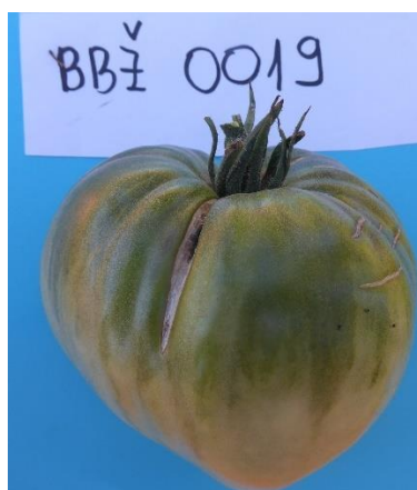
Slika 29. Zeleni plod rajčice sorte BBŽ 0019

Prije potpune zrelosti na plodovima je vidljiv zeleni dio oko peteljke ploda koji obuhvaća dvije trećine ploda (slika 29.).