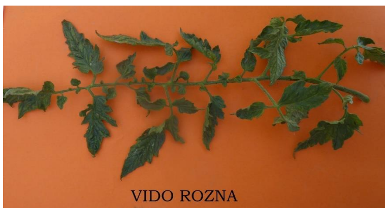
Slika 35. List rajčice sorte Vido rozna

Sorta Vido rozna opisana je kao sorta rozih plodova u tipu volovskog srca. Kod ove sorte svih 20 biljaka imalo je plodove u tipu volovskog srca. Sorta je srednje rana, indeterminantnog tipa rasta sa srednje dugačkim internodijima, visokom stabljikom koja mora rasti uz potporanj. Listovi su poluspravni u odnosu na glavnu stabljiku prosječne dužine 32 cm i širine 13 cm, neparnoperasti s dugom peteljkom. Liske su svijetlozelene boje bez izraženog sjaja, dosta nazubljene i prema vrhu zašiljene, duboko i gusto urezane (Slika 35.).