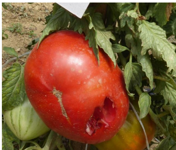
Slika 45. Oštećenja od vrana na zrelim plodovima rajčice

Sve istraživane sorte ubrajaju se u rane ili srednje rane sorte, nije bilo velike razlike u vremenu dozrijevanja plodova. Tijekom vegetacije nije se provodila kemijska zaštita protiv bolesti jer zbog izrazito sušnog vremena nije bilo uvjeta za razvoj bolesti. Problem u početku vegetacije predstavljala je vršna trulež koja se javila na svim sortama, osim na hibridnoj sorti Amauri. Najveće štete su u vegetaciji radile vrane koje su oštećivale zrele plodove (Slika 45.) tijekom cijele vegetacije.