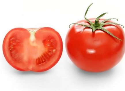
Slika 5. Plod rajčice

Plodnica iz koje se razvija plod (mesnata bobica) može biti dvogradna, trogradna ili višegradna (Lešić i sur., 2004.). Plod je sočnamesnata bobica različitog oblika i veličine, najčešće crvene boje (Slika 5.) (Matotan, 1994.). Sastoji se od mesa (stjenke perikarpa + pokožica) i pulpe (placenta + sjemenke + želatinozno tkivo oko sjemenki koje ispunjava komore) (Lešić i sur., 2004.).