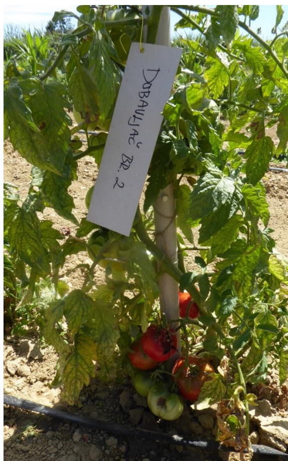
Slika 41. Rajčica certificirana kao Volovsko srce dobavljača

Biljke uzgojene iz sjemena certificiranog kao Volovsko srce dobavljača 2 nisu imale plodove u tipu volovskog srce te nije vršen opis morfoloških svojstava.