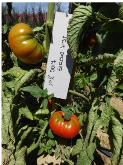
Slika 20. Sorta VPŽ 0017 – biljke sa širokim listom

Od 20 posađenih biljaka kod sorte VPŽ 0017 ni jedna nije bila u tipu volovskog srca. Devet biljaka imalo je krupne plodove u tipu jabučara, te izrazito široke listove nalik listovima krumpira, dok je kod drugih 11 biljaka plod bio kruškolikog oblika (Slika 20.).