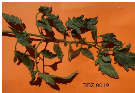
Slika 27. List rajčice sorte BBŽ 0019

Sorta BBŽ 0019 je rana sorta indeterminantnog tipa rasta i mora uzgajati uz potporanj. Internodiji su srednje veličine. Listovi su veliki, polusavijeni, neparnoperati sa srednje dugačkom peteljkom i blago urezanim liskama koje su naborane, dlakave te su na vrhu zašiljene. Prosječna dužina listova je 31 cm, a širina 18 cm (slika 27.). Liske su duboko urezane, tamnozeleno boje sa slabo izraženim sjajem. Listovi djelomično pokrivaju plodove.