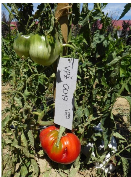
Slika 21. Sorta VPŽ 0017- biljke sa uskim listom