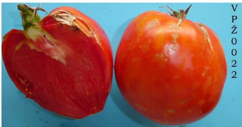
Slika 25. Plod rajčice

Plodovi su srednje veličine, imaju blago izduženi oblik s šiljastim vrhom, prosječne dužine 8,3 cm, širine 9,1 cm i težine 384,6 g, nemaju zeleni dio uz peteljku, ni izražena rebra oko peteljke ploda. Kod ove sorte je izraženo koljence na peteljci ploda pa se plodovi teže beru. Meso ploda ima gustu strukturu, plod srednje čvrstoće i nije pogodan za dugo čuvanje i transport, sklon je pucanju uz peteljku (Slika 25.).