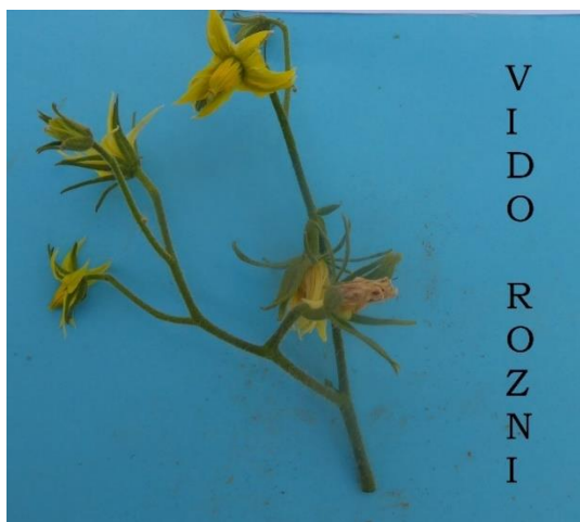
Slika 36. Cvat rajčice sorte Vido rozna