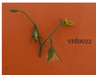
Slika 23. Cvat rajčice sorte VPŽ0022

Cvjetovi su žute boje, sa slabom izraženim dlačicama. U jednom cvatu je u prosjeku tri do četiri cvijeta, srednje veličine (Slika 23.).