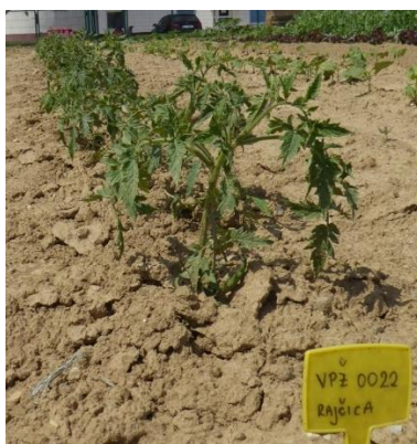
Slika 18. Oznaka sorte na početku svakog reda

Na početka svakog reda stavljena je oznaka sorte (Slika 18.).