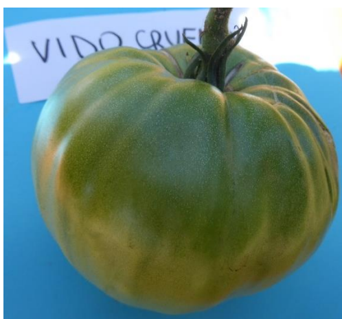
Slika 33. Zeleni plod rajčice sorte Vido crvena

Zeleni plodovi imaju izražen tamnije zeleni dio uz peteljku do sredine ploda (Slika 33.).