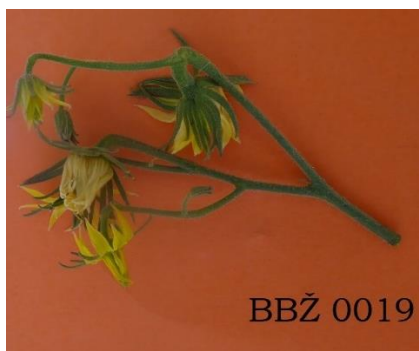
Slika 28. Cvat rajčice sorte BBŽ 0019

Cvjetovi su žute boje, izrazito veliki i u jednom cvatu ih ima od četiri do osam (Slika 28.).