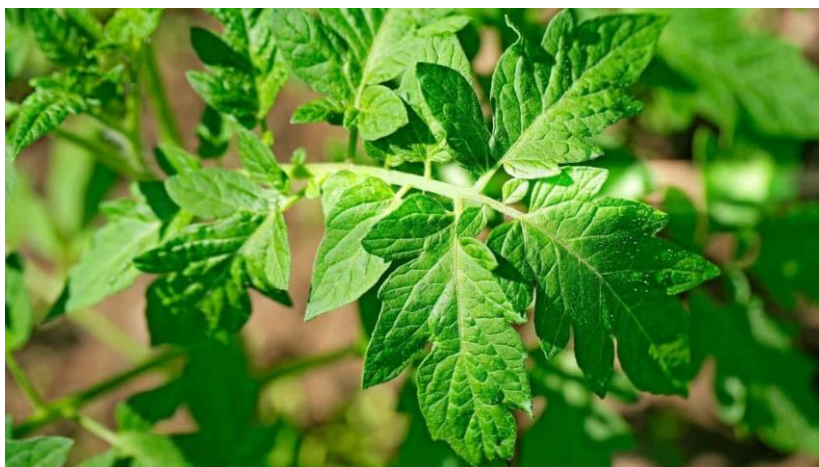
Slika 3. List rajčice

List rajčice je neparno perast na dugoj peteljci. Liske su nejednake veličine, romboidnog oblika, manje ili više nazubljene, naborane i dlakave (Slika 3.) (Lešić i sur., 2002.).