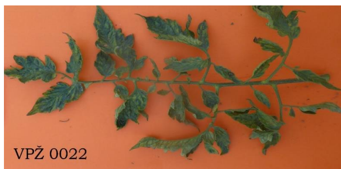
Slika 22. List rajčice sorte VPŽ 0022

Kod sorte VPŽ 0022 plodove u tipu volovskog srca imalo je 12 biljaka, jedna biljka imala je plodove u tipu jabučara i vrlo krupne listove dok je kod ostalih biljaka oblik ploda bio između jabučara i volovskog srca. Opis je vršen samo na biljkama čiji plodovi su bili u tipu volovskog srca. Sorta je srednje rana, indeterminantnog tipa rasta, visoka i mora se uzgajati uz potporanj. Internodiji su srednje veličine bez obojenosti antocijanom. Peteljke lista su blago uzdignute u odnosu na glavnu stabljiku. Listovi su neparnoperastog oblika, uski i jako uvijeni u odnosu na glavnu stabljiku i prekrivaju plodove. Liske su blago urezane i naborane te zašiljene na vrhu, tamnozeleno boje sa slabom izraženim sjajem. Prosječna dužina listova je 29 cm, širina 17 cm (slika 22.).