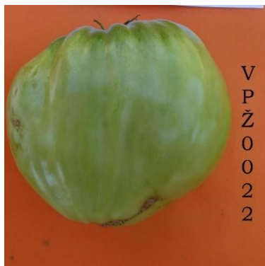
Slika 24. Zeleni plod rajčice VPŽ 0022

Zeleni plodovi imaju blago izražene svijetlije pruge (Slika 24.).