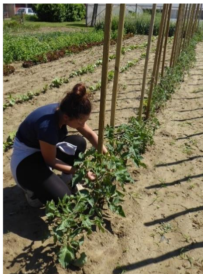
Slika 19. Vežanje rajčica uz drvenu armaturu

Dva tjedna nakon sadnje postavljeni su drveni stupovi kao potporanj. Biljke su vezane uz stupove konopljinim vezivom (Slika 19.).