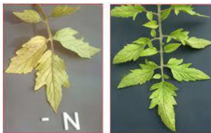
Slika 9. Simptomi nedostatka dušika na listovima rajčice

Biljka je vretenastog izgleda te joj je usporen rast. Donje lišće počinje žutiti, a kasnije cijela biljka poprima blijedozelenu boju. Lisne plojke su okomite i sitnije nego obično s ljubičastom nervaturom na naličju, plodovi su također sitni (Slika 9.) (Lešić i sur., 2002.).