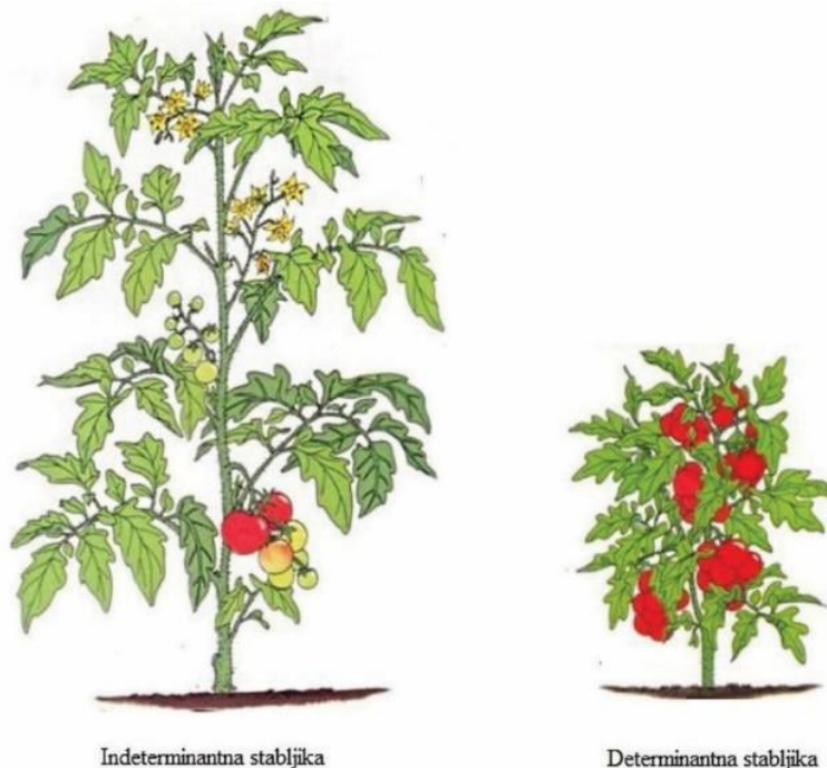
Slika 2. Indeterminantni i determinanti tip rajčice

Stabljika je zeljasta, promjera 2 cm i prekrivena dlačicama. Glavni problema je taj što nema dovoljno sklerenhima pa kada je opterećena lišćem i plodovima, bez potpore, stabljika pada. Postoje dva osnovna tipa stabljike, determinantan i indeterminantan. Determinantna stabljika ima kraće internodije, a glavna stabljika naraste 0,5 m do 1 m u visinu. Nakon prvog cvata formira se jedan do dva lista, zatim drugi koji može biti i posljednji cvat na glavnoj stabljici ili se formira još jedan do dva lista i rast završava trećim cvatom. Istovremeno se formiraju sekundarne grane iz pazuha listova te se cvatnja i plodonošenje događa združeno (Slika 2.) (Lešić i sur., 2004.). Indeterminantna stabljika može narasti nekoliko metara. Dok ima povoljne uvjete vegetacijski vrh je aktivan. (Slika 2.).