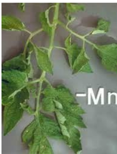
Slika 11. Simptomi nedostatka magnezija na listovima rajčice

Kod nedostatka magnezija rubovi starijeg lišća požute, a žućenje se širi između nervature prema vrhu. Mogu se pojaviti sitne nekrotične pjege, koje nisu udubljene (Slika 11.). U kasnijem stadiju cijela biljka požuti i donje lišće otpada (Lešić i sur., 2002.).