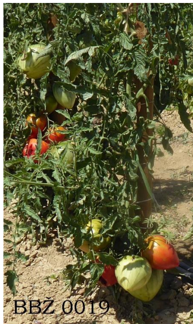
Slika 26. Sorta BBŽ 0019

Kod sorte BBŽ 0019 najviše biljka imalo je plodove i tipu volovskog srca, samo jedna biljka nije bila u tipu volovskog srca, ostale su bile ujednačenih plodova (Slika 26.).