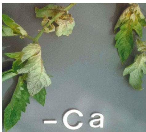
Slika 13. Nedostatak kalcija u rajčici

Kod nedostatka kalcija korijen je slabo razvijen i smeđe je boje. Vršno je lišće sitnije, gornja strana mu je tamnozeleno s blijedim rubom, a donja ljubičasta. Nekroza se javlja od rubova lista i izaziva uvijanje lista. Nekrotične pjege se šire na donje listove (Slika 13.). Plodovi imaju simptome vršne truleži rajčice (Lešić i sur., 2002.).