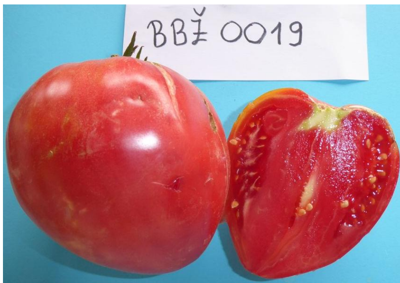
Slika 30. Zreli plod rajčice sorte BBŽ 0019