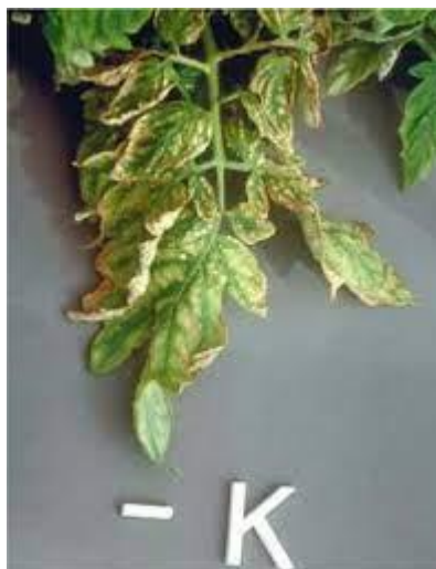
Slika 12. Nedostatak kalija na listu rajčice