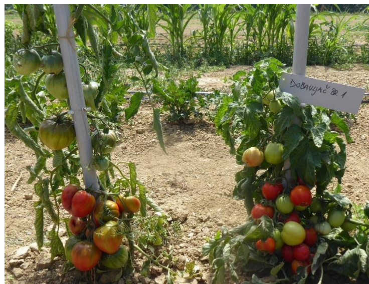
Slika 39. Rajčica certificirana kao Volovsko srce dobavljača 1

Od 20 biljaka certificirane sorte Volovsko srce dobavljača 1 samo jedna biljka je imala plodove u tipu volovskog srca te nije vršeno opisivanje morfoloških svojstva. Ostale biljke imale su plodove u tipu jabučara (Slika 39.).