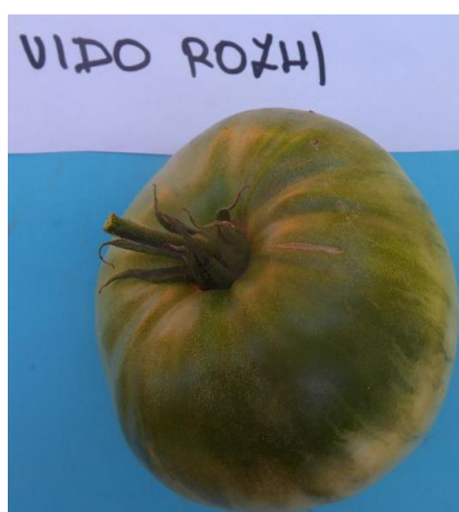
Slika 37. Zeleni plod rajčice sorte Vido rozna

Na zelenom plodu vidljiv je zeleni dio uz peteljku do polovice ploda (Slika 37).