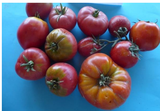
Slika 40. Zreli plodovi rajčice certificirane kao Volovsko srce dobavljača 1

Zreli plodovi su bili u tipu jabučara, različitih veličina, kod većine plodova sa jako izraženim zelenim dijelom uz glavnu peteljku i sa izraženim rebrima uz glavnu peteljku (Slika 40).