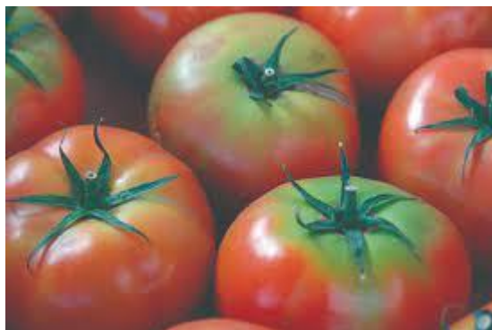
Slika 16. Nejednolična obojenost ploda

Kod nejednolične obojenosti ploda javlja se zeleni prsten oko čaške ploda, odnosno žuti prsten tvrđeg tkiva (Slika 16.). Ova pojava javlja se kad je plod zreo i to češće kod sorti koje imaju više klorofila u perikarpu ploda. Javlja se u uvjetima visokih temperatura i nedovoljne opskrbljenosti ploda kalijem ili pri neodgovarajućem odnosu dušika i kalija. Može se javiti tijekom proljeća pri uzgoju u zaštićenom prostoru kad je na biljci zametnuto puno plodova (6 do 8 grozdova), a zrioba još nije započela ( https://gospodarski.hr/rubrike/povrcarstvo-rubrike/ ).