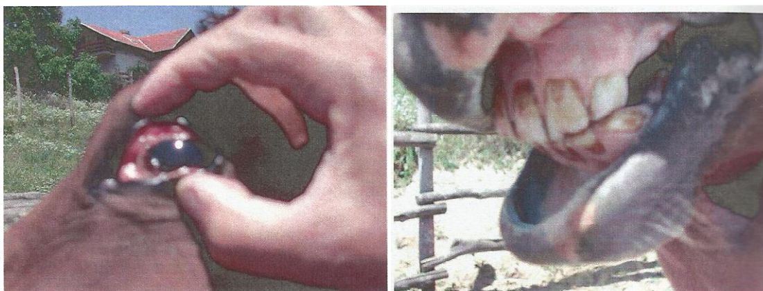
Slika 9. Pregled sluznice oka i provjera stanja kapilarne cirkulacije radi utvrđivanja eventualne dehidriranosti