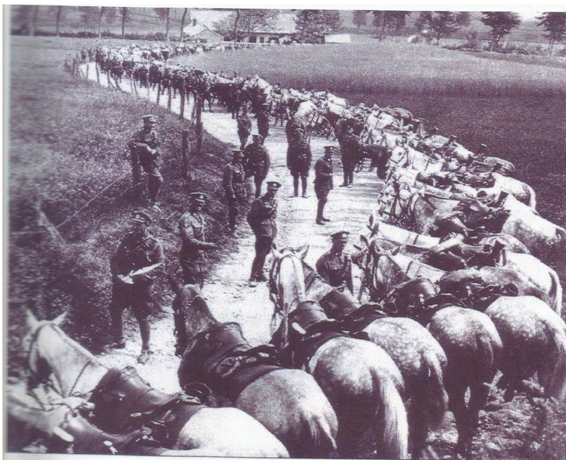
Slika 3. Austro-Ugarska konjica početkom 20. stoljeća

Ova disciplina se kao sport razvila iz vojne obuke konjičkih postrojbi koje su jahanjem savladavale velike udaljenosti nastojeći pri tom ostati borbeno sposobne. Krajem 19. i početkom 20. stoljeća takve vojne vježbe provodile su se u mnogim zemljama pa tako i u Austro-Ugarskoj monarhiji. Kako je i Hrvatska bila dio Austro-Ugarske monarhije, a hrvatske postrojbe lake konjice značajan i vrlo cijenjen dio tadašnje vojske, možemo pretpostaviti da su takve vojne konjičke vježbe provođene i u našoj zemlji, iako o tome nema pisanog traga.