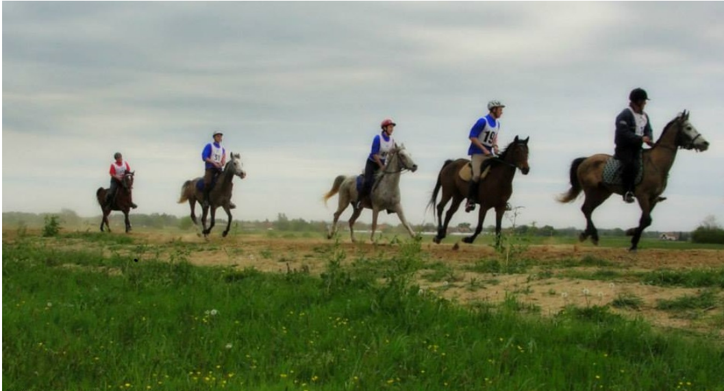
Slika 5. Utakmica u daljinskom jahanju - Croatia Cup Otrovanec

Svoje osobine iznimno dobro prenosi na svoje potomke pa u križanju sa drugim pasminama daje konje koji su se pokazali jednaki, a često i s boljim rezultatima u daljinskom jahanju. Dokaz tome je veliki postotak (90%) arapskih konja i konja s velikim postotkom njihove krvi u samom vrhu daljinskog jahanja.