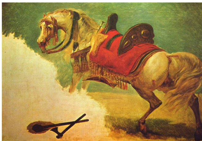
Slika 1. Arapski konj u pustinji, Antonie-Jean Gros, c. 1810

Sve priče o pasminama konja, bez obzira na kojem kontinentu se vodile, moguće su samo uz spomen na arapskog konja. On se smatra jednom od najstarijih pasmina. Konji ove pasmine egzistiraju na Arapskom poluotoku više od 3.500 godina, što je dokazano putem analize fosila, kao i crteža pronađenih na stijenama. Ti crteži pokazuju konje slične današnjem arapskom konju.. Beduinska plemena sa Arapskog poluotoka i okolnih područja, stoljećima uzgajaju svoje konje sa fantastičnom pažnjom i ljubavlju, vodeći, pri tome, računa o održavanju kvalitete i čistoće pasmine.