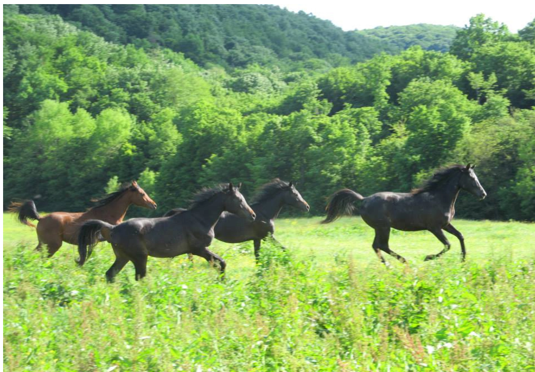
Slika 4. Omice na pašnjaku