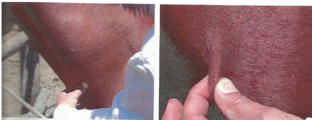
Slika 10. Mjesto pritiska na jugularnom žlijebu i provjera elastičnosti kože

Punjenje jugularne vene se provjerava tako da se vena pritisne neposredno prije prednjeg grudnog otvora. Fiziološki se ona napuni krvlju unutar 1 do 2 sekunde. Elastičnost kože provjerava se „štibanjem“ kože u području ramena. Gubitkom tekućine smanjuje se elastičnost kože i kožni nabor se sporije vraća u početni položaj. No, elastičnost kože može biti smanjena i zbog manje količine masti u potkožju, što i treba biti kod konja u dobroj kondiciji. Ovaj test otkriva tek znatno dehidriranog konja.