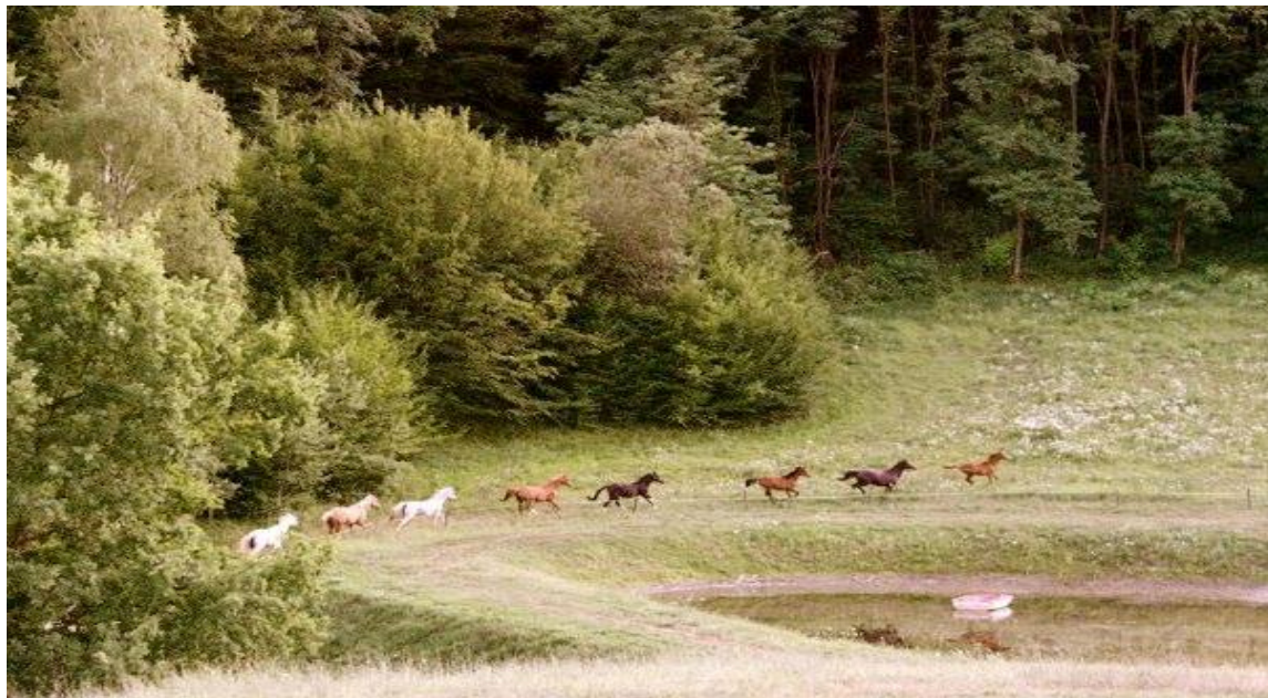
Slika 11. Kobile i kastrati na pašnjaku

Pašnjak je konju nenadomjestiv prostor za život i razvoj; ne samo zbog prehrambenih potreba, nego i zbog kretanja i boravka na zraku i suncu.