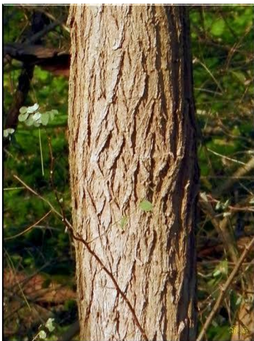
Slika 2 Stablo bagrema