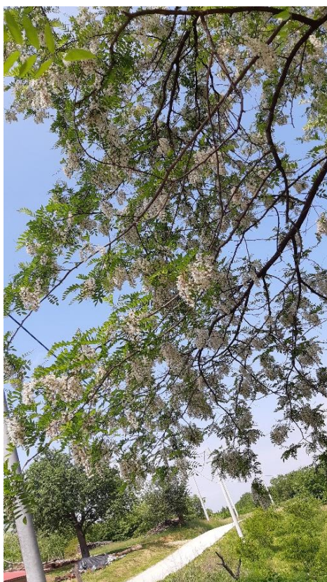
Slika 1: Cvatnja bagrema

Cvatnja bagrema dolazi u prvoj polovici svibnja, prije nego što drvo bagrema prolista. Ako drvo bagrema prije prolista tada će cvijet bagrema biti manji, što će uzrokovati manji prinos nektara. Cvatnja bagrema (Slika 1.) traje oko 12 dana ovisno o vremenskim prilikama. U vrijeme cvatnje pčele sakupljaju nektar, koji potom nose u košnice gdje ga odlažu u saće. Prerađivanje nektara u med traje 4-5 dana, kada on potpuno dozrije pčele ga poklope voštanim poklopcima. Potpuno dozrio med se uzima te nosi u prostoriju u kojoj se radi vrcanje meda (Šimić, 1977).