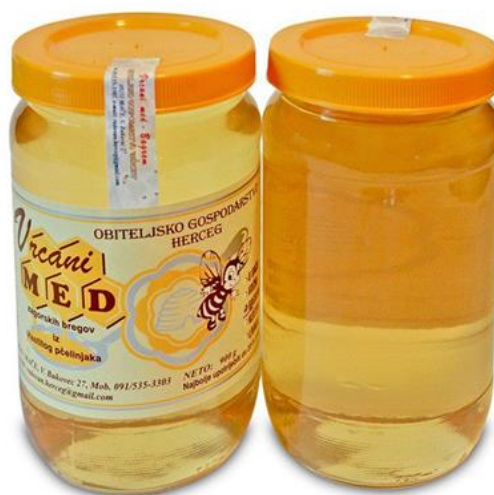
Slika 7 Med bagrem

Kao i sve ostale vrste meda tako i bagremov med u sebi može sadržavati bakteriju Clostridium botulii koja je izazivač botulizma, pa se zato ne preporučuje da ga konzumiraju djeca mlađa od godinu dana (IP 8 ).