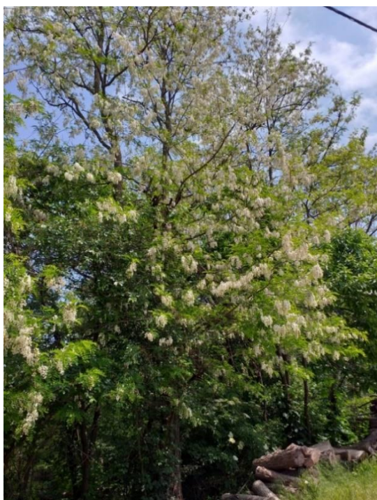
Slika 3 Krošnja bagrema