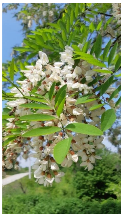
Slika 4 Listovi bagrema