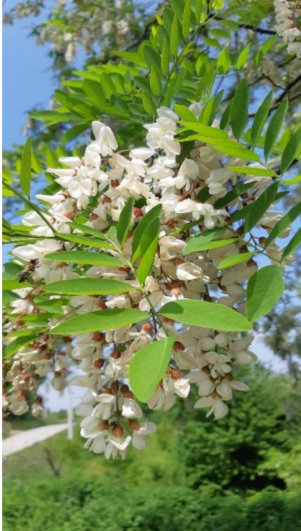
Slika 6 Cvijet bagrema