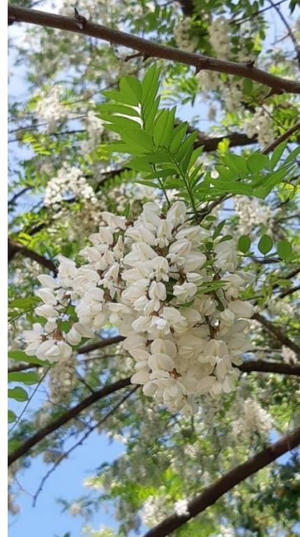
Slika 5 Cvijet bagrema